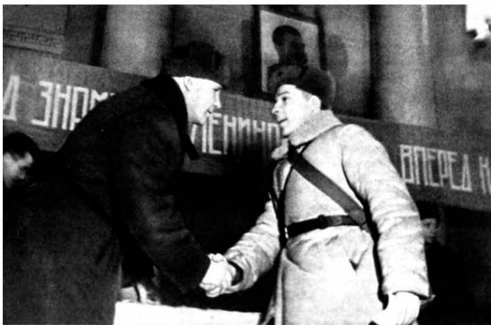
Командующий войсками Калининского фронта генерал-полковник И. С. Конев вручает правительственные награды воинам, отличившимся в боях за освобождение города Калинина. 31 декабря 1941 г

6 ноября противник силами двух пополненных дивизий вновь перешел в наступление на Селижарово. Оборону на том участке держала сильно растянутая по фронту стрелковая дивизия. Враг овладел городом, пытался прорваться в сторону Кувшинова, но был остановлен контрударом войск армейского и фронтового резерва.