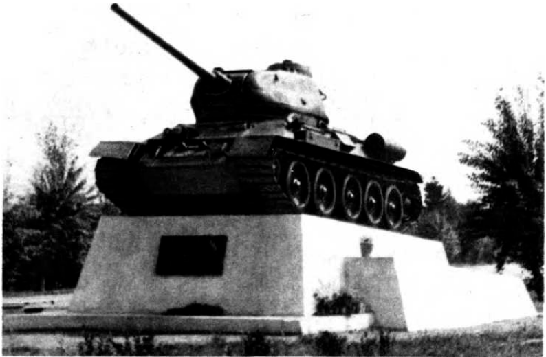
Танк Т-34 установлен на постаменте при въезде в Калинин со стороны Ленинграда. На этом рубеже советские войска остановили врага, рвавшего к колыбели революции – городу Ленина.

Начиная с 9 октября боевые действия на правом крыле Западного фронта (на калининском направлении) развертывались следующим образом; 10 октября значительные силы 3-й танковой группы противника были повернуты из района Сычевки в общем направлении на Калинин. 9-я немецкая армия частью сил продолжала вести бои в районе Вязьмы, но также наступала в общем направлении на Калинин. 10 октября из района Сычевки перешел в наступление на Зубцов – Старицу – Калинин 41-й немецкий моторизованный корпус, две танковые и одна моторизованная дивизия.