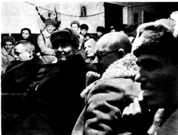
На концерте художественной самодеятельности в Доме офицеров 31 декабря 1941 г.

С 5 декабря 1941 года по 7 января 1942 года войска фронта продвинулись на запад на 100 – 120 километров, овладели Старицей, многими населенными пунктами и вышли в район Ржева.