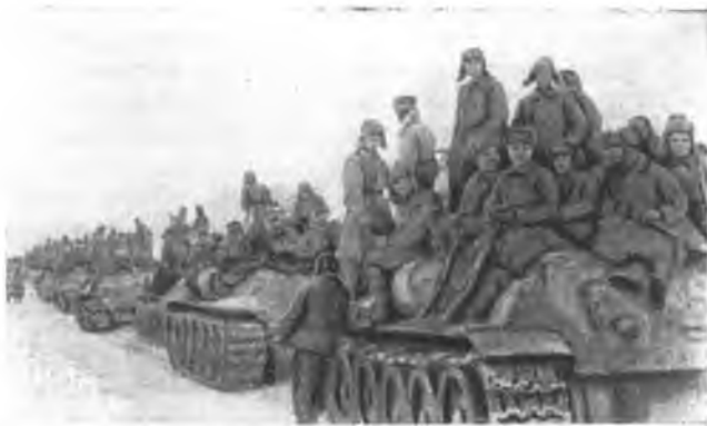
Январь 1944 г. 2-й Украинский фронт. Танковый десант на марше

Такое решение диктовалось обстановкой. Перегруппировка из 5-й гвардейской танковой армии 8-го механизированного корпуса в состав 5-й гвардейской армии и выдвигание его в обход Кировограда с северо-запада, несомненно, было очень правильным мероприятием. Именно это в последующем и обеспечило успех всей операции.