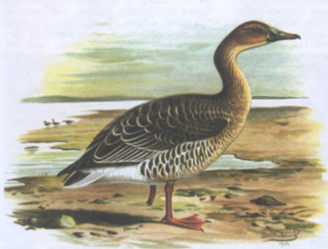
Большой гуменник. Худ. Фридрих Вильям Фрохот

Тем временем двое или трое из более опытных гусников выбирают на берегу возможно более сухое место и начинают здесь ставить сети. Их ста-