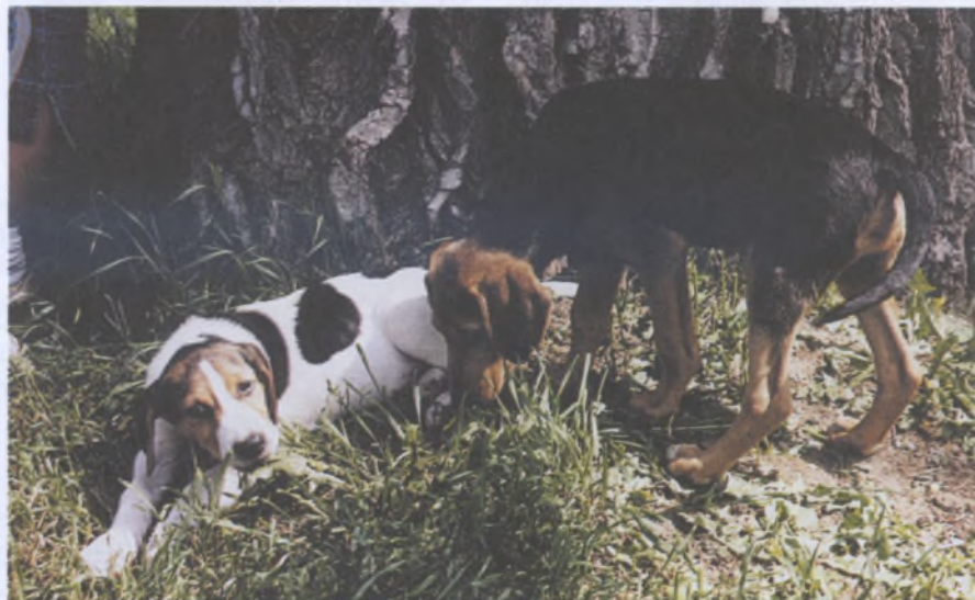
Первое знакомство гончих щенков с запахами леса

Мудрый совет оставил нам на память и безвременно ушедший из жизни Б. И. Марков. Читаю в его книге «Гончие и охота с ними» (М.: «Физкультура и спорт», 1991): «Я помню, когда я впервые наганивал пятимесячную русскую пегую гончую Скрипку. Собака была вязкой, но после тридцати — сорока минут гона ложилась, потом, отдышавшись, принималась вновь. Собаку я испортил... Я помню, как старый московский гончатник-эк-