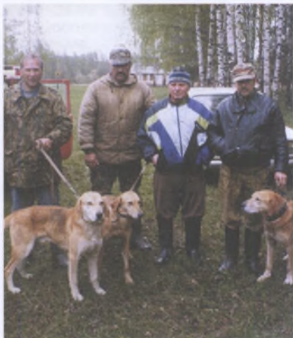
Перед весенними испытаниями

направлении следа не только в присутствии хозяина, но и без него. Когда молодая гончая усвоит приемы работы по свежей жировке, выходы на нагонку следует постепенно отодвигать на более позднее время с тем, чтобы гончая могла разобрать и несвежий след.