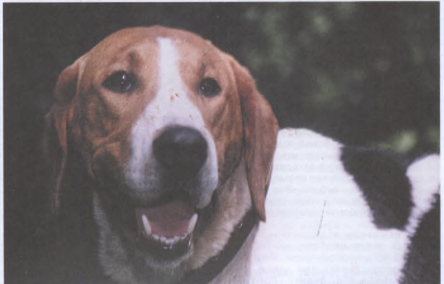
Русская пегая гончая