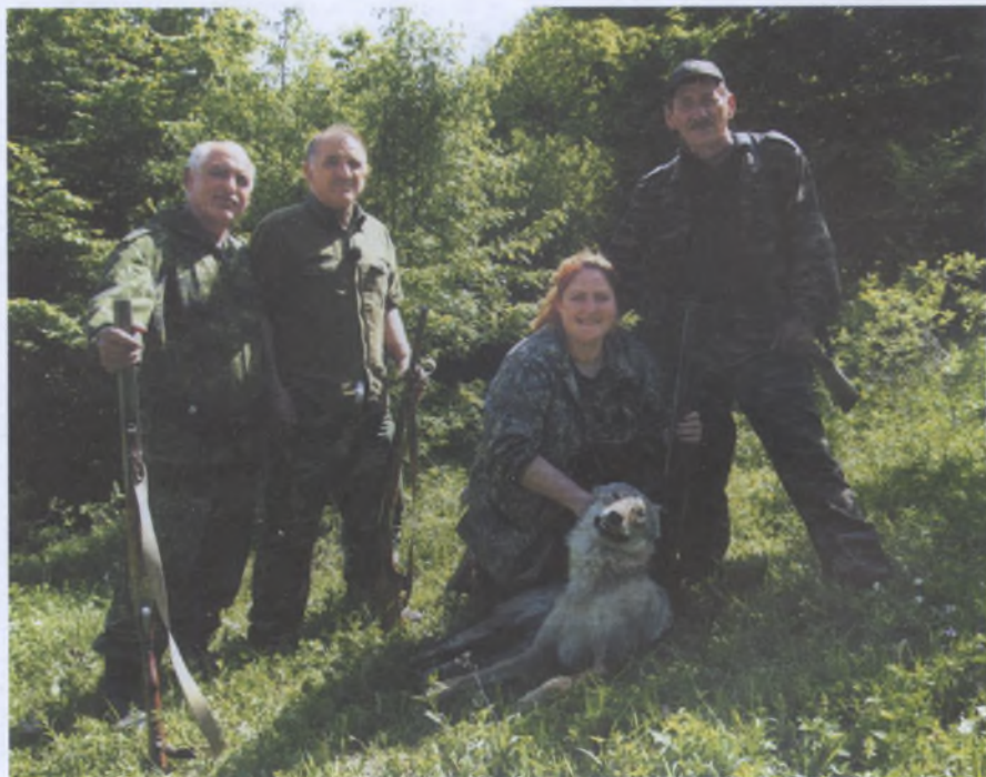
После удачной охоты

На Каспии зимовочные станции сохраняются, но они активно используются только в благоприятные зимы, т. е. когда прибрежный Каспий не замерзает, то же относится и к внутренним водоёмам. Недавно мы начали очень важную, на наш взгляд, работу по сохранению и восстановлению мелких водоёмов в равнинной части республики. Вы знаете, что у нас очень развито скотоводство, но сухой климат поддерживает постоянный дефицит кормов. Наши чабаны выкашивают прибрежный тростниковый бордюры в период его сочного состояния. Если эту процедуру повторять два—три года подряд, то небольшой водоём высыхает и появляется солончак. Мы постоянно проводим разьяснительную работу со скотоводами и добились того, что многие водоёмы удалось сохранить. Мало того, на них появилась уже местная дичь, свои выводки. Мы боремся, чтобы Дагестан не превратился в пустыню, а при отсутствии воды такая угроза становится реальной.