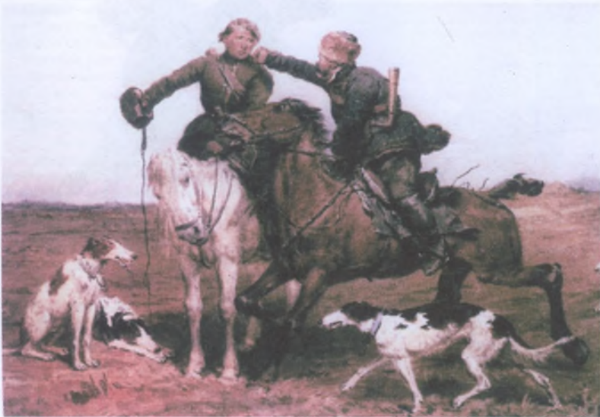
П.П. Соколов. Расправа. 1869 г.

И вот теперь внук неудачливого игрока пытался встать на аналогичную стезю. Однако его интересовали не только карты, но и другие игры: бильярд и скачки, охота и прекрасный пол. Успех у представительниц лучшей половины человечества, естественно, требовал средств. Слава Богу, Соколов прилично зарабатывал рисунками, но