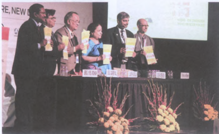
Торжественный момент в работе конференции

Заметно расширился фронт управляющих воздействий, направленных на сохранение медведей, в основном за счёт мер в сфере образования, социальной работы, взаимодействия с администрацией, совершенствования природоохранного законодательства, международного сотрудничества. При этом в работу по охране медведей включаются не только зоологи и охотоведы, но также работники особо охраняемых природных территорий, юристы, социологи, администраторы разных уровней, студенты и добровольцы.