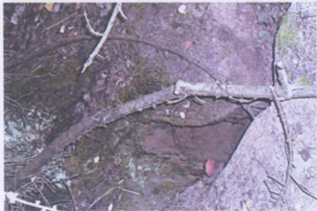
Вход в нору лисицы

В зимнее время лисица перемещается в лесопарковую зону г. Москвы, где охота запрещена и фактор беспокойства заметно снижен. Так, на участке между п. Веревское и п. Черная Грязь Солнечногорского района граница охотхозяйства с лесопарковой зоной частично проходит по р. Клязьма: на 5 км маршрута по границе из 20 следов лисицы 15 приходится на уход и лишь 5 на заход. Особенно часто это наблюдается в местах, где лесные массивы приграничных районов соприкасаются. Повышение активности наступает с началом гона и продолжается до распада выводков. Данные тропления показывают, что суточный ход лисицы составляет в среднем 8—12 км. На один суточный ход приходится до 4 временных лежек и около 50 мест, где лисица отдыхает (присады).