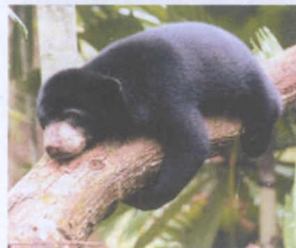
Медведи-губачи в питомнике в окрестностях Агры

Особая задача — превращение медведя в «танцующего». Для этого нужна круговая стальная платформа, на которую помещают, крепко привязав за кольцо в носу, медведя. Под платформой разводится костёр, который всё сильнее разогревает металл. Медведь вынужден постоянно переступать с ноги на ногу. Эту процедуру сопровож-