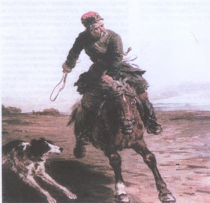
П.П. Соколов. Борзятник. 1869 г.

Большие средства Соколов по-прежнему тратил на поездки для участия в заграничных выставках: в 1889 году в Париже, в 1891 году в Берлине, в 1883 году в Чикаго и Лондоне. Самый большой успех выпал на долю художника во Франции в 1889 году, где он вместе с другими работами выставил в галерее Бернгейма свою знаменитую акварель-гуашь на тургеневскую тему — «Конная ярмарка в Лебедяни» (1886).