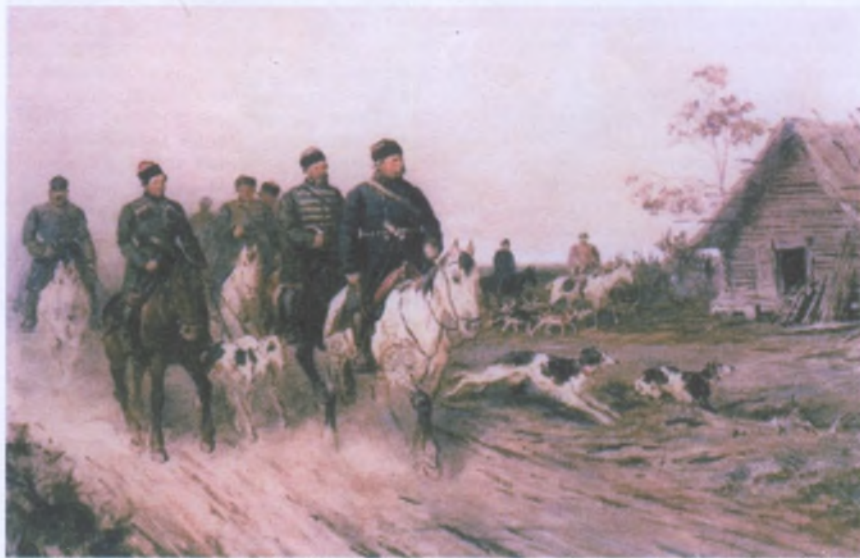
П.П. Соколов. Выезд охоты. 1870-е гг.

Самостоятельным дебютом Соколова на поприще искусств считается 1845 год, когда на выставке Московского училища живописи и ваяния появились его первые «Тройки» — зимняя и летняя. Эти работы принесли автору настоящую известность. Но портретный жанр он не оставил. Напротив, по заказу пишет «Портрет старухи в красном» (1852), выполненный с обилием деталей обстановки. Любопытно, что