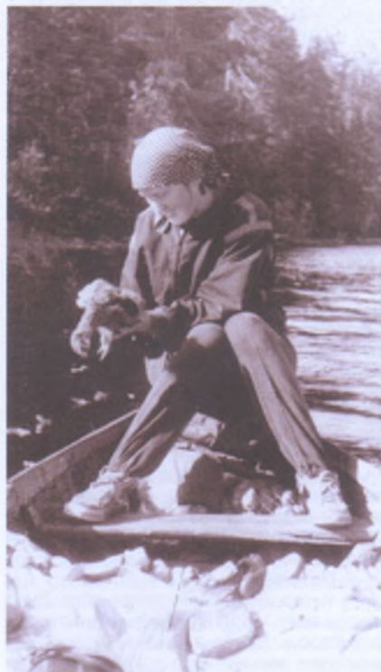
Карелия. Уницкая губа. Охота на островах. А во время плавания — обработка добычи. 1967 г.

И вот мы «дома». День погожий, светлый и длинный, у нас есть время для привычных и приятных хлопот по благоустройству нашего временного жилья: заготовка лапника, установка палатки, оборудование кострища... Пришли лесные запахи и звуки. Точка на географической карте ожила небольшой полянкой, спускающейся к лощине с ручейком, поросшей осинками, опушившимися червячками серёжек, сухим ломким дудником, ельничком, выдыхавшим холодок затаившегося в нём сугроба. Полянка наша на пригреве обнажилась, но в лесу еще много снега. Лежал он и на дорожке, которая приглянулась мне, когда мы пересекли её на пути к биваку. Я люблю такие дорожки. В них всегда есть загадка: куда ведёт она — к зазимовавшей поленице дров, к остожьям вывезенного по зимнику сена, с разобранной загородой от лосей, к кордону лесника? Любят дорожки и лесные обитатели. Весной протянет вдоль неё вальдшнеп, пролетит глухарь, ощутив после лесной крепи простор своим крыльям, оставит строчку следов лиса, и волк, и сохатый. Моя дорожка привела меня к лужу на опушке, за которым чернела зябь. Открылась даль. Ещё из леса заметил я на лугу птиц. В половинку развинченного бинокля (чтобы меньше занимал места), которую я всегда беру