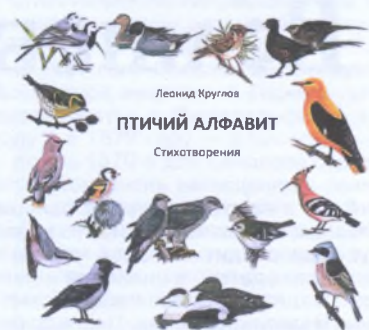
Круглов Леонид. Птичий алфавит. — Изд-во Московского университета. 2013. 63 с.