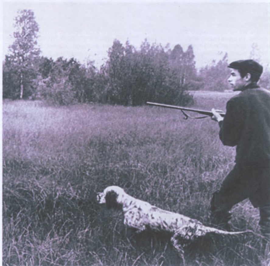
Классическая работа английского сеттера и его хозяина