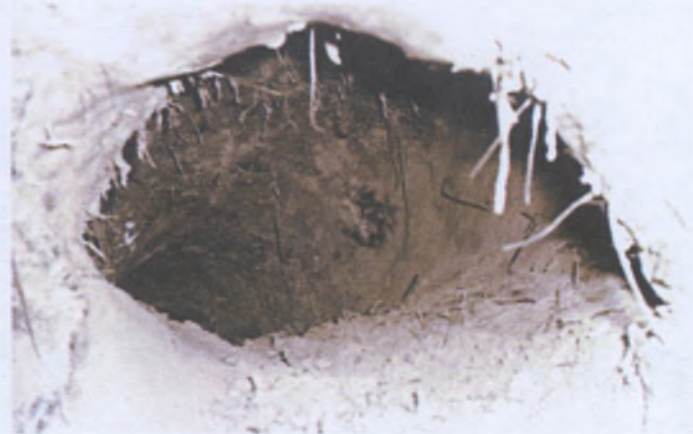
Вход в гнездовую камеру