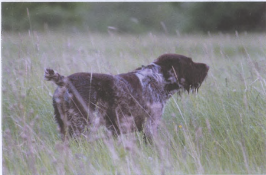
Типичная стойка дратхаара

Чутье. Р.Г. «Чутье ценится острое, дальнее, верхнее, без утыкания носа в землю, а тем болеековырания в набродях». Тут бы хотелось добавить.