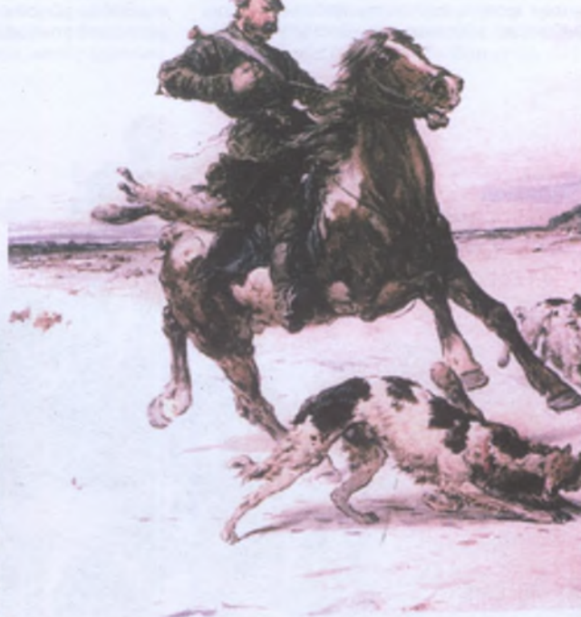
П.П. Соколов. Травля волка. 1872 г.