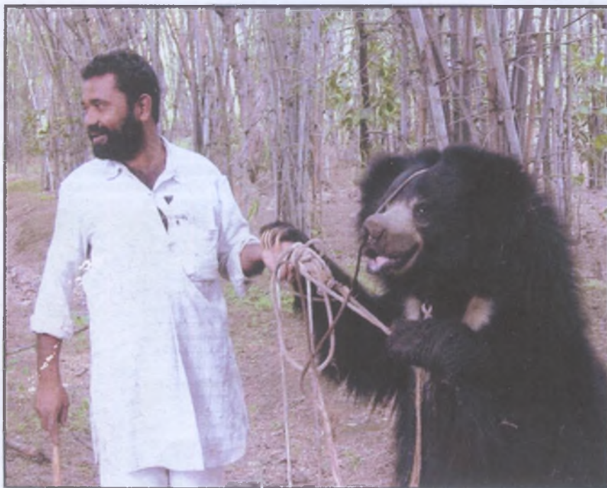
Каландар с дрессированным губачом

И несколько заключительных слов. В детских книгах и журналах, на фотографиях, стилизованных плакатах, в мультфильмах и любых других фильмах, в иных произведениях образовательного, природоохранного и общего гуманитарного назначения формируется обобщённый образ медведей разных видов: этакий добродушный, пушистый, косопалый симпатяга, который дружит с другими столь же симпатичными зверюшками и, конечно, с детьми, защищает маленьких и борется за справедливость. Винни Пух, если в двух словах! Назначение этого образа — воспитание любви к живой природе, единение со всеми «братьями меньшими», охрана медведей и других крупных хищников. Но не следует путать «экранный» образ медведя и реального зверя в природе. Даже самые мелкие из медведей — солнечные (масса взрослого зверя 30—60 кг) очень сильны, хорошо вооружены (когти, зубы) и не позволяют обращаться с ними как с любимой игрушкой. Держите дистанцию, господа, и учите этому детей!