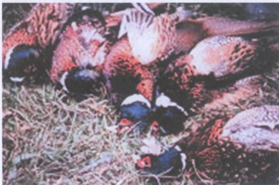
Охотничьи фазаны — добыча

До сих пор жалею, что не взял пару этих Жар-птиц. Дома сделал бы чуело и любовался их необыкновенно элегантным видом — красные брови, словно вороненое, блестящее, черное, с синеватым отливом, оперение. Ну до чего же они красивы!