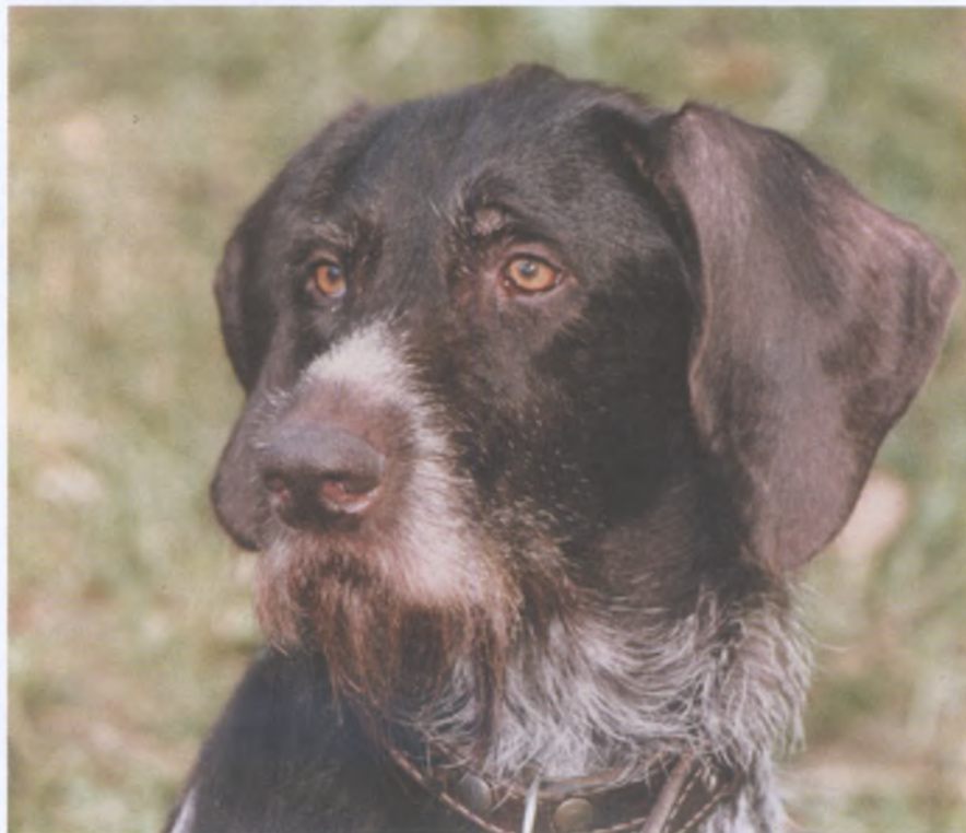
Портрет немецкой жесткошерстной легавой — драхтаара

Р.Ф. Гернгросс (далее Р.Г.) однозначно указывает на то, что максимальный