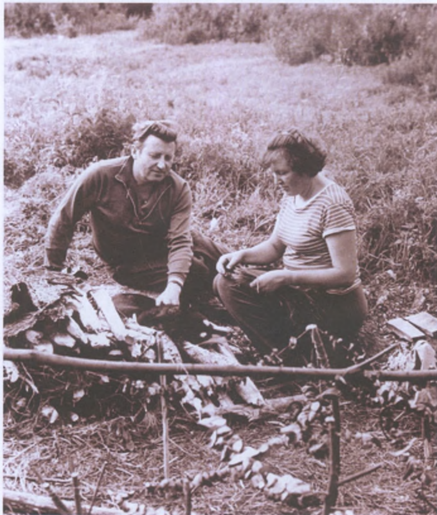
Воронежская область. Знаменитый Хреновской бор. Грибной год. 1979 г.

Это был Вечер Больших Токов. Как, всё-таки, зависит настроение и поведение птиц от погоды! Птицы токовали не только в небе, но и на земле. В нескольких метрах от нас как-то незаметно, сам собою, возник ещё один ток. Птицы, размером с бекаса, похожие на него, собрались на лугу, бежали друг за другом, распушась, принимали различные позы, задирали вверх длинные клювы и возбуждённо щебетали.