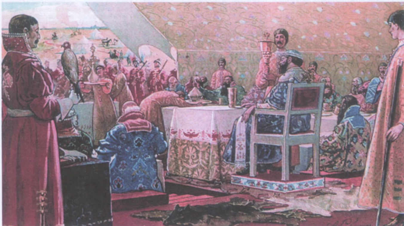
Пир царя Алексея Михайловича с ближними боярами в отъезде поле

Водоплавающая дичь также была в большом почете, ибо «серых уток пострелять» выезжали не только сказочные богатыри, но и вполне исторические персоны: императрицы Елизавета Петровна (предпочитавшая, однако, псовую охоту), Екатерина Вторая (охотившаяся с подхода на лодке, а позднее с ловчими птицами) и многие другие. Готовить же диких гусей и уток предполагалось также как и домашних: гуся — жарить на вертеле, готовить в ябло-