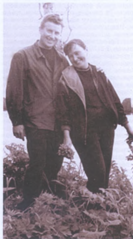
Камчатка. Берег Тихого океана. 1963 г.

— Постояла бы такая погода на майские, — сказал он мечтательно и отрезанно, не обращая внимания на фаль-