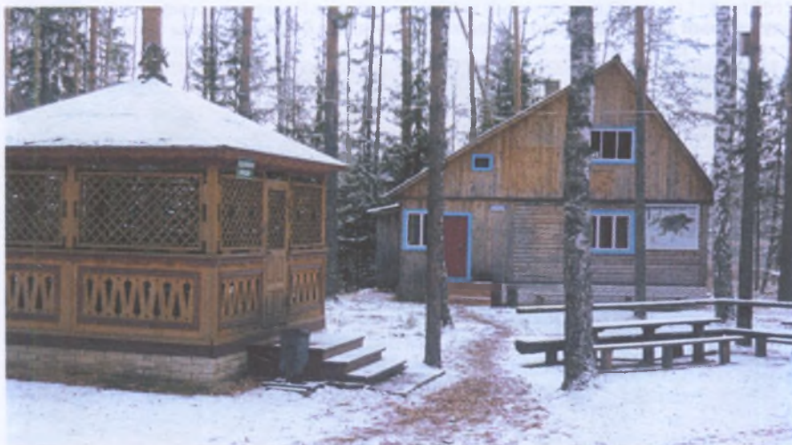
Охотничье-спортивная база п. Арья