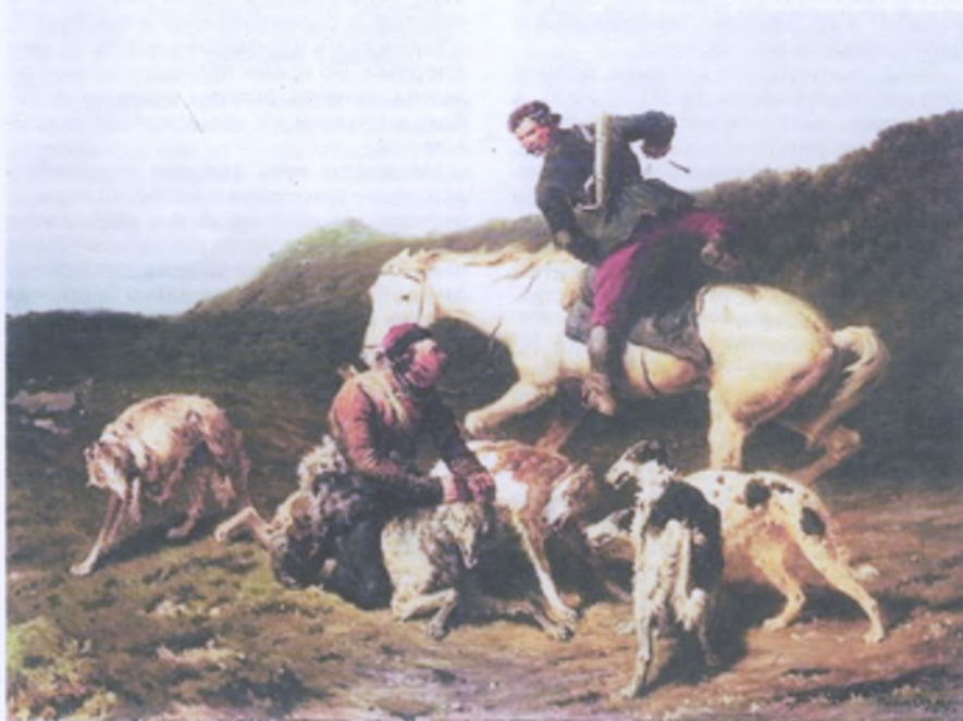
П.П. Соколов. Охота на волка. 1873 г.

На следующий год в Петербурге устроили посмертную выставку произведений П.П. Соколова. До октября 1917 года его картины экспонировались еще на шести российских и одной парижской выставках, затем — на трех экспозициях в советское время (1948, 1949 и 1951 годы). Почти 400 работ мастера, из которых более ста посвящено охоте, украшают стены (или запасники) Русского музея, Третьяковки, Музея коневодства, картинные галереи Киева, Омска, Риги и других городов России и зарубежья.