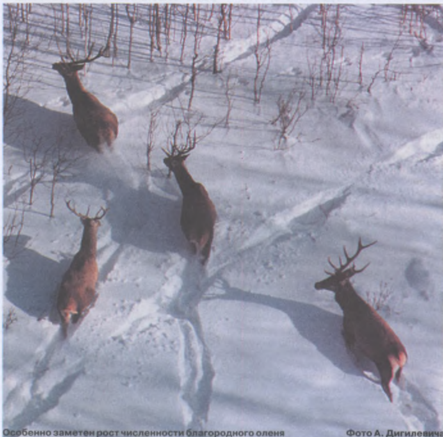
Особенно заметен рост численности благородного оленя

Биотехнии мы уделяем особое внимание. Дело в том, что те охотничьи уголья, которые мы получили, ранее были угольями общего пользования. Думаю, Вам не надо говорить, в каком состоянии они находились. Бесконтрольная охота, браконьерство свели к минимуму численность охотничьих животных на этих территориях. И перед обществом охотников стоит достаточно сложная задача — создать такие условия для жизни животных в наших угодьях, чтобы их численность росла не только естественным путем, но и чтобы хорошая охрана, подкормка, отсутствие хищников, влияющих на сокращение популя-