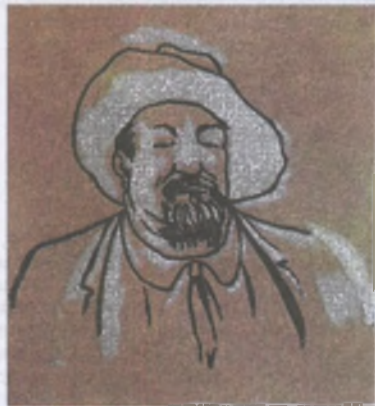
А.И. Куприн. Худ. Н.И. Тербенев

Н ас только двое: я и бурдастый белый пойнтер Джон, кобель чистой английской породы. Он обладает чудеснейшим верхним чутьем, на охоте строг и неутомим; но воды, ни болота не боится. Но есть у него один порок, который