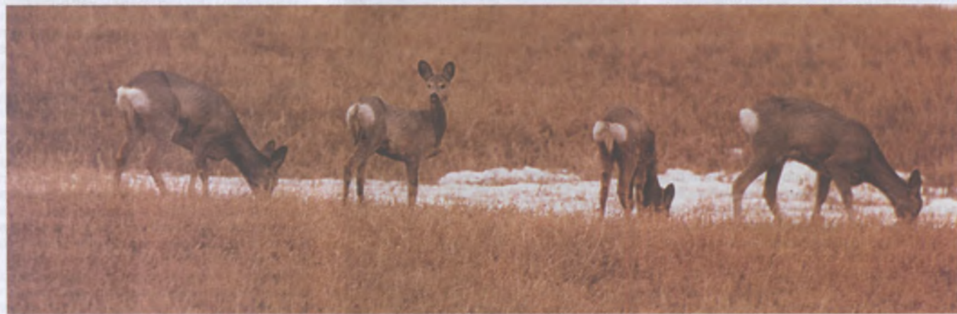
Косуля обладает очень сильным рывком на старте, что позволяет ей быстро оторваться от преследователя

Судя по сообщениям охоткорреспондентов, летом в местах отелов копытных росомаха может отыскивать и добывать молодых козлят и ослабленных самок сибирской косули. Учитывая, что росомаха — один из наиболее редких таежных хищников, вред от нее косуле мало ощутим.