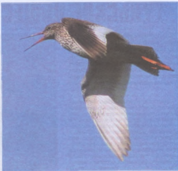
Анатолий СЕВАСТЬЯНОВ.