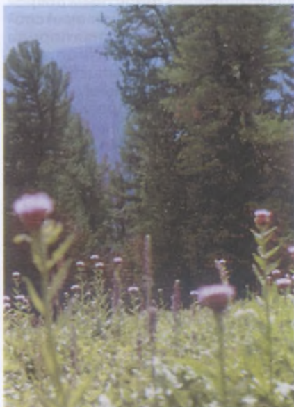
Левзея сафлоровидная — маралий корень

Два слова о лекарственных растениях. Образно говоря, каждое растение в природе лекарственное и обладает теми или иными целебными свойствами, в большей или меньшей степени. Некоторые ценятся столь же высоко как, например, женьшень, который в природе очень редок. В Горном Алтае (и не только там) это золотой корень (или родиола розовая) и маралий корень (левзея сафлоровидная).