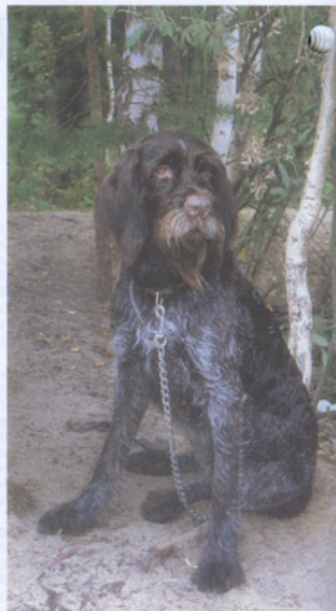
Типичная немецкая жесткошерстная легавая (дратхаар)

Охотникам, у которых нет желания вкладывать силы и средства в подготовку собак по зверю, лучше остановиться на собаках одноплановых, например, на сеттерах, пойнтерах (островных легавых). Эти собаки великолепно работают в поле, и не требуют больших вложений как такая универсальная собака, как дратхаар.