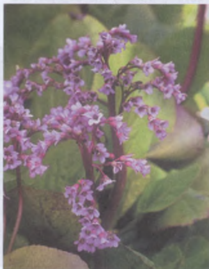
Бадан толстолистный из семейства камнеломковых

Бадан (чагир, монгольский, чагирский чай) в горных районах юга Сибири употребляется издревле. Это растение семейства камнеломковых растет в горах всюду. Его можно встретить даже на неприступных скалах узких ущелий, а как декоративное бадан разводят цветоводы в своих цветниках. Большие круглые его листья зимуют под снегом, а через два года усыхают, но остаются на черешках. Вот их-то и собирают для чая, который называют монгольским. Видимо, русские первопоселенцы Сибири научились пить такой чай у монголов. Он ароматен, темно-коричневого цвета и очень полезен — укрепляет стенки кровеносных сосудов, регулирует артериальное давление и вообще тонизирует. Листья бадана можно собирать и зелеными, но затем их надо обязательно ферментировать, как листья