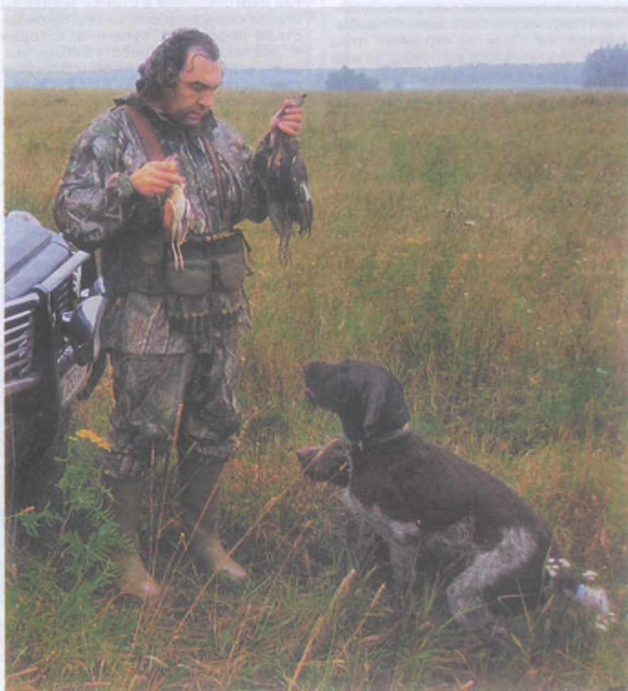
С дратхаарами по «мелочи»

Охотник, который приобретает щенка, должен быть готов к вкладыванию каких-то определенных средств в свою собаку, в породу. Если таких средств нет, то он должен приобрести ту собаку, которая ему больше подходит для охоты и по средствам.