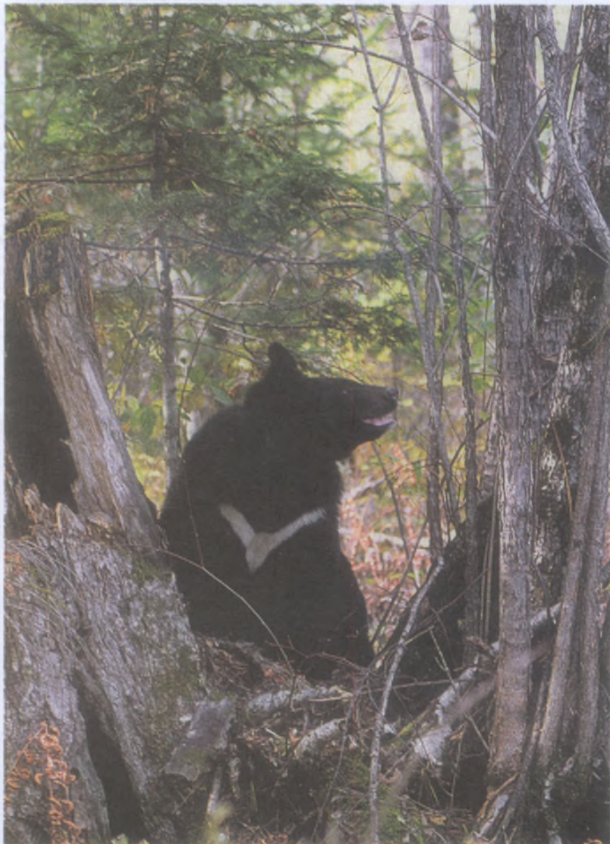
Плохо обстоят дела с ресурсами белогрудого медведя из-за высокого спроса на дериваты этого вида в странах Юго-Восточной Азии

пертизе обсуждалось множество частных вопросов, да и общих проблем, например, как могут повлиять на состояние ресурсов животных увеличение или уменьшение квот, введение запретов охоты, как это может сказаться на уровне браконьерства, на заинтересованности охотников и т.п. Не останавливаясь на этих, подчас философско-психологических и полемичных проблемах, подчеркнем, что всякая экологическая экспертиза лимитов добычи охотничьих животных — это нахождение компромиссов между двумя главными тенденциями. С одной стороны, есть стремление добыть как можно больше животных, улучшить экономическое положение охотпользователей или хотя бы дать им просуществовать, укрепить и расширить влияние государственных органов в региональных структурах власти. Бе-