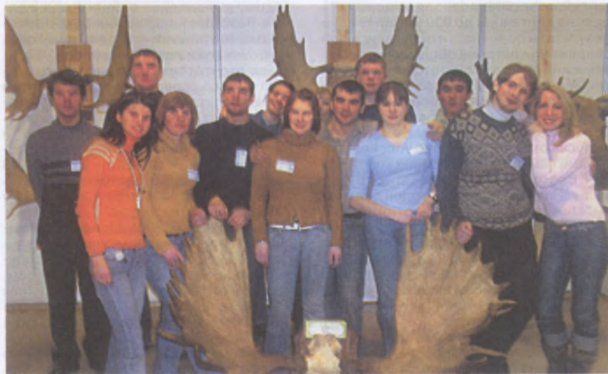
Студенты-охотоведы зооинженерного факультета Российского государственного аграрного университета им. К.А. Тимирязева