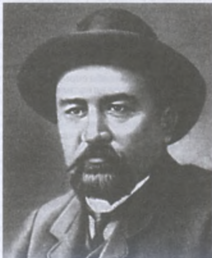
«А. Куприн, даже в те годы, когда мало уступал в российской славе Горькому, Андрееву, нес её так, как будто ничего нового не случилось в его жизни». И. Бунин