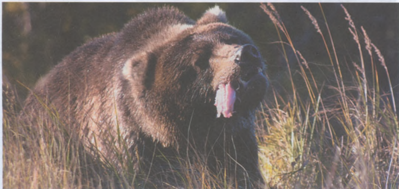
На северо-востоке страны, где преобладает весенняя трофейная охота на медведя, есть опасность нарушить половую структуру популяции

Ситуация с ресурсами различных видов лицензионных охотничьих животных в России разная. Наименьшие проблемы возникают с пушными видами. Спрос на пушнину в стране упал, цены на сырьё низкие, что снизило заинтересованность охотников в добыче пушнины. Однако это не в полной мере относится к ценным лицензионным видам.