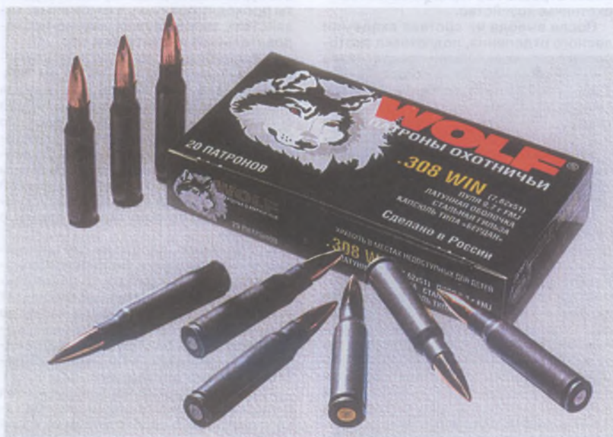
Патроны .308 Winchester производства Тульского патронного завода

В сравнении со своим предшественником (.30-06 Springfield), .308 Winchester при незначительном сниже-