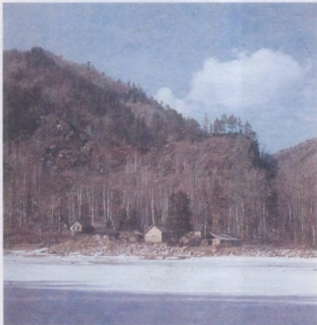
Избушка охотника стояла в излучине Иркутта

Месяц таежной жизни в охотничьей избушке никогда не изгладится из моей памяти. Это было самое яркое, самое волнующее соприкосновение с жизнью дикой природы, с охотничьим бытом, с интересным, колоритным человеком. Думаю, что эти впечатления и переживания не могли не оказать влияния на выбор жизненного пути. Я очень рада, что вот уже 15 лет моя судьба связана с журналом «Охота и охотничье хозяйство».