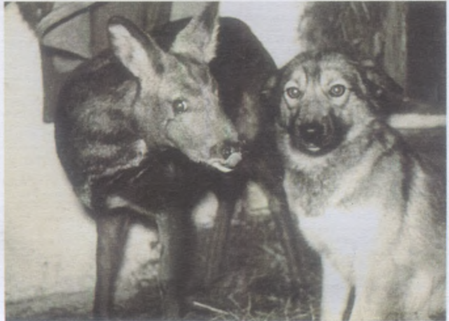
Розка сразу взяла кабаргу под свою опеку