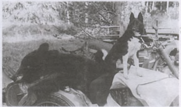
Моя спасительница Пурга

Уже заметной рассвело. Перейдя поляну, подошел к противоположной кромке леса. Решил осмотреть березу, у которой вчера останавливался медведь и, как мне показалось, обхватывал дерево лапами. Большая щепка, сан-