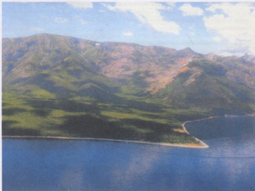
Мыс Елохин — северная граница заповедника

Южная часть Байкальского хребта (район верховий Лены), полностью входящая в состав Байкало-Ленского заповедника, вместе с байкальским побережьем являются естественной границей современного распространения многих представителей флоры и фауны. Здесь обитают многие виды, нуждающиеся в особой охране, и проходит северная граница дауро-монгольских степей, отдельные достаточно большие участки (до 5 км 2 ) которых встречаются по всему югу заповедника.