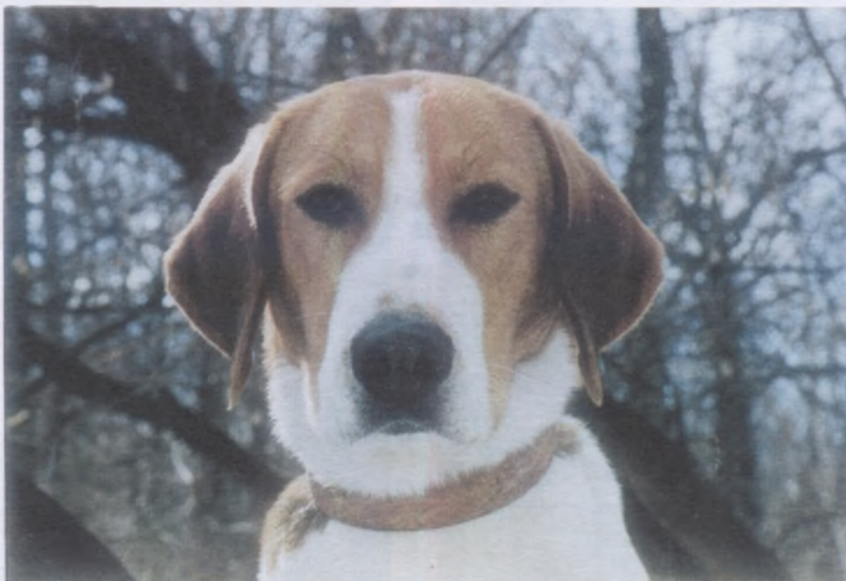
Русская пегая гончая

внешне значительно отличалась от « лайки » и с ней не смешивалась.