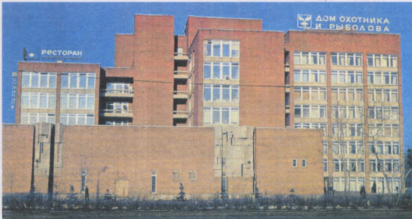
Дом охотника и рыболова Центрального правления Росохотрыболовсоюза

8. Восстановить права штатных работников всех охотпользователей составлять протоколы об административных правонарушениях в сфере охоты. Надо иметь в виду, что назначение меры наказания остается у государства. Протокол лишь фиксирует правонарушение. Одна эта мера позволит многократно сократить правонарушения в данной сфере.