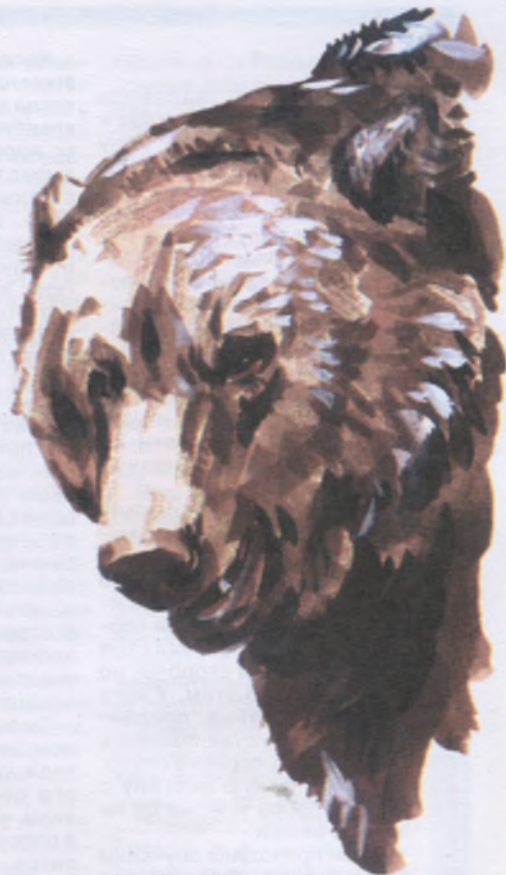
Рисунок В. Симонова

Медведь прыжками обегает меня и заходит сзади. Флажок с нарезного ствола уже перекинут на гладкие, два