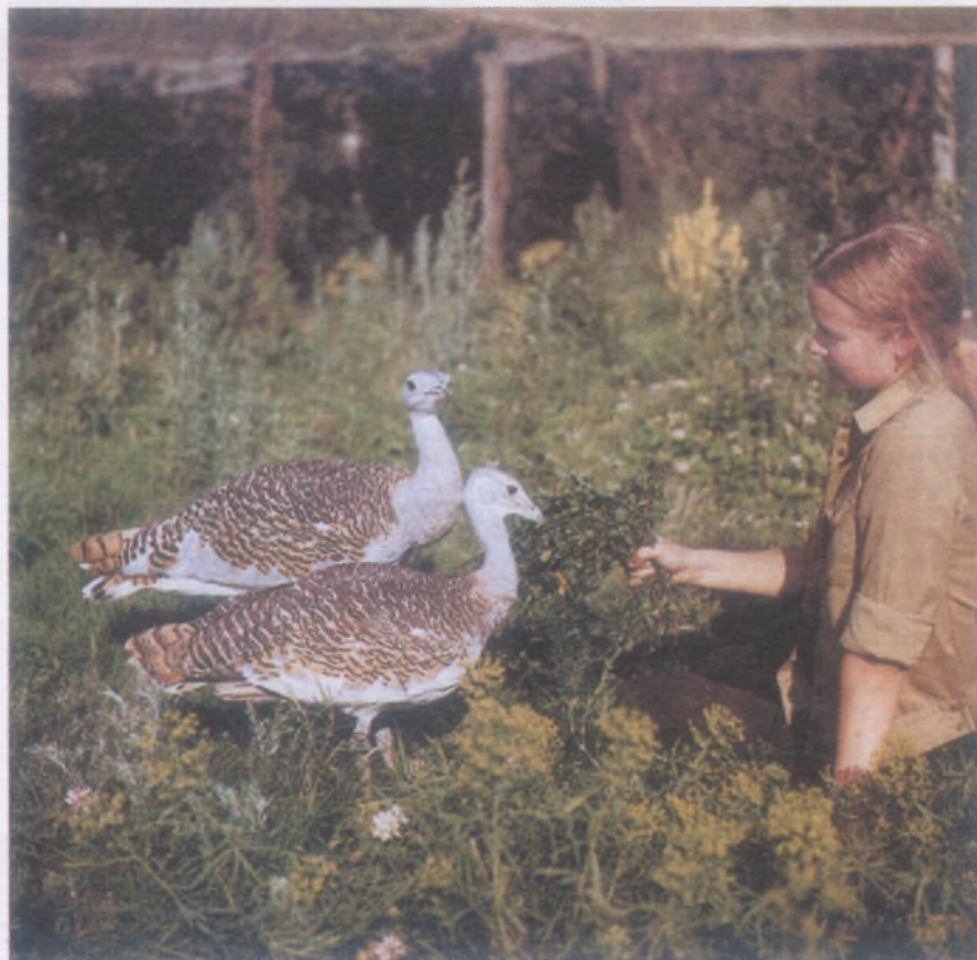
Дрофы в зоопитомнике «Зеленый» в Саратовской области. В понятие рационального природопользования входит и их воспроизводство с дальнейшим выпуском в естественные местообитания

Развивая изложенные в начале статьи общие принципы биологического природопользования и отыскивая «противовес» ложным экогуманитарным подходам киевской школы экологической этики, мы попытались создать систему реальных (а не идеалистических) этических ограничений в данной области. С них можно начинать некоторую реконструкцию принципов и методов управления биологическими природными ресурсами. В эту систему входят как ограничения, которые могут быть реализованы без большого труда, так и те, которые требуют глубоких перемен в технологиях отдельных отраслей природопользования. Приводимый ниже перечень имеет