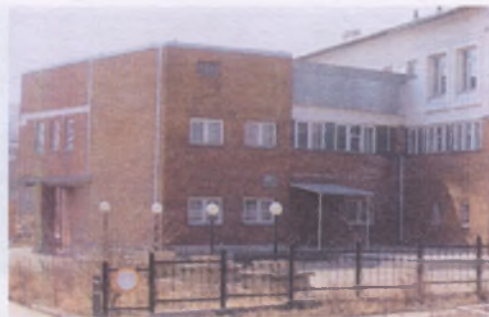
Административный корпус заповедника