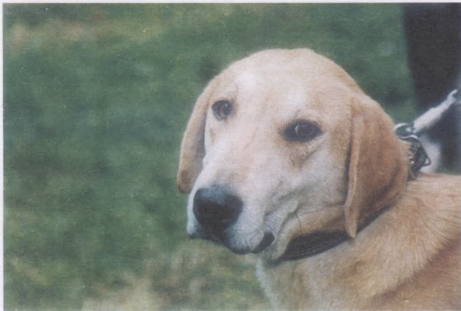
Русская гончая (Бушуй А. В. Горянова)

«гонная собака» в документальных русских источниках отмечается в 1558 году в Указе Ивана Грозного: «Марта в 9 день, боярин и князь Иван Одреевич Булгаков приказал диаком Юрию Баженину да Василью Мелентьеву, госуда-ревым словом, что в борзых и в гонных собаках суда не давати никому; а в дворовых в чепных собаках суд давати велел, и цену велел чинити дворному кобелю рубль и пошлыны с того велел имати» 6 . А в форме «гончая» — в стейном списке Микулина, составленном в 1601 году, в котором при описании участия Микулина в мае 1601 года