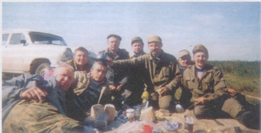
Друзья и ученики Г. М. Шарипова