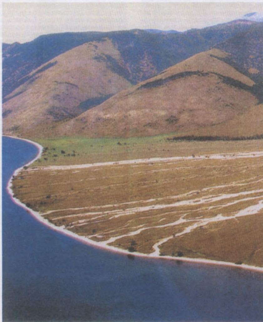
Заповедная степь — мыс Рытый

К настоящему времени заповедником выполнены три крупные темы. Прежде всего необходимо указать на принципиальное решение вопроса о