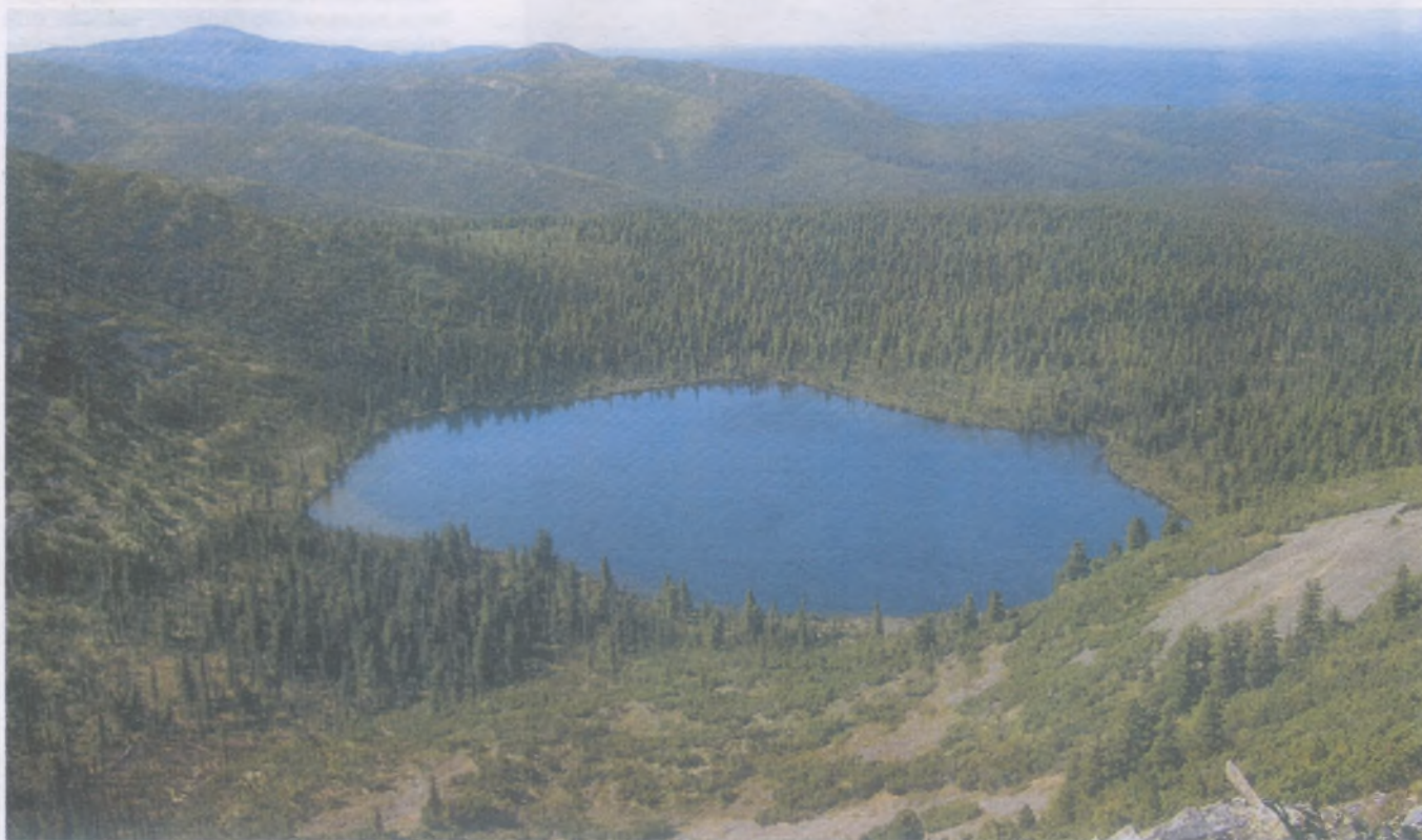
Высокогорное озеро «Око земли»

20-летний юбилей заповедника — это подведение итогов работы большого коллектива, который много сделал для сохранения этого уголка Байкала. Он по-прежнему остается неприкосновенным, хотя охранять его с каждым годом становится все сложнее. Когда наконец мы поймем, что наши заповедники, национальное достояние страны, заслуживают лучшей участи?