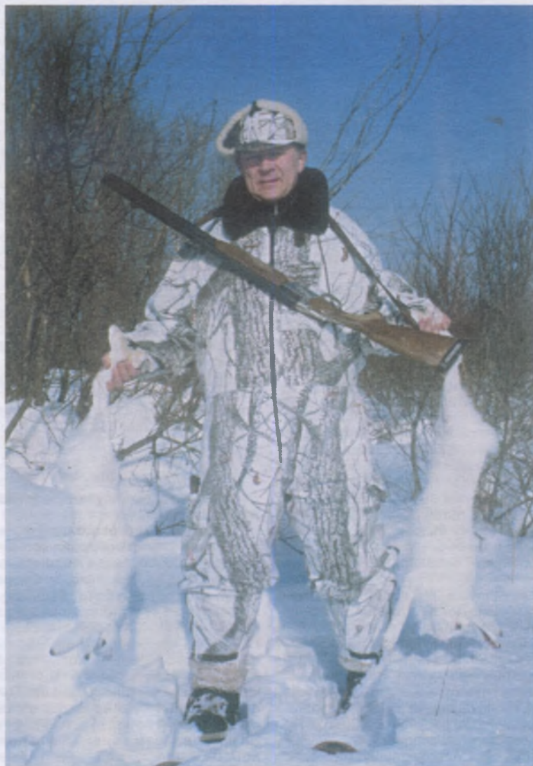
Замечательный результат одного охотничьего дня

рошую материальную базу, проводят биотехнические мероприятия, организовывают учеты и борются с волками. На что в незакрепленных угодьях нет ни средств, ни возможностей. Можно даже привести пример. Кабан в нашей области почти совершенно исчез, а сейчас, во многом благодаря именно активной работе персонала частных хозяйств, численность его превысила 4,5 тыс. голов. Но нам совершенно непонятна позиция Центра. При выделении квот на отстрел наша область получила всего 100 лицензий, из них 90 на сеголетков! Мы знаем нормы отстрела, определенные наукой, кабана, по-моему, можно отстреливать до 30 % от общего поголовья, а нам разрешают 2 %. Как это назвать? Что, из Москвы лучше видно, как нам вести охотничье хозяйство? В Финляндии 120 тыс. лосей, они отстреливают более 50 %, а мы получили 700 лицензий, имея, по учетным данным, 22 тыс. голов лося. И не с кого спросить за эксперименты, нет ответственных.