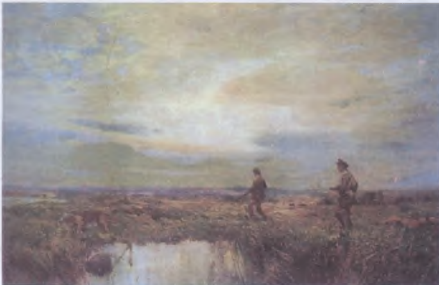
На уток. 1900-е гг.

гой с собакой наблюдает за ним чуть в стороне.