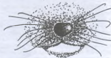
У норки американской белая только нижняя губа