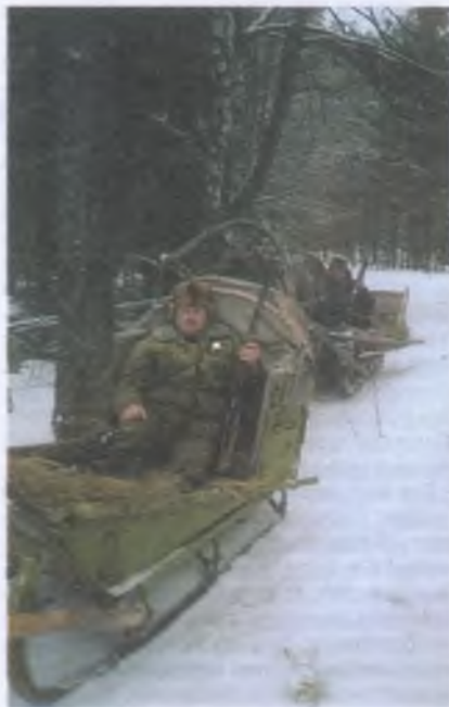
Деревенские друзья мои всегда ждут не дожидаясь зимы, санного пути...

Мне хочется ответить, что как бы только эту команду не отдали за нас в самое ближайшее время совсем другие племена... Но я молчу — уж больно убежденно земля мой говорит, пусть с такой верой и живет, не помешает. И я снова жалею, глядя на место, где стояла та хата, что не взял в свое время ложку. Если совестился брать чужое,