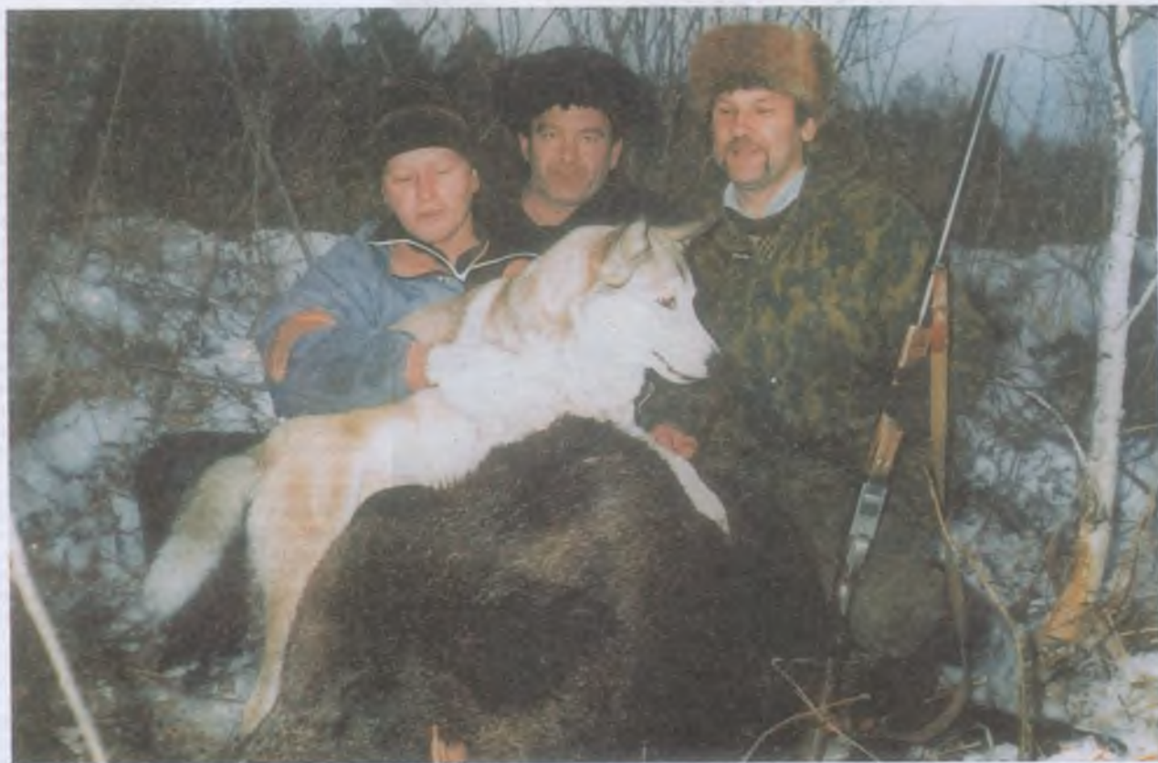
Фотоконкурс «Охота и природа, 2004»