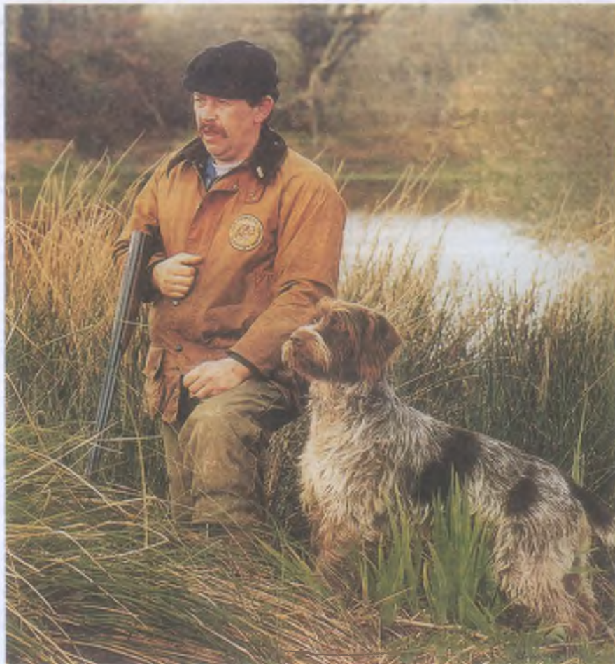
Французский охотник с дратхааром

В 1833 г. король Луи-Филипп отменил действовавший ранее порядок, по которому в государственных лесах простым гражданам охота была запрещена. В период Реставрации в 1844 г. были