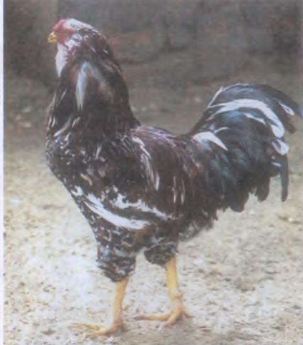
Петух породы Орловские куры