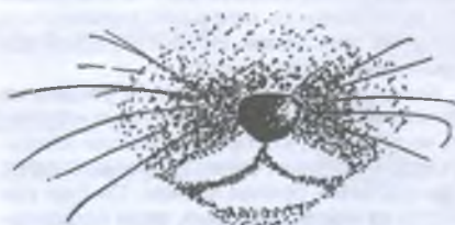
У норки европейской верхняя и нижняя губы белые

Норка американская. Следует отметить, что дикую норку, обитающую в естественных условиях североамериканского континента, в нашу страну никогда не завозили. История происхождения зверька, именуемого у нас американской норкой и обитающего во многих областях страны, такова. С 1928 г. звероводческие хозяйства нашей страны стали разводить завезенную из-за океана клеточную норку, которая в Америке была получена путем гибридизации трех подвидов норок,