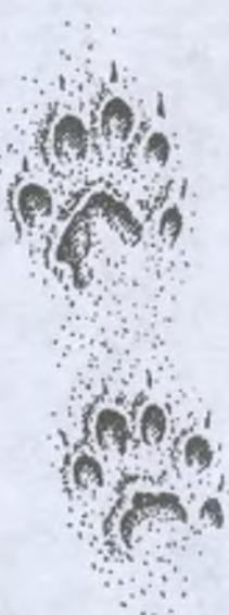
Отпечаток передней (сверху) и задней лап лесного хорька на мягком грунте