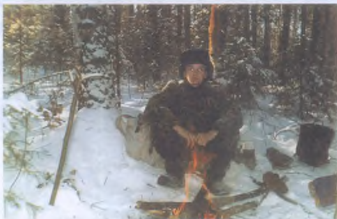
На промысле у реки Таборинки

Дорогая редакция! Мне 16 лет, охотой занимаюсь с 13-ти. У меня есть три собаки, все они очень хорошие помощники и верные друзья. Учусь я в 10 классе, охочусь с октября на ондатру, а с ноября на бобров, зайца, куницу, имею охотничий билет.