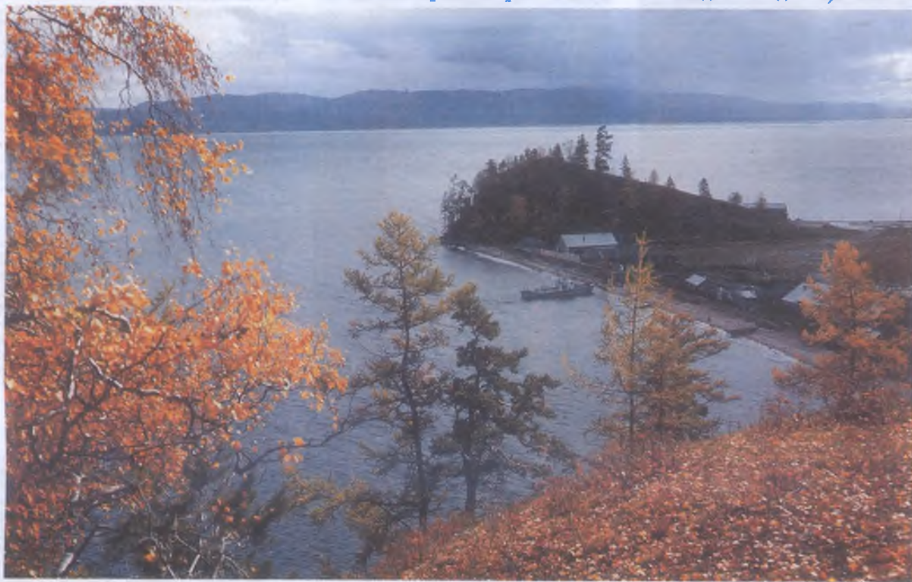
Байкал, Чивыркуйский залив, мыс Катунь. Забайкальский национальный парк

(К продолжению давнего спора о проблемах заповедного дела)