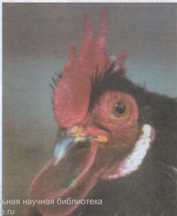
Карликовый кохинхин (Китай)