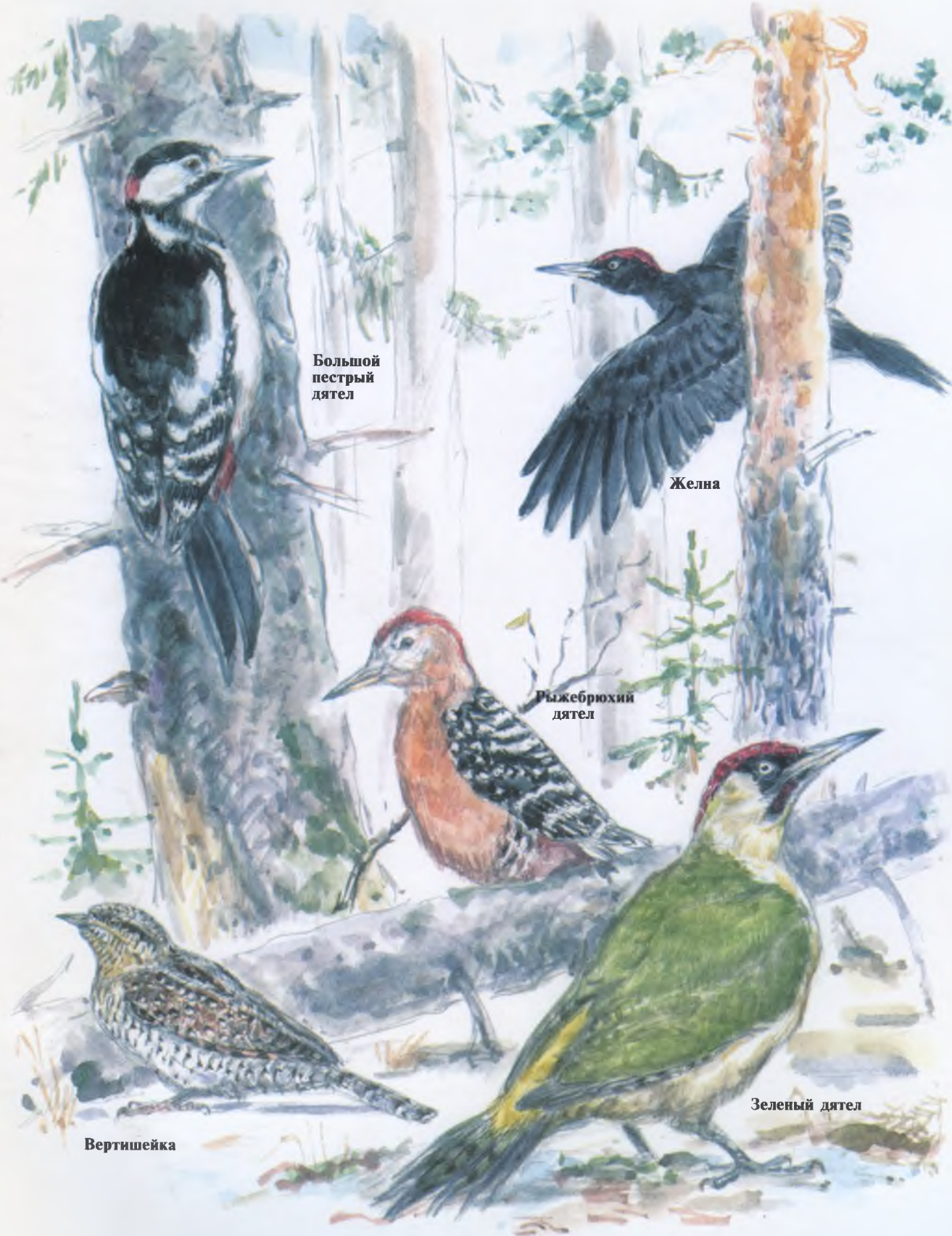
Большой пестрый дятел