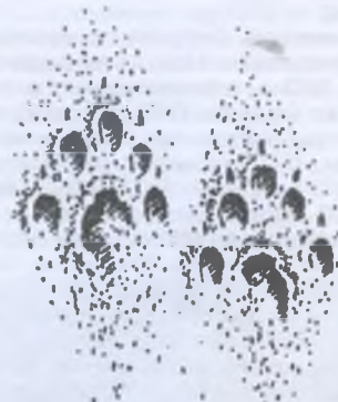
Отпечаток лап горностая на илистой почве

Ареал горностая охватывает всю страну. Встречается он в различных угодьях, предпочитая окраины болот, поймы рек и другие места с повышенной влажностью. Зверек ведет оседлый