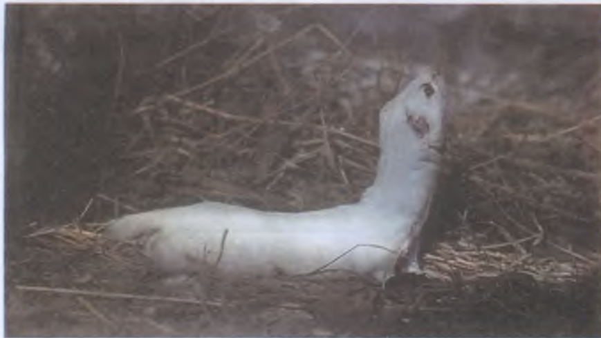
Ласка — самый маленький из хищников земного шара

Ласка. Это самый маленький из хищников земного шара. Встречается в разнообразных условиях, заселяет почти всю страну. Размеры, в зависимости от условий обитания, таковы: тело 13—30 см, хвост 2—8 см, вес от 40 до 200 г. Мех короткий, прилегающий, зимой чисто-белый, летом верх тела бурый, низ белый. Хвост и зимой и летом окрашен так же, как спина. Черного волоса на хвосте не бывает. Ласка — неутомимый истребитель грызунов — поедает мышей и полевок, но может справиться и с водяной крысой. Охотится на земле и под землей, проникает в норы грызунов, не раскапывая их. За сутки она съедает 20—30 г корма, но добывает больше, создавая запасы: в ее кладовых находили до 140 трупиков грызунов. Размножается ласка раз в году, беременность 35 дней, в выводке 4—7 детенышей, вес новорожденного около 1,5 г. В связи с незначительными размерами и большой пользой, которую ласка приносит сельскому хозяйству, охота на нее в России не производится.