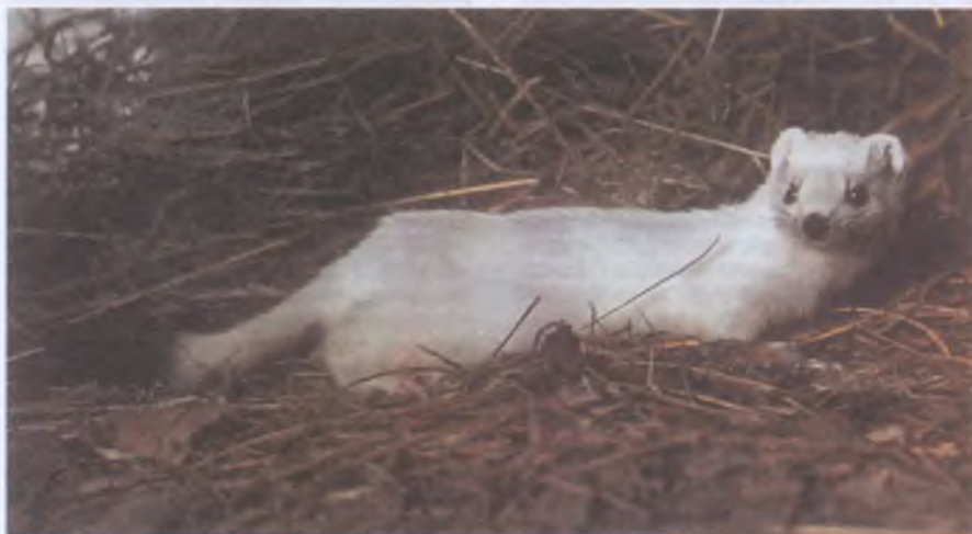
Горностай отличается от ласки тем, что конец его хвоста зимой черный