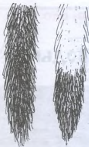
Раскраска хвоста лесного хорька (слева) и степного (справа)

По сравнению с лесным хорьком степной более плодовит. Число детенышей в помете может достигать 18. Воспитывают детенышей и самец, и самка. Молодняк быстро развивается: в двухнедельном возрасте еще не прозревшие детеныши высасывают кровь из принесенных родителями грызунов. В конце лета молодые ведут уже самостоятельную жизнь, а в 10 месяцев становятся половозрелыми.