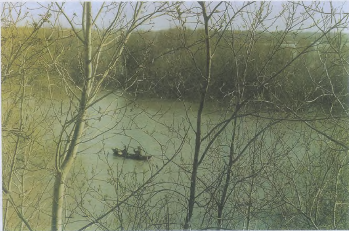
Фотоконкурс «Охота и природа, 2004»

Тяжело нагруженную лодку может залить даже небольшая волна. Перегрузка лодки недопустима