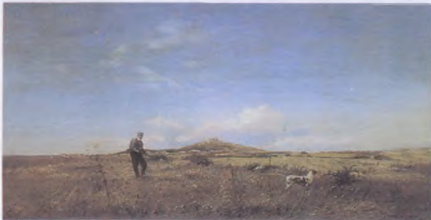
По перепелам. 1900-е гг.