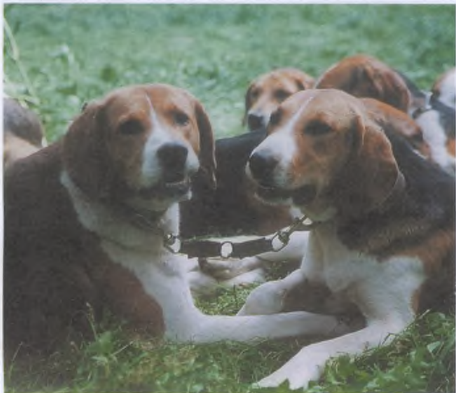
Как уберечь собаку от волков, от воров, от злых соседей? Риск потери гончих особенно высок