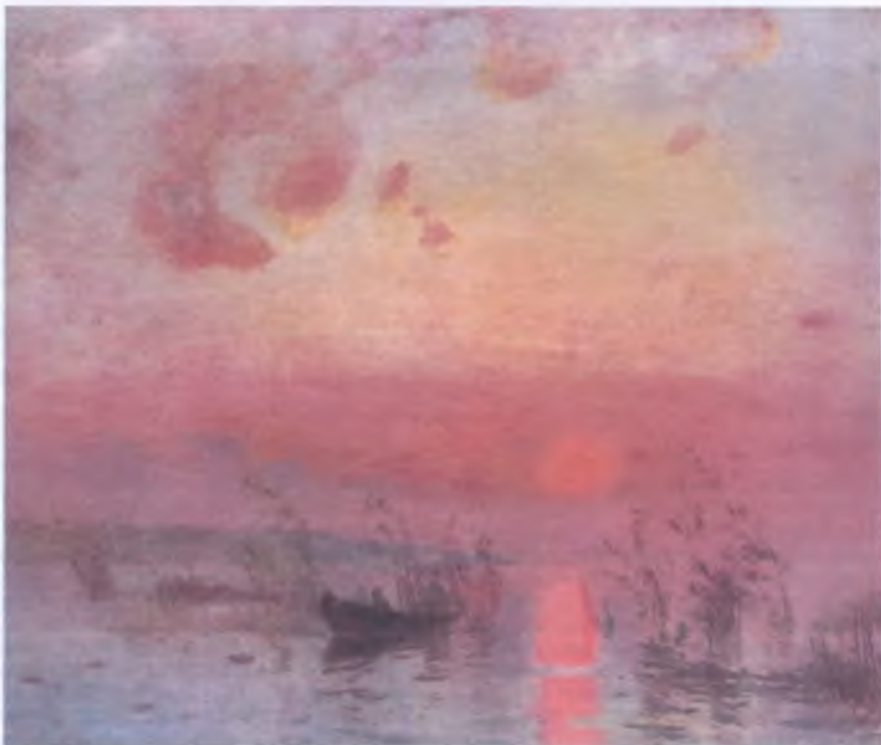
Утро на Донце. 1900-е гг.

Незнакомец оказался русским художником И. П. Похитоновым, гостеприимством которого они наслаждались в тот же день. Сергей близко сошелся с ним и познакомился с другими пенсионерами из России, за практикой которых за границей наблюдал маринист А. П. Боголюбов. Из множества представленных в Париже школ Васильковский больше всего увлекся барбизонцами, работавшими главным образом на пленэре. Он скопировал около сорока полотен Коро, Руссо, Добиньи, Тройона и других. Регулярно выбирался за город в Версаль, Фонтенбло, Сен-Клу, Барбизон. Общение с Похитоновым, знакомство с современным французским искусством не замедлили сказаться на почерке художника, обретшем большую раскованность, цветовое разнообразие («В Пи-