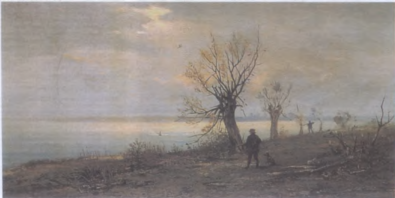
По уткам. 1900-е гг.

В октябре 1917 года ослабленный болезнями и лишениями организм перестает бороться. На харьковском городском кладбище появляется новая могила. В 2004 году исполнилось 150 лет со дня рождения самобытного украинского художника, творческое наследие которого, включая его охотничью живопись, заслуживает самой высокой оценки.