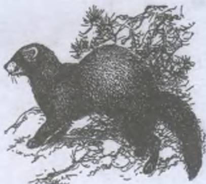
Черный, или лесной, хорек

Убежищами хорьку служат норы, которые он роет сам; поселяется хорек в норах сусликов, хомяков и тушканчиков, расширенных им до 10—12 см. Обитаемость норы выдает специфический для всех кунных запахи, а также свежая выброшенная земля, так как хорек подновляет нору почти каждый день. Охотится он преимущественно ночью, но во время выкармливания детенышей бывает активен и при дневном свете. Кроме мелких мышевидных грызунов, птиц и лягушек он уничтожает массу хомяков, сусликов и тушканчиков, выкапывая зверьков даже в период их спячки. Более крупные его жертвы — ондатра, куропатки, тетерева.