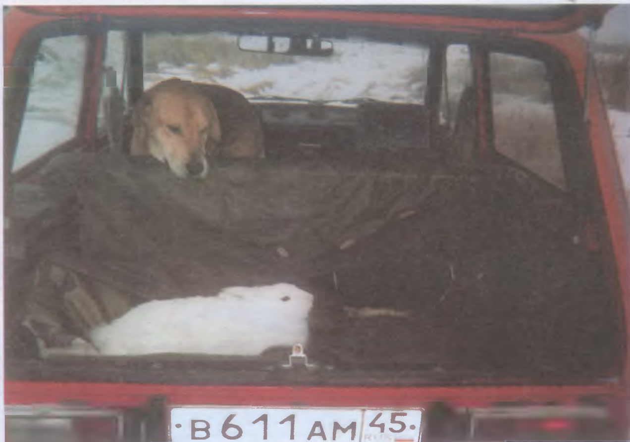
Фотоконкурс «Охота и природа, 2004»

В письме или на оборотной стороне каждого снимка укажите, пожалуйста, фамилию, имя и отчество (полностью) автора, день, месяц и год рождения, паспортные данные, адрес, ИНН, номер страхового пенсионного свидетельства, а также название фото (или серии) и место съемки. На конверте напишите: на фотоконкурс.