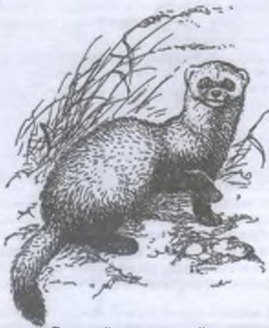
Светлый, или степной, хорек

Степной хорек. Отличается от лесного более светлой окраской. Общий тон меха у него палево-белесый. Спина окрашена темнее боков, голова светлая, вокруг глаз заметна темная маска, которая с возрастом бледнеет и почти исчезает. Низ тела, конечности и кончик хвоста черно-бурые. По общему облику степной хорек настолько похож на лесного, что различить этих зверьков порой бывает трудно. Иногда отличить один вид от другого помогает только окраска хвоста: у лесного хорька хвост весь черный, тогда как у степного он желтый или палевый, а черным бывает лишь его конец.