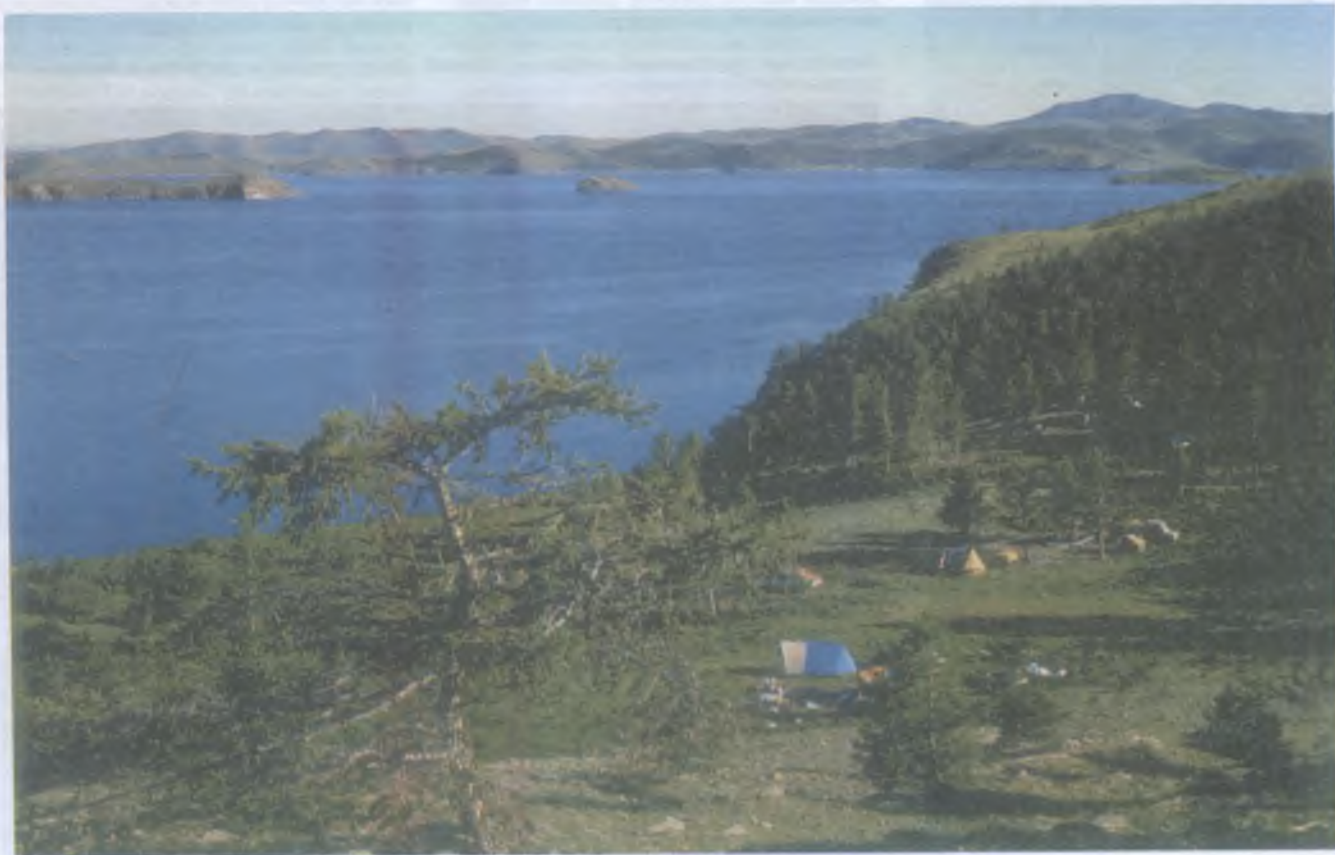
Байкал. Берега Малого моря и особенно бухты Мухор привлекают множество туристов. Прибайкальский национальный парк

Книга «Заповедное дело» (М., 2003, положительная рецензия Ю. Лихачева в журнале «Охота и охотничье хозяйство» № 2 за 2004 г.) имеет подзаголовок: «Толковый терминологический словарь-справочник с комментариями». В том, что это издание в целом полезно, нет никаких сомнений, но, пожалуй, было бы правильнее назвать его «информационно-дискуссионным», ибо большинство статей написано в ключе полемическом, когда приводятся разноречивые толкования, из коих читателю предлагается предпочесть то, которое больше нравится авторам. Но где гарантия в его справедливости, и «что есть истина?» Поэтому назвать эти тексты и книгу в целом «справочником», на наш взгляд, трудно. Часто упрекая своих оппонентов в субъективности, авторы (во всяком случае пер-