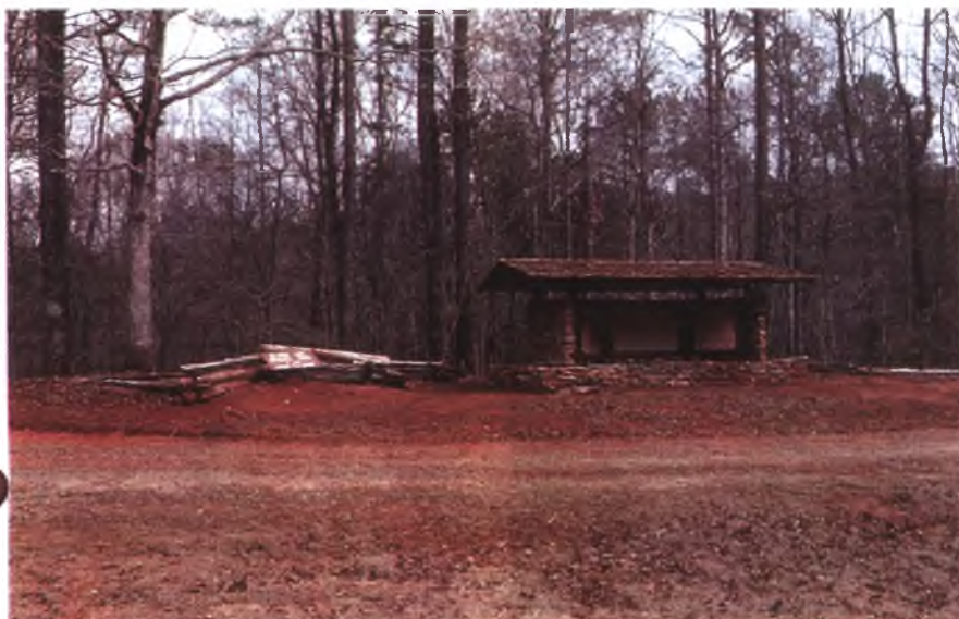
Капитальная подкормочная площадка для диких копытных животных в штате Джорджия (США)

емы для разведения водоплавающей дичи и других полезных животных.