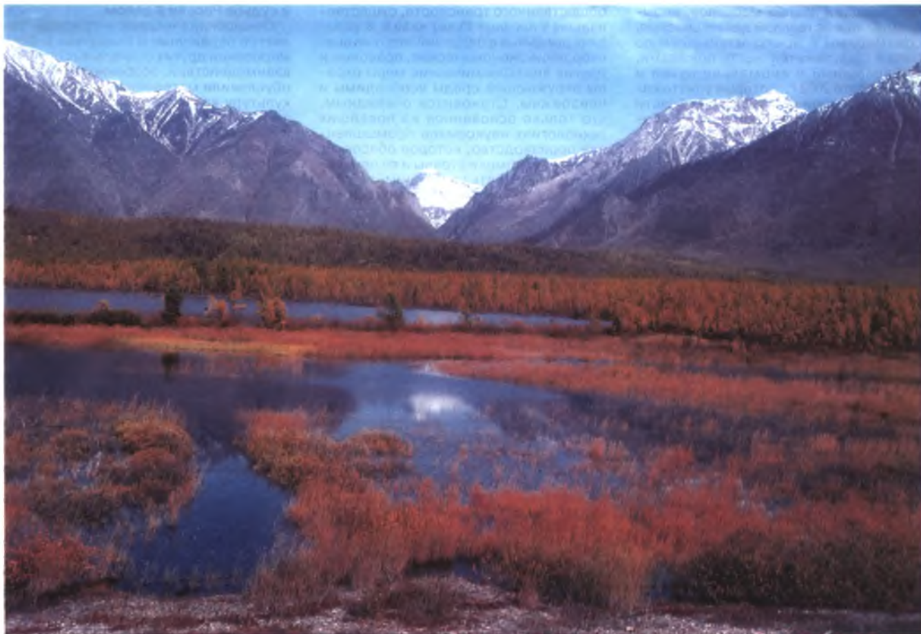
На громадной территории России (около 65 %) сохраняются массивы почти нетронутой, свободной и дикой природы. Северо-западное побережье Байкала. Здесь напротив ущелья р. Молокон можно любоваться одной из самых грандиозных и монументальных байкальских панорам

Вторичное сырье (лом металлов, макулатура, использованная стеклотара и т. п.) в прошлом в обязательном порядке сдавались на соответствующие приемные пункты. И это в немалой степени способствовало сбережению и рациональной добыче природных ресурсов. Теперь же, когда морально-идеологические стимулы ослаблены, а государственные учреждения не утруждаются научно обоснованным регламентированием размеров добычи природного сырья (с учетом целесообразности вовлечения в хозяйственную деятельность вторсырья), полагая, что «рынок все отрегулирует», стало очевидным, что лишь экономической заинтересованности недостаточно. Например, в 70-е гг. XX в. в России при-