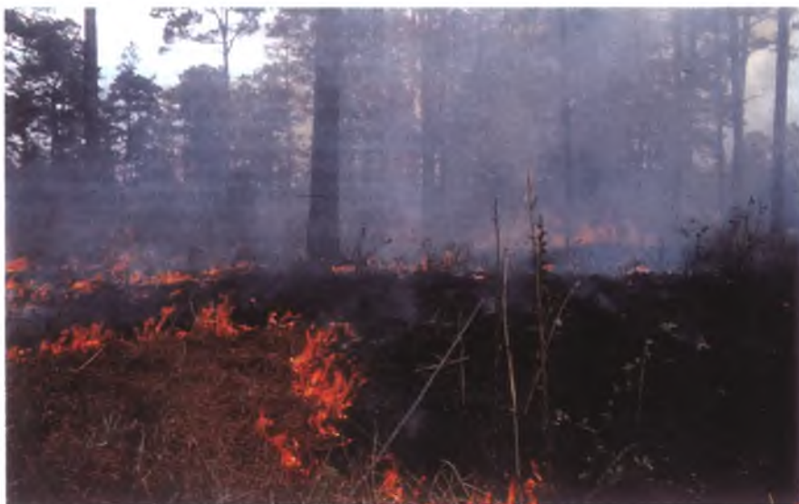
Контролируемый пал леса во Флориде (обновление кормовой базы животных)

финансирования, профессиональных кадров и постоянной доброжелательной помощи государства. Во главе отрасли находится мощная Служба рыбы и дичи Министерства внутренних дел США (последнее не занимается в этой стране полицейскими функциями). Она авторитетна, обладает необходимыми полномочиями, оснащена без ограничений специальной техникой, вооружением и транспортом (вплоть до воздушного), хорошо финансируется. По имеющимся у меня сведениям, лет 15—20 назад годовой бюджет этой службы составлял 1 млрд долл., получаемых из 100 источников. На долю бюджетного финансирования приходилось около четверти этой суммы, собираемой из платы за охотничьи и рыболовные лицензии (государство не оставляет ее себе). Авторы статьи приводили мнение работников Службы о том, что ее бюджет необходимо увеличить в 4—5 раз. Конечно, за истекшие годы их желание удовлетворено если не полностью, то в значительной степени, и Служба получает на свою деятельность несколько миллиардов долларов.