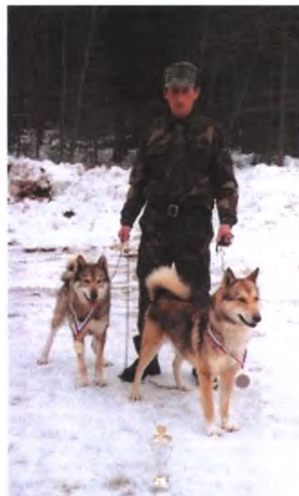
Абсолютные чемпионы по кабану и медведю — Ингуш и Юраш

Сначала зарегистрировалось 22 команды. Прошла жеребьевка. Первая половина пошла на медведя, вторая — на кабана. В процессе состязаний подъехало еще несколько команд, и к концу дня их было уже 27; некоторые регистрировались в неполном составе. Таблицу пришлось наращивать. Татарстан выставил 6 команд.