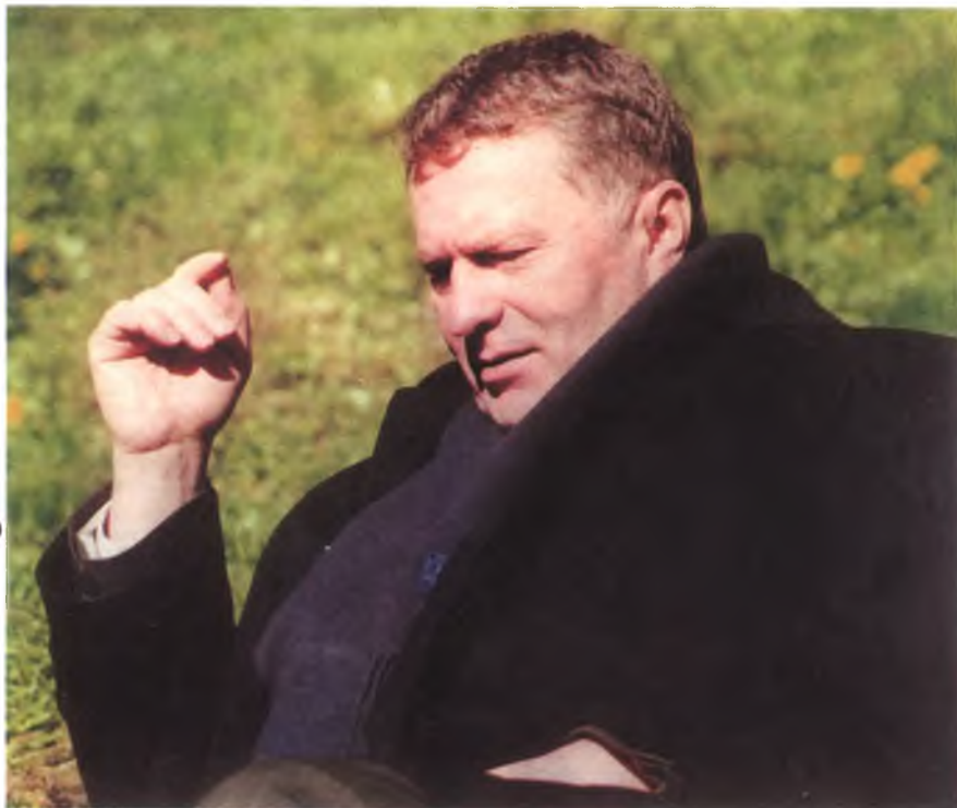
Владимир Вольфович Жириновский. Подмоскowie. 1998 г.

тоже проблема: отдавал в цирки, зоопарки, в детские спортивные учреждения. А собака есть — английский бульдог по кличке Комод. Уж больно он своей мордой напоминает старый добрый комод, который когда-то стоял у меня в комнате в Алма-Ате.