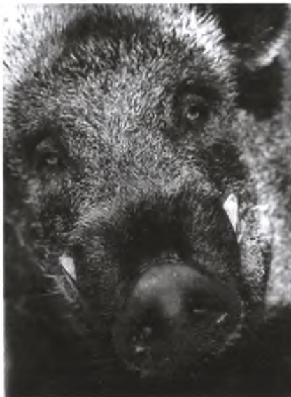
Пятак кабана служит и своеобразным лемехом, и органом обоняния и осязания. Он необыкновенно крепок, но при том же и удивительно чувствителен

Среднепоголетняя численность кабана в Амурско-Уссурийском регионе на моей памяти сократилась многократно. Некогда его плотность достигала 80—100 голов на тысячу «элитных» гектаров, для обширных же просторов уссурийской тайги она составляла одну особь на 1 км 2 . Но все это теперь в прошлом. Кабан был излюбленным объектом охотничьего промысла, а сезонная добыча доходила до 80—90 чушек на ружье. Редко в каком распадке Сихотэ-Алиня и Малого Хингана не