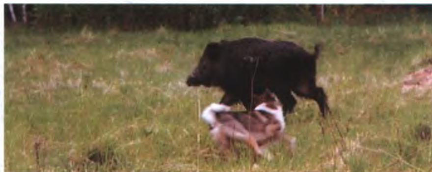
Западносибирская лайка старается остановить кабана

Я очень благодарен спонсорам, которые бескорыстно помогли в организации состязаний и награждении призами.