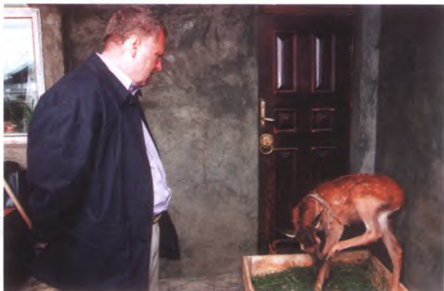
В Байкальском лимнологическом музее. Поселок Листвянка. 2003 г.

— Я желаю вашему журналу всегда находить своего читателя. Уверен, что в ближайшую тысячу лет Россия не станет страной вегетарианства и не превратится в кукольное государство. Охота — у нас в крови. Стало быть, у охотников и рыболовов есть будущее. И, надеюсь, это будущее принесет всем нам удачу в промысле. Ни пуха ни пера!