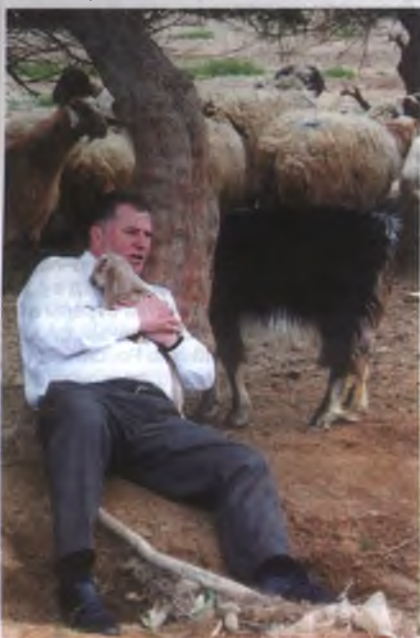
В. В. Жириновский на Кавказе. 1997 г.

— У меня дома были не только собаки. В свое время мне дарили медвежат, лошадей, диких кошек. Держать их дома непросто, а избавиться от них