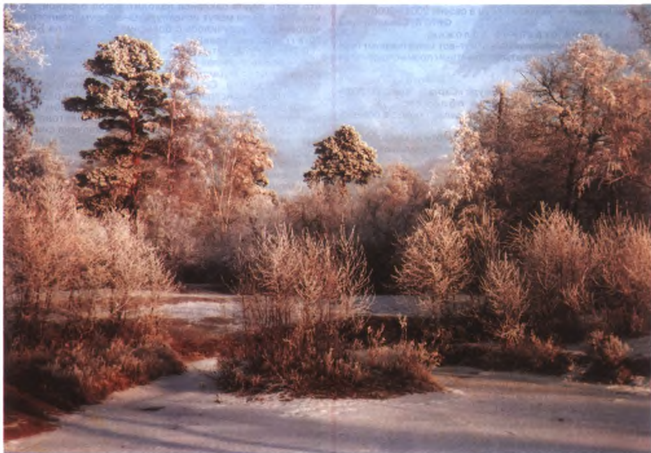
В. БОРИСОВ, Курганская обл. 2004 г.