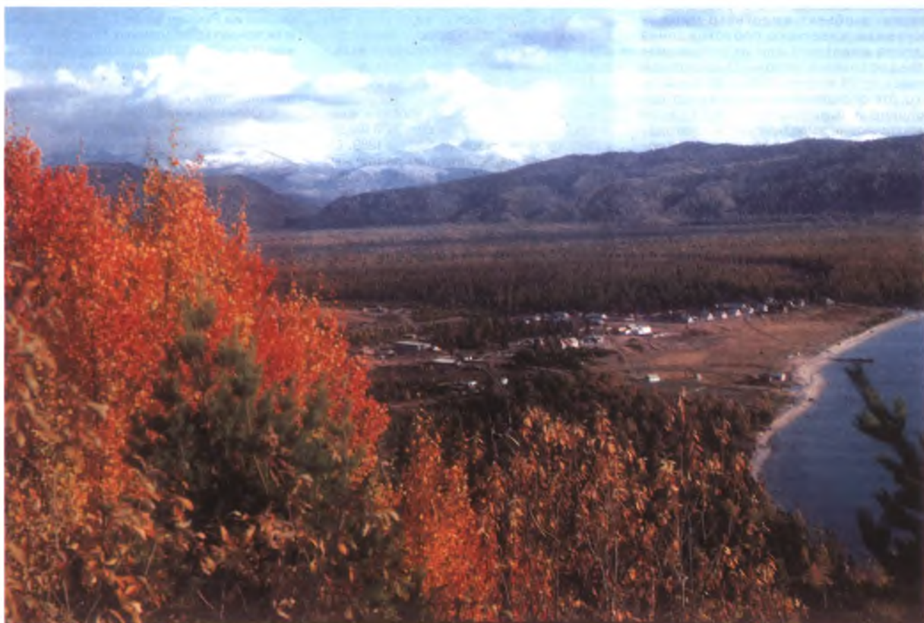
При учреждении заповедников — эталонов природы решающую роль сыграли «первичные силы» русской души: любящее сердце, созерцание, свобода, совесть, вера. Байкал, поселок Давше — центральная усадьба Баргузинского заповедника — первого государственного заповедника России, созданного в 1916 г.