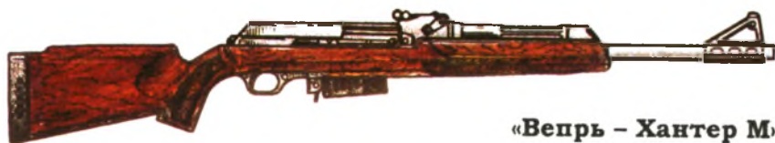
«Вепрь – Хантер М»

Примечание. SP — полубоблочная пуля с оголением свинцового сердечника в головной части, FMJ — сердечник полностью закрыт оболочкой, FMJBT — сердечник пули полностью закрыт оболочкой, а задняя часть имеет конус, П — поперечник разброса пуль при стрельбе на 100 м, V — скорость пули в м/с на указанной дистанции в метрах, E — энергия пули в кгс-м на указанной дистанции в метрах.