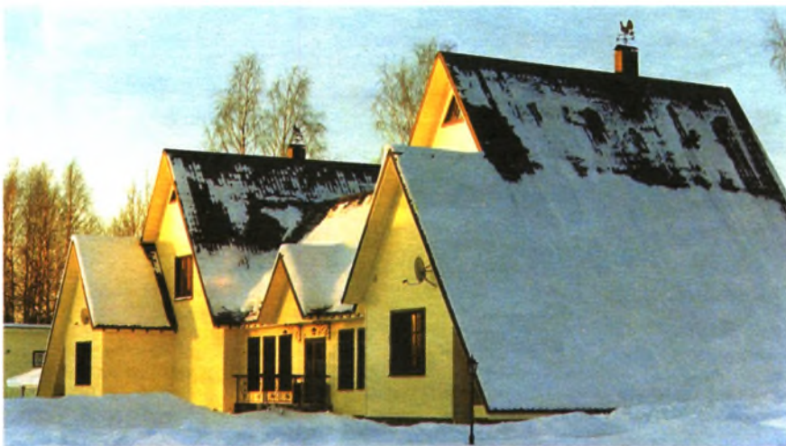
Охотничья база «Пёнтус»

Сделали 6 подкормочных площадок для кабанов с оборудованными вышками для учета и проведения охот. Соорудили солонцы, вешала с сеном для оленей, лосей. В 2001 г. завезли из Смоленского охотхозяйства им. Я. Я. Колесникова 60 годовалых кабанят, в 2002 г. привезли еще 50. Для них сделали в лесу выгородку из сетки-рабицы гектара на 3 с площадкой для под-