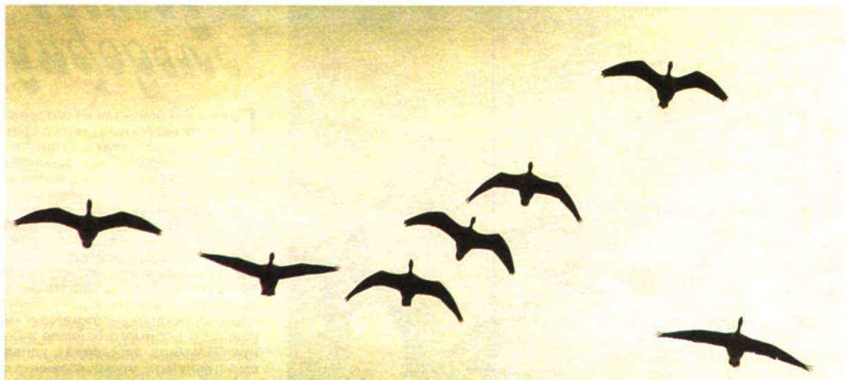
Белолобый гусь на пролете может быть встречен на всей территории России