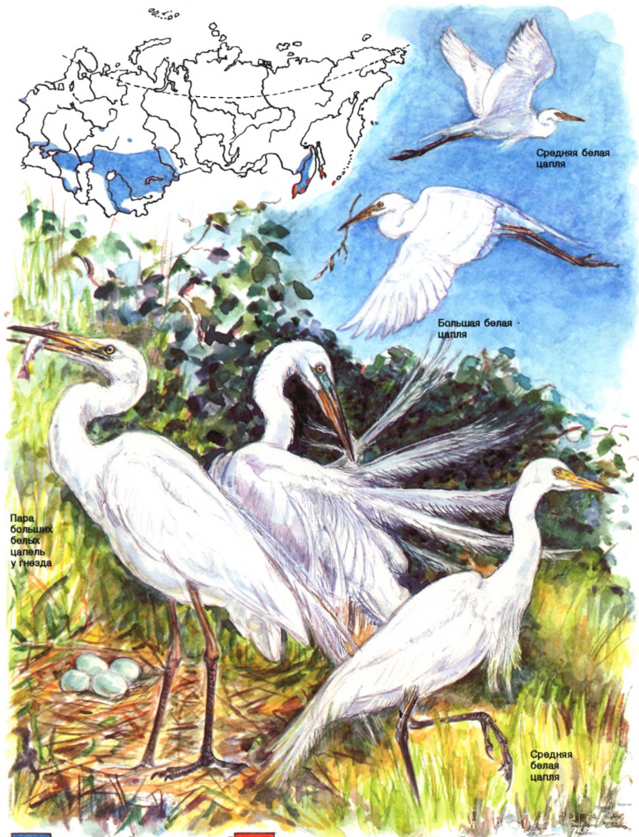
Пара больших белых цапель у гнезда