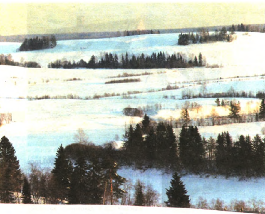
Угодья близ села Березник

скую природу, которую мы подчас не замечаем — ходим мимо, оглянуться некогда — заботы, работа... Какие уж там закаты! Да и гуси осенью летят мимо, на юг — туда, где нас нет.