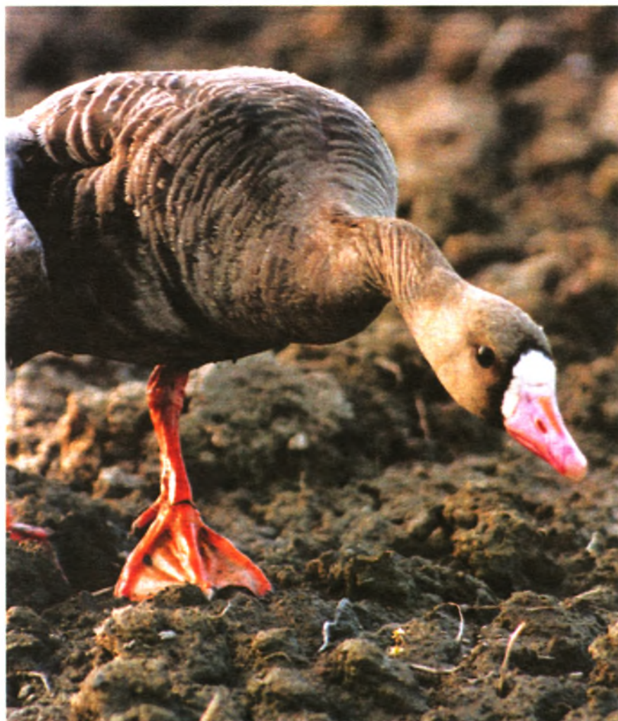
В России — 8 видов гусей. Гусь белолобый — один из них