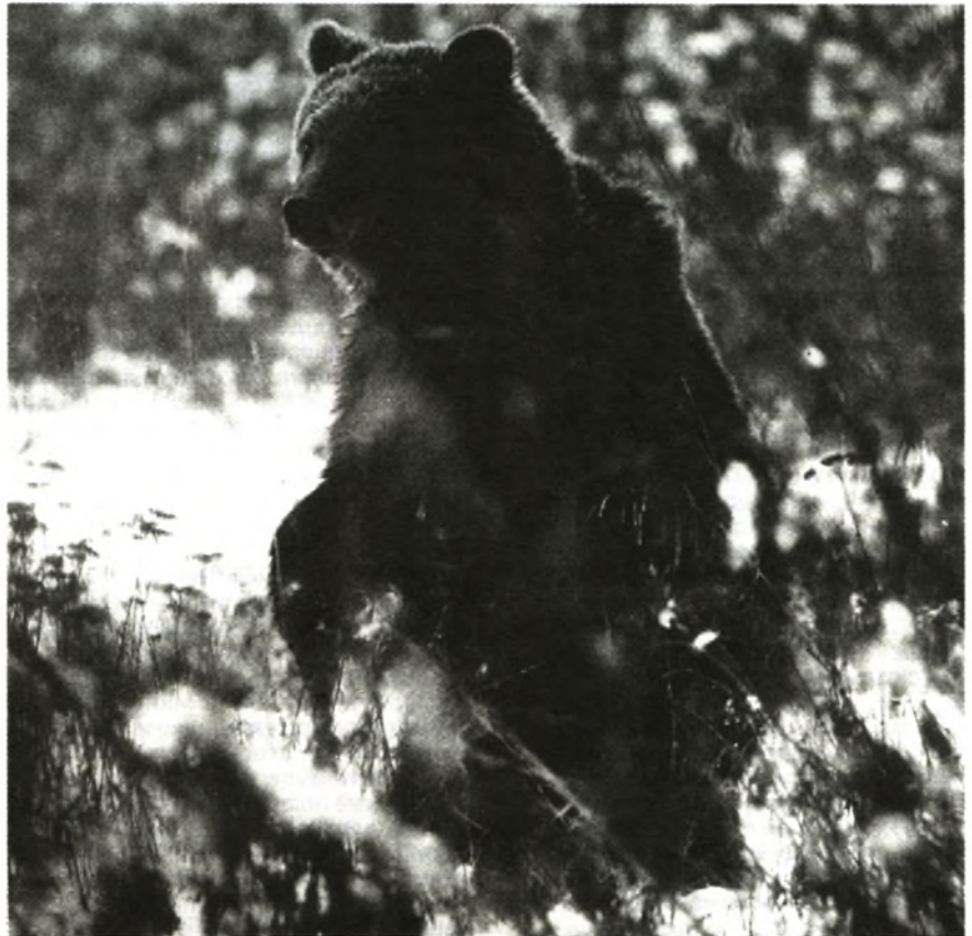
Медведь вдруг начал медленно приподниматься