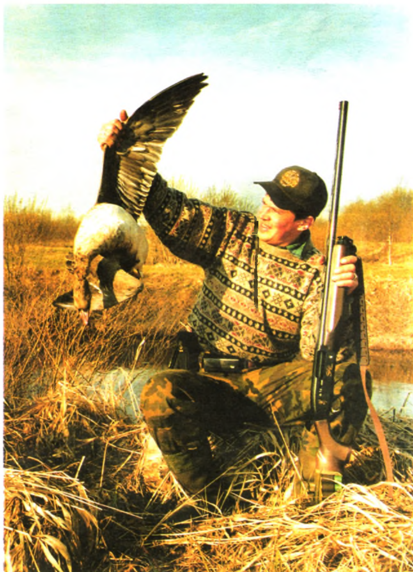
А это приятная награда, небольшое добавление к тому, что мне пришлось увидеть на этой охоте и чем я с радостью поделился с вами, дорогие читатели нашего журнала