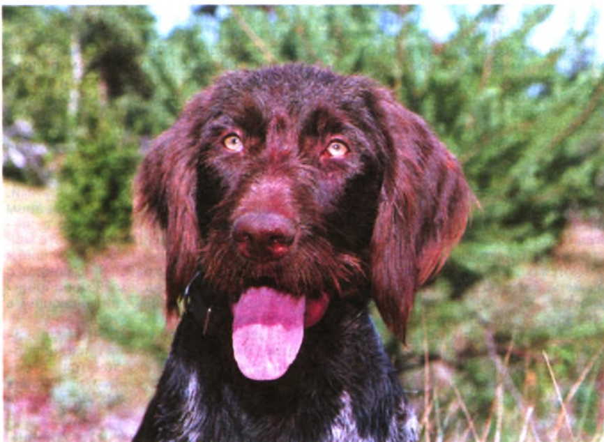
В 80-е гг. сложилась весьма благоприятная обстановка для самого широкого разведения и применения дратхаара на различных охотах

Уральская земля за 300 лет, особенно в военные (1941—1945) и послевоенные годы, превратилась в крупный промышленный регион с множеством добывающих и перерабатывающих предприятий, городами и поселками. От интенсивных лесных рубок пострадали даже кедровники. На месте вырубленных старых деревьев выросла обильная