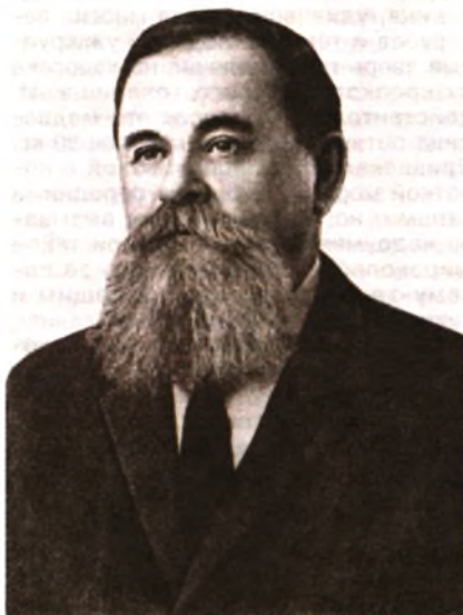
Василий Николаевич Скалон (1903—1976)

Все от одного корня (Брокгауз и Эфрон — с 1710 г. «от французского гугенота Георгия де Скалона». — Ф. Ш.). Однофамильцев у Скалонов нет. Все они в той или иной степени дальности родственники. Все они были военными. Каждая война имела своих героев Скалонов. Наиболее известен генерал Скалон — «сибирский генерал», любимец Павла I, который был убит под Смоленском и похоронен в присутствии Наполеона.