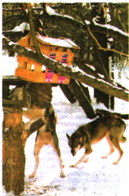
Бродячие собаки пытаются разграбить кормушку для птиц

К сожалению, количество таких «охотников» не уменьшается. После каждого летнего сезона дачники оставляют много собак, и те, пригретые сторожами, пополняют ряды «санитаров». Усилия одних охотников не приносят должного эффекта, так как собаки охотятся ночью, а днем спокойно отсиживаются на территории садовых товариществ. Нужны более действенные меры, иначе в наших лесах дичи поубавится не только от браконьеров, но и от одичавших собак.