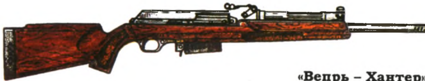
«Вепрь – Хантер»

Заводом «Молот» в г. Вятские Поляны началось изготовление самозарядных карабинов «Вепрь-Хантер» под американский патрон .30-06 Спринг-фильд (7,62x63) и патрон 7,62x51 (.308 Винчестер). Этот карабин по внешнему виду напоминает карабин «Вепрь-Пионер». Новая конструкция быстроразъемного блока ударно-спускового механизма позволила повысить плавность хода спускового крючка. Предохранитель двухпозиционный кнопочно-го типа; расположен в корпусе ударно-спускового механизма. Запирание ствола осуществляется поворотом затвора на три боевых упора с увеличен-