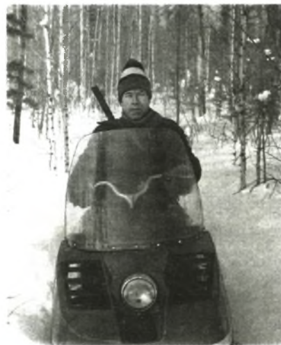
Для доставки снаряжения в зимовья, проверки путиков ничего лучше, чем снегоход, не придумали