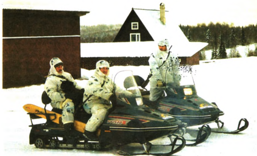
Отсюда с базы «Высокая» егеря отправляются на работу в угодья