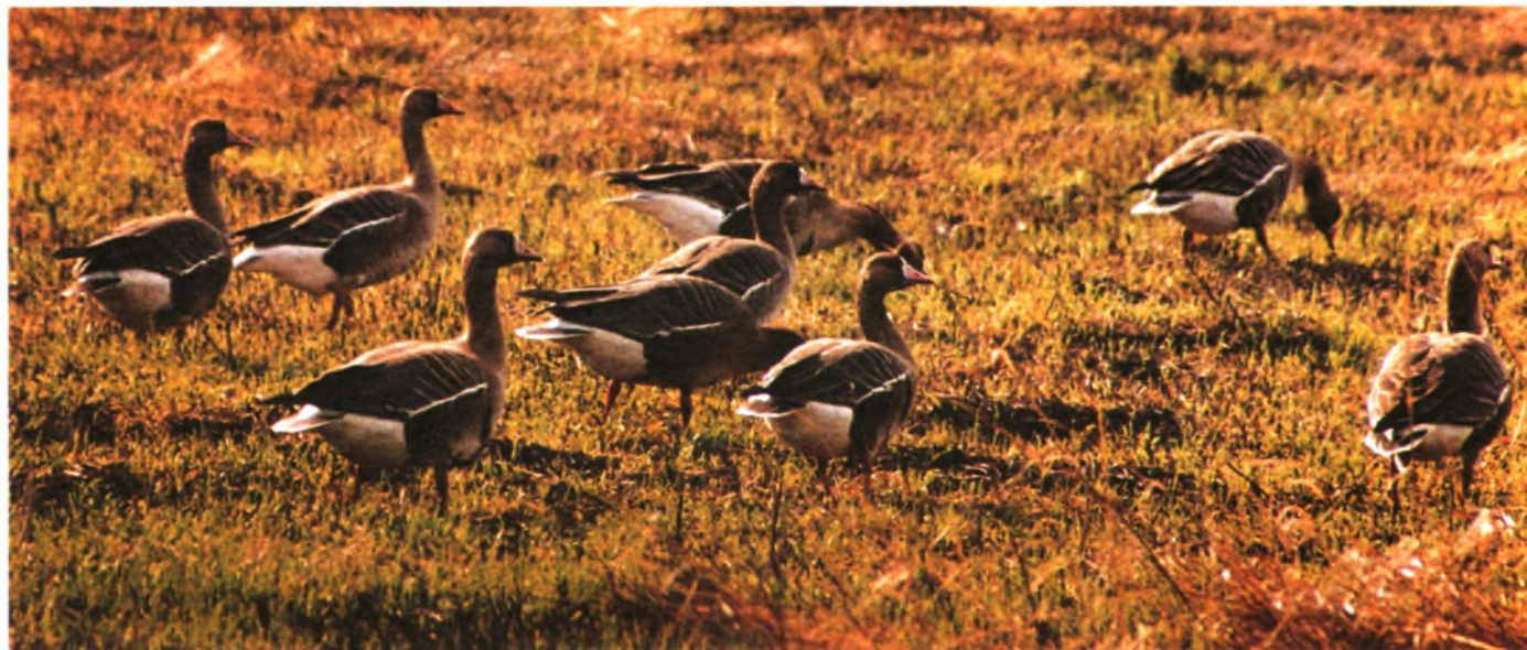
Белолобики гнездятся в зоне тундры, иногда в лесотундре

Казалось, что уж о таком массовом охотничьем виде должно быть серьезной литературы с избытком. Но выяснилось, что даже в «Публичке» и Библиотеке АН она в дефиците. Пришлось по крохам собирать интересную и по-настоящему значимую информацию и открывать для себя ГУСЯ, начиная с приобретения раритетной книги С. Алфераки «Гуси России», перечитывания «Года серого гуся» К. Лоренца, просматривания научных публикаций и брошюр и заканчивая собственными наблюдениями и размышлениями во время охотничьего сезона. Охоты в