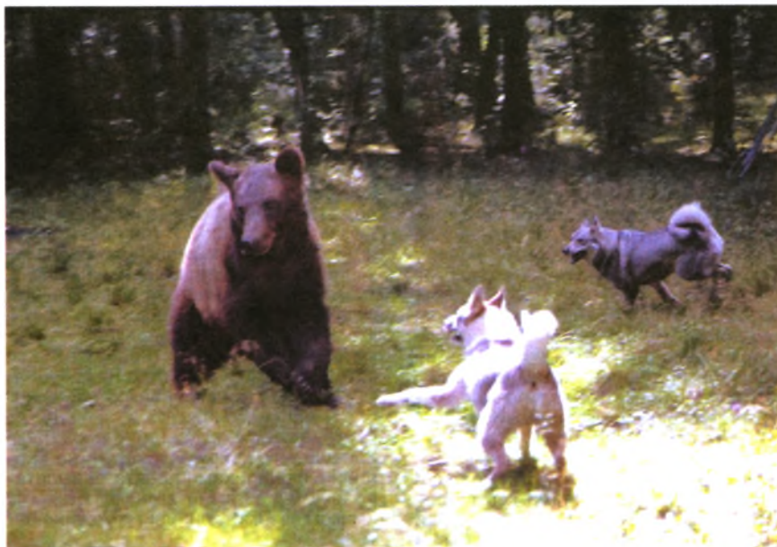
В 60—70-х годах основными породами собак, имеющими почти государственное значение, считались лайки, как помощники охотника на промысле

Испокон веков живут на Урале коренные жители: ханты и манси, дальние родственники финнов и венгров, пасут оленей, промышляют мясо и пушнину. Помощники в этом остроухие собаки — мансийская (вогульская) и хантыйская (остяцкая) лайки, рабочие качества