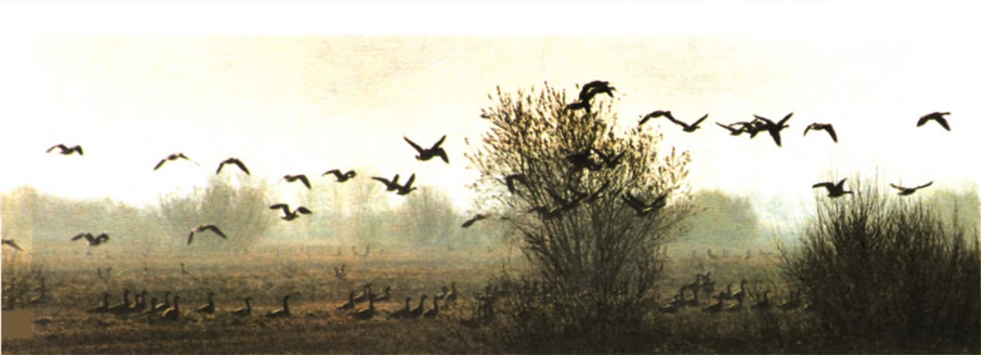
Обширные поля в районе Олонца в Карелии во время весеннего пролета становятся «Гусиной столицей — Олонией»

дельте Волги, в Псковской, Ленинградской областях, в Карелии и Киргизии привели к желанию не только наблюдать за гусем в природе и добыть трофей, но и снять его на фото пленку. Так появились эти снимки.