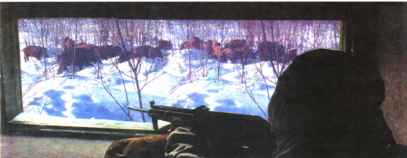
С вышки у прикормочной площадки

Но лирика лирикой, а в охотничьем хозяйстве масса работы. «Не люблю