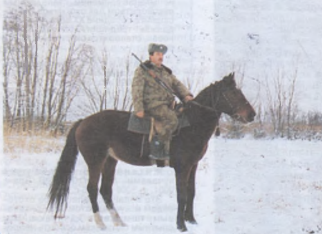
Лошади Хреновского конезавода используются не только в спорте, но и в охране охотничьих угодий области

Уважаемая редакция журнала! Пишу вам впервые, хотя журнал выписываю уже 30 лет. Родился и вырос я в Курской области, с детства любил природу, братьев наших меньших и эти чувства сохранил до сих пор. В 20-летнем возрасте переехал на Украину. Очутившись в степных просторах, продолжал заниматься охотой. Сейчас мне 45, имею хороших породистых охотничьих собак, принимаю участие в выставках, секретарь секции собаководства всего района. Мой взрослый сын тоже увлекается охотой, мы охотимся вместе.