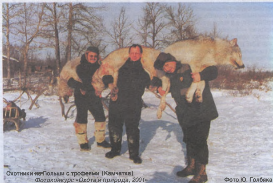
Охотники из Польши с трофеями (Камчатка) Фотококурс «Охота и природа, 2001»