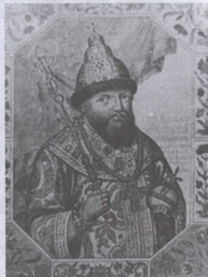
Царь Алексей Михайлович

В 1121 г. епископ Никанор в своем послании князю Святославу писал, что народ на Руси питается в основном лесной дичью: «Давлятину ядящие, и зверину, и мертвечину и кров, медве-