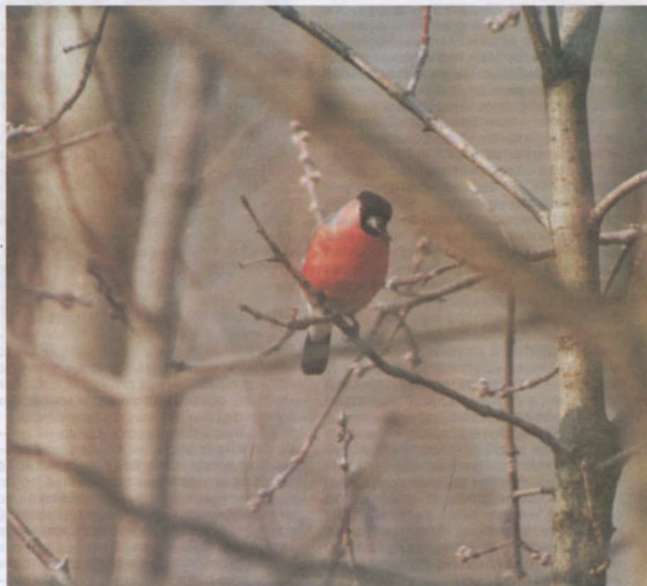
А. СЕВАСТЬЯНОВ Фото автора

Закрываешь окно. Как будто побывал в лесу на настоящей фотоохоте.