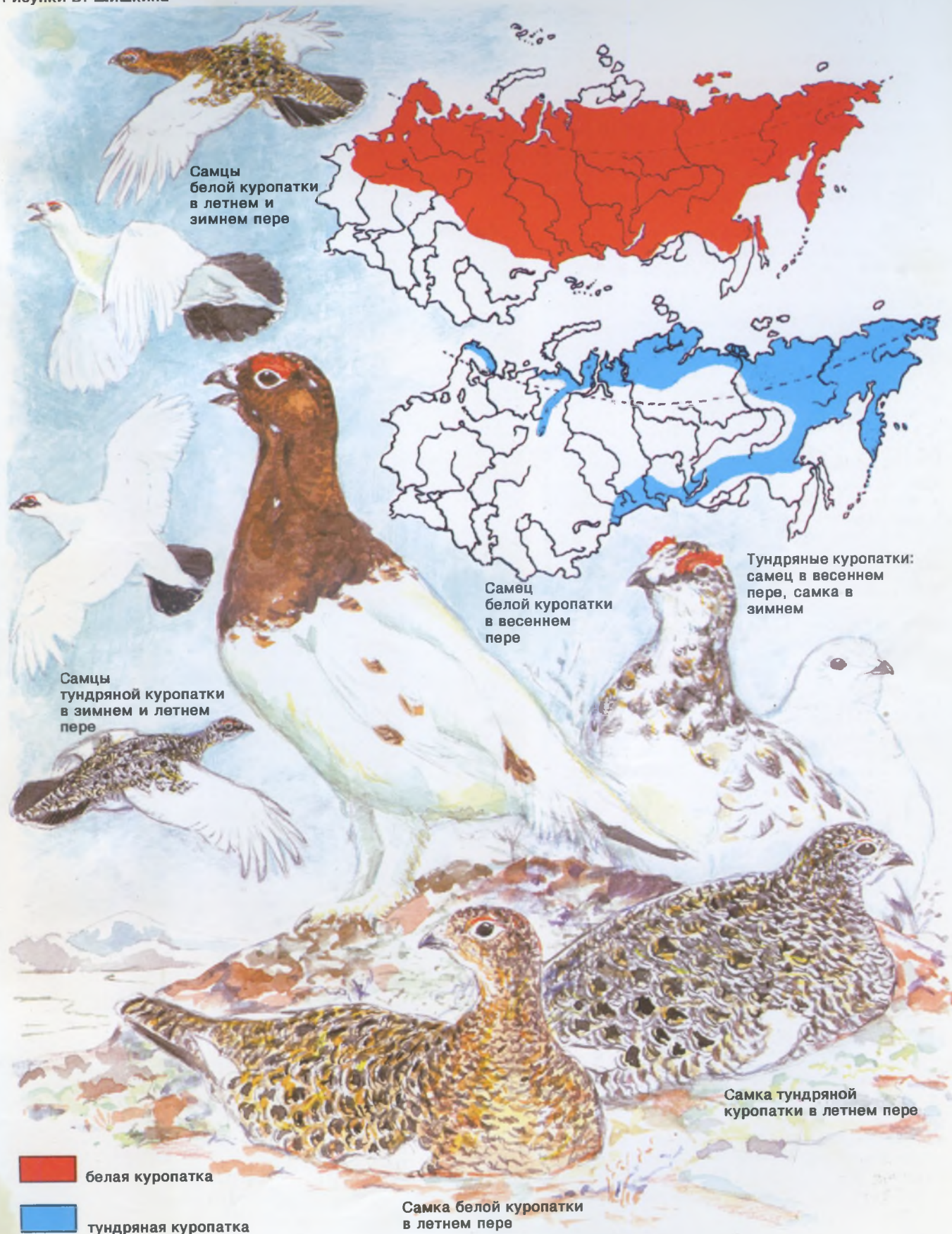
Самцы белой куропатки в летнем и зимнем перье