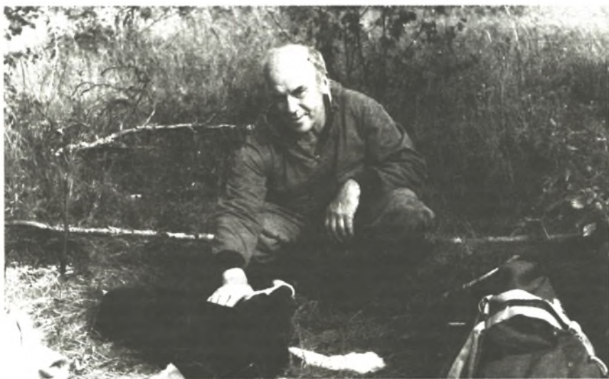
Автор статьи со своим верным помощником на охоте

Иногда случается слышать такие разговоры: «Ну соболь, ну и что? И куницы бывают не хуже!» Верно, бывают, но редко. Мех соболя очень разный, и зависит это прежде всего от районов его обитания. По качеству меха его издавна делили на несколько «кряжей». В настоящее время их, по-моему, восемь: тобольский, алтайский, минусинский, енисейский, амурский, баргузинский, якутский и камчатский, а раньше их было еще больше. Основные отличия между кряжами — это общий цветовой фон, цвет подпуши, а также дли-