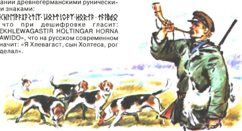
Рисунок Б. Игнатьева

* Граффити — надпись на оружии, посуде, стене храма, пещеры и т. д.