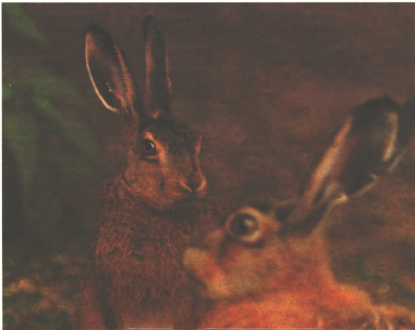
Увидеть сразу двух русаков — большая удача

На подъем зайца, даже хорошей собакой, нередко уходит много времени. Особенно это бывает в дни, когда ночные следы зверьков смыты дождем или засыпаны снегом. Заяц на лежке дает мало запаха, и собаке его трудно почувствовать. В этих условиях охотник может помочь собаке побудить косога. Для этого стоит, не жалея себя, пробираться теми, иногда очень неудобными для