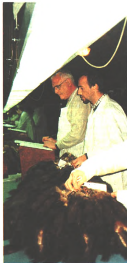
В настоящее время поставка шкурок соболя «Союзпушминой» на экспорт сократилась в 2,5 раза

денежных средств от продажи именных разовых лицензий в сравнении с внутрироссийским оборотом дикой пушнины. С этой целью данные Охотдепартамента по заготовкам пушных зверей в сезоне 1998/99 г., а следовательно, и количество проданных разовых лицензий были сгруппированы по видам их ценности: 1 — соболь, бобр, выдра, рысь; 2 — барсук, енот, куница, лисица; 3 — все остальные виды. Стоимость