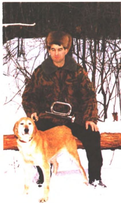
По белой тропе. Перед началом охоты

Настоящий гончатник будет еще больше уделять внимания полевым занятиям со своей собакой, чтобы получить полевой диплом. И если она достойна диплома, она его получит и на следующую весну или осень. И еще хочется вернуться к ранее сказанному об истории: правила полевых испытаний гончих постоянно претерпевали изменения начиная с 1900 г.: в 1911, 1925, 1939, 1947, 1954, 1959, 1972 и до сегодняшних новых правил. Это и есть наша история.