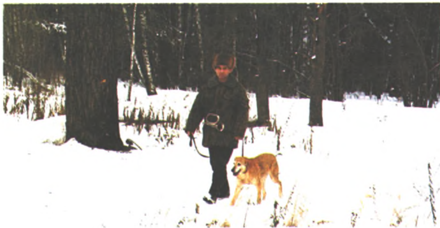
По белой тропе

Живя в Горьком, я часто заходил в книжные магазины, приобретал книги по охоте. В киосках покупал журнал «Охота и охотничье хозяйство». Торо-