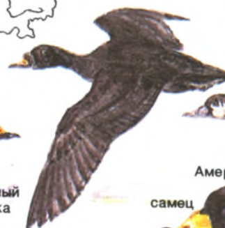
Синьга самец, самка