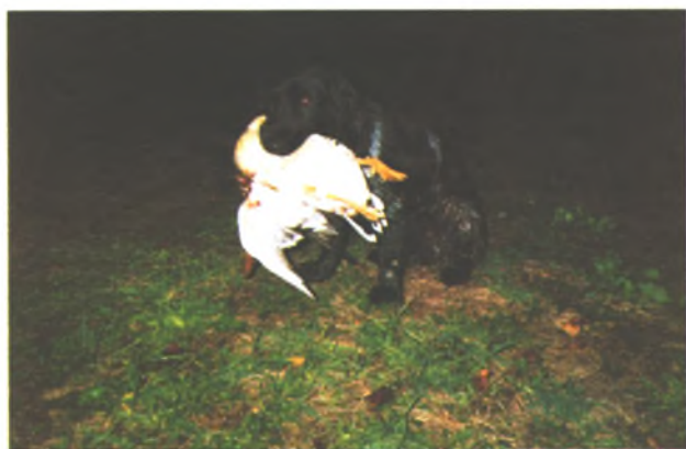
Эффект ночной съемки — утка кажется белой.

Низкий гул, странно похожий на ход автошин по бетонному мосту, подсказал, что рядом, невидимый за кустами, пролетает табунок. Немедленно начинаю манить. Шваркающим голосом ответил селезень: похоже, утки повернули ко мне. Теперь бы угадать, откуда налетят. Как всегда это не удается. Из полумрака, почти касаясь вершин кустов, стремительно, как пущенные из пращи, метнулись над баклушей под защиту деревьев четыре утки. Не имея времени выцеливать, кинул на плечо пятизарядку и успел лишь раз нажать на курок.