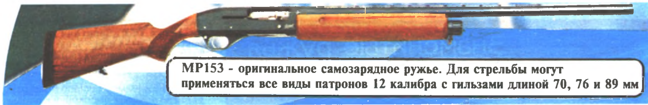
MP153 - оригинальное самозарядное ружье. Для стрельбы могут применяться все виды патронов 12 калибра с гильзами длиной 70, 76 и 89 мм

пространенным среди наших охотников патроном 7,62x51, с оптическим прицелом, с ложей типа «Монте-Карло», с ложей типа «Stutzen», закрывающей ствол снизу по всей длине, с матовым хромированием ствола и ложей в стиле «Ferlach», с камуфлированной ложей из поликарбоната, выполненной заодно с цевьем (ствольная коробка закрыта с боков), с рамочным прикладом из поликарбоната. На некоторых образцах устанавливается эжектор. Появился и облегченный вариант этого ружья под названием «Юниор». За рубежом это ружье попало в разряд престижных однозарядных штуцеров для спортивной охоты на копытных и получило наибольшее распространение в Финляндии и Швеции.