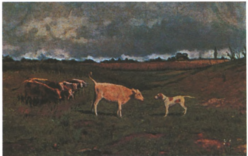
А. Маковский. Первое знакомство

До самой смерти А. Маковский радовал своих почитателей. Последние годы жизни художника отмечены появлением новых охотничьих сюжетов: «Пейзаж с собаками» и «Охотник». Природа в этих картинах отличается ясностью и чистотой цвета; она светла и нежна как образ всей России. Неплохо представлены и собаки, напомнившие мне об одном рисунке Александра Владимировича — «Друг», показанном на Выставке этюдов и эскизов еще в 1914 году. В этой графической работе пойнтер удерживает два больших ключа на концах шнурка, перекинутого через морду чуть выше носа. Аллегорический смысл зарисовки, по-видимому, многовариантен. Возможен и такой: отец и сын Маковские нашли ключи к сердцу преданного друга человека.