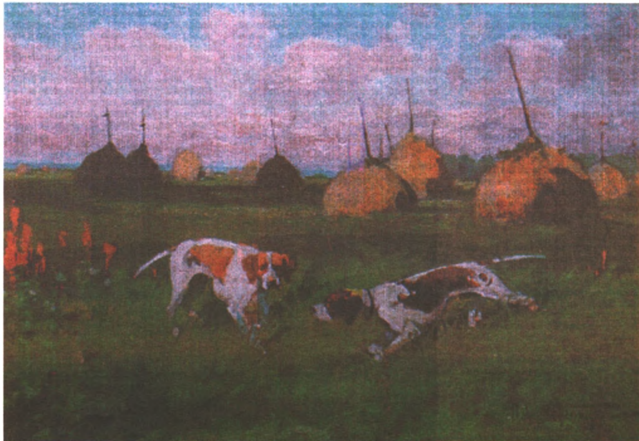
А. Маковский. Пейзаж с собаками

О любви охотников и рыболовов к преувеличениям издавна ходят на Руси байки и анекдоты. Они не обошли сто-