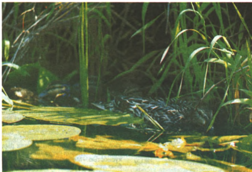
Остров Городец Кряквы с выводком птенцов

Повышение статуса заказника делает совершенно необходимым проведение инвентаризации еще недостаточно изученных его компонентов — растительности и отдельных групп животных, а также абиотической составляющей. В 1999 г. по заданию Псковоблхотуправления (начальник С. Ю. Иванов) выполнена НИР «Роль федерального зоологического заказника «Ремдовский» в сохранении биологического разнообразия бассейна Балтийского моря (на примере сосудистых растений и птиц)». В ближайшее время предполагается осуществить комплексное обследование крупных болот заказника: Влажные мхи, Дубборское и Зыбун.