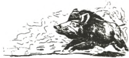
Рисунок Б. Игнатьева

Наступила весна, и табун ушел на солонепёную сторону сопки. Заворотень не последовал за выводком. Он остался на хвощах, пока совсем не растаял снег, а затем направился к полюбившемуся ему мухенскому ключу. Как-то в конце весны, совершая длительную прогулку, Заворотень встретил знакомую свинью. Около нее снова шли шустрейшие полосатые, словно бундуки, поросята. При виде беззаботного отца своего семейства недовольная мать ошетилилась и с ревом набросилась на него. Пришлось Заворотню убираться восвояси. Вернувшись на мухенский ключ, он обосновался там на все лето. Осенью пришли охотники. Они выстроили в устье ключа зимовье и, конечно, обнаружили следы секача. Все попытки взять осторожного и хитрого кабана оказались безуспешными. Вскоре охотники смирились с мыслью, что старый Заворотень неуловим. Им даже было приятно, что рядом живет столь солидный зверь, встретиться с которым каждый из них не терял надежды.