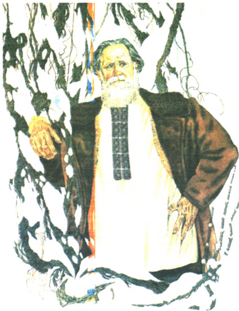
В. П. Сысоев. Портрет работы Г. Павлишина

точной тайге, писать об этом статьи и популярные очерки. Итогом походов со студентами по краю стала коллективно написанная книга «Природа и хозяйство Кур-Урмийского района».