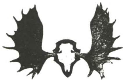
Фотоконкурс «Охота и природа, 1999»

Условия фотоконкурса «Охота и природа 2000» смотрите в журнале «Охота и охотничье хозяйство» № 1 за 2000 г.