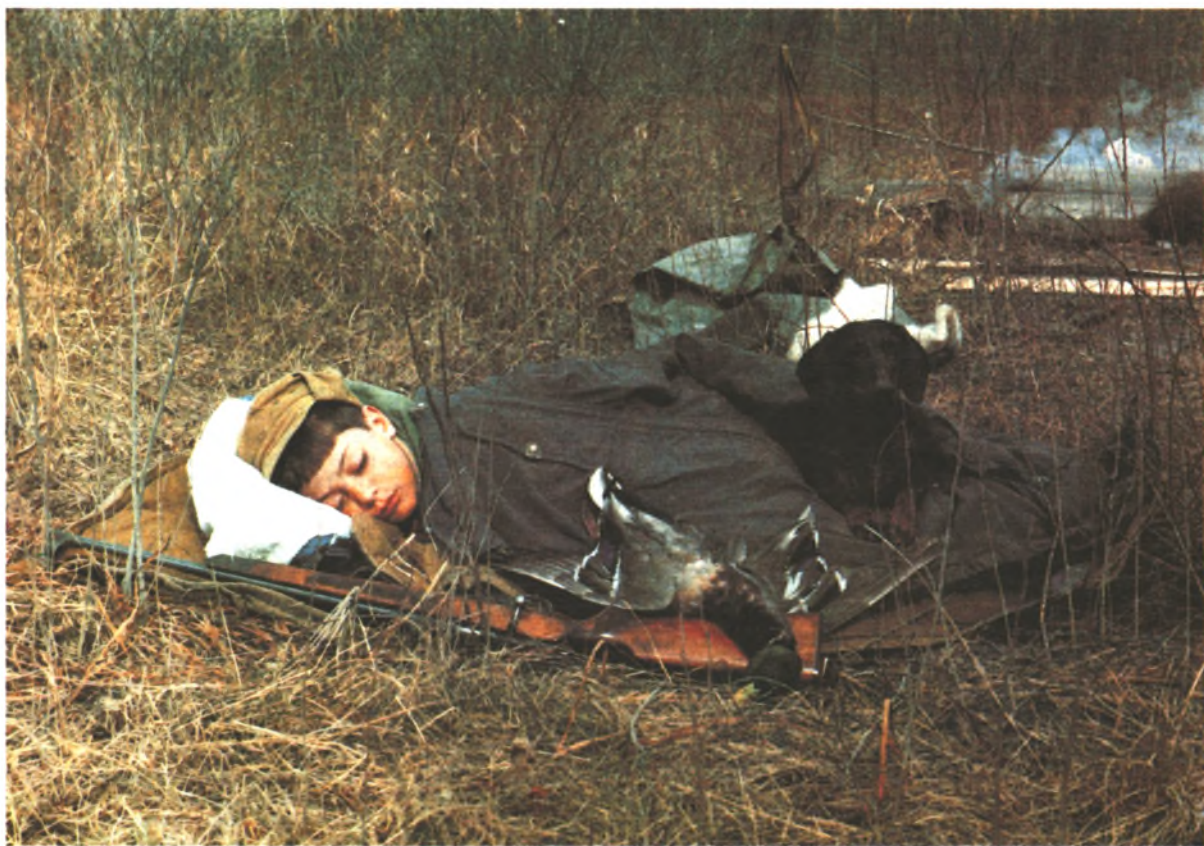
«Ох, и трудная эта работа»...