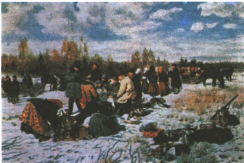
А. Маковский. На облаву

роной и живопись, о чем красноречиво говорит сюжет картины А. Маковского «Заврался». Пожилой бородач увлеченно рассказывает трем молодым людям какую-то охотничью небылицу. Их лица и жесты в разной степени отражают недоверие. Но сидя у самовара, видимо, хлебнувши с устатку винца, да после нескольких верст пёхом, друзья настроены вполне благодушно. Ведь в такой обстановке важна не достоверность рассказа, а атмосфера дружелюбия и внутреннего восторга, понятно-го людям романтического, охотничьего склада. Что-то перовское есть в этой истории, но у Маковского она живее, естественнее, лишена театральности. У В. Перова («Охотники на привале») собака отдыхает. Здесь обе собаки участвуют в происходящем. Та, что лежит у стола, устремила свой взгляд на «завравшегося» и как будто увлечена его повествованием. Другая, напротив, смотрит на слушающих, как бы спрашивая: «Неужели вы верите в эти сказки?» Конечно, художественные достоинства перовской вещи несомненно выше, но по живости действия и образности картина Маковского предпочтительнее. Вспомните, кто из вас в такой же вот ситуации не развлекал товарищей неслыханными случаями из собственной охотничьей практики?