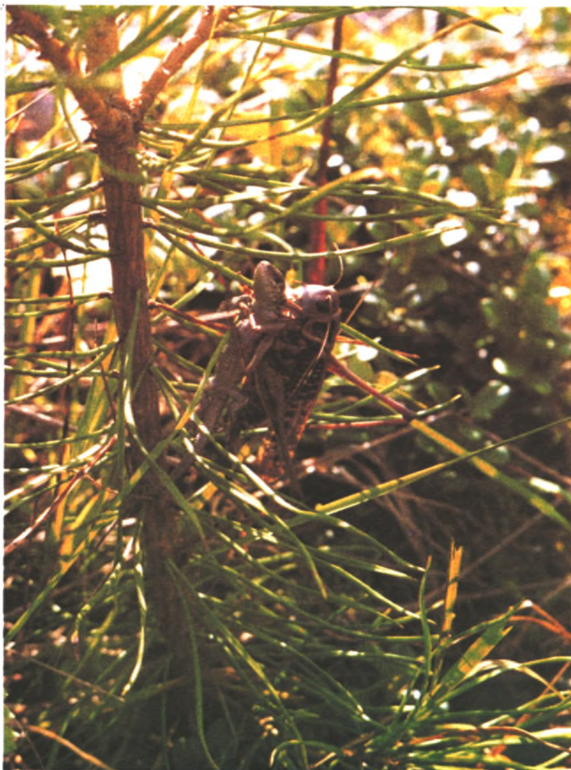
ФОТО НА КОНКУРС

Эту уникальную фотографию посчастливилось сделать Олегу Чугунихину. Только специалистам-энтомологам известно, что серый кузнечик, хотя и питается растительной пищей, предпочтение отдает охоте на насекомых. Однако нападение его на молодую ящерицу — событие совсем неординарное