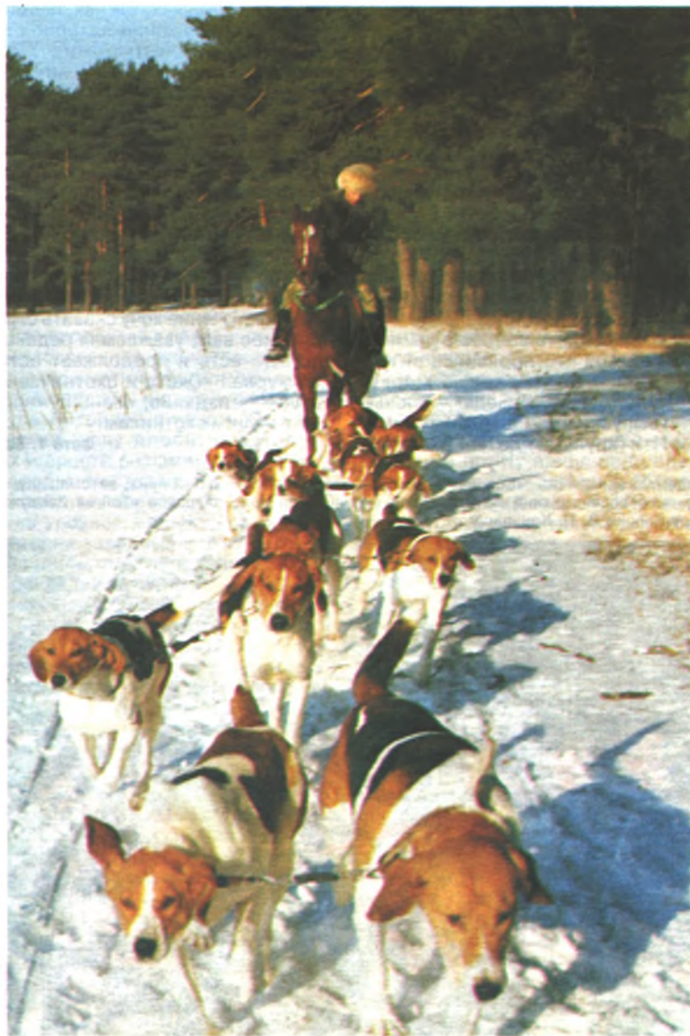
Возрождение охоты со стаями гончих

Если из тех, что 60-минутной гоньбой гончая доказывает свою нестомчивость