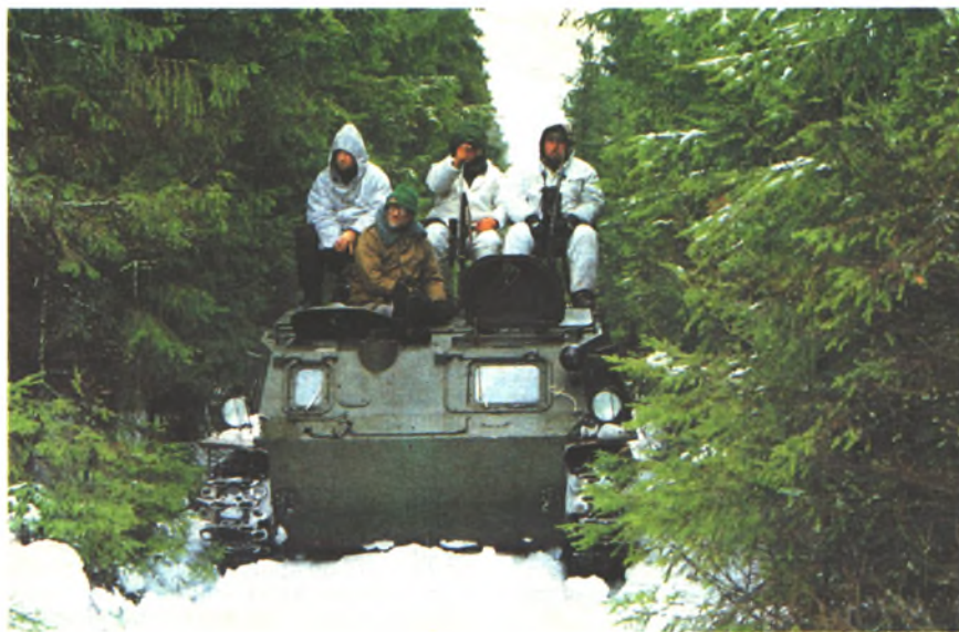
Выезд на коллективную охоту

Если ранее пошлина выплачивалась при выдаче и при продлении сроков действия охотничьих билетов, то формулировка «за выдачу разрешений на право охоты» вызвала немало вопросов. Например, налоговые органы считали, что срок действия охотничьего билета один год и за его продление