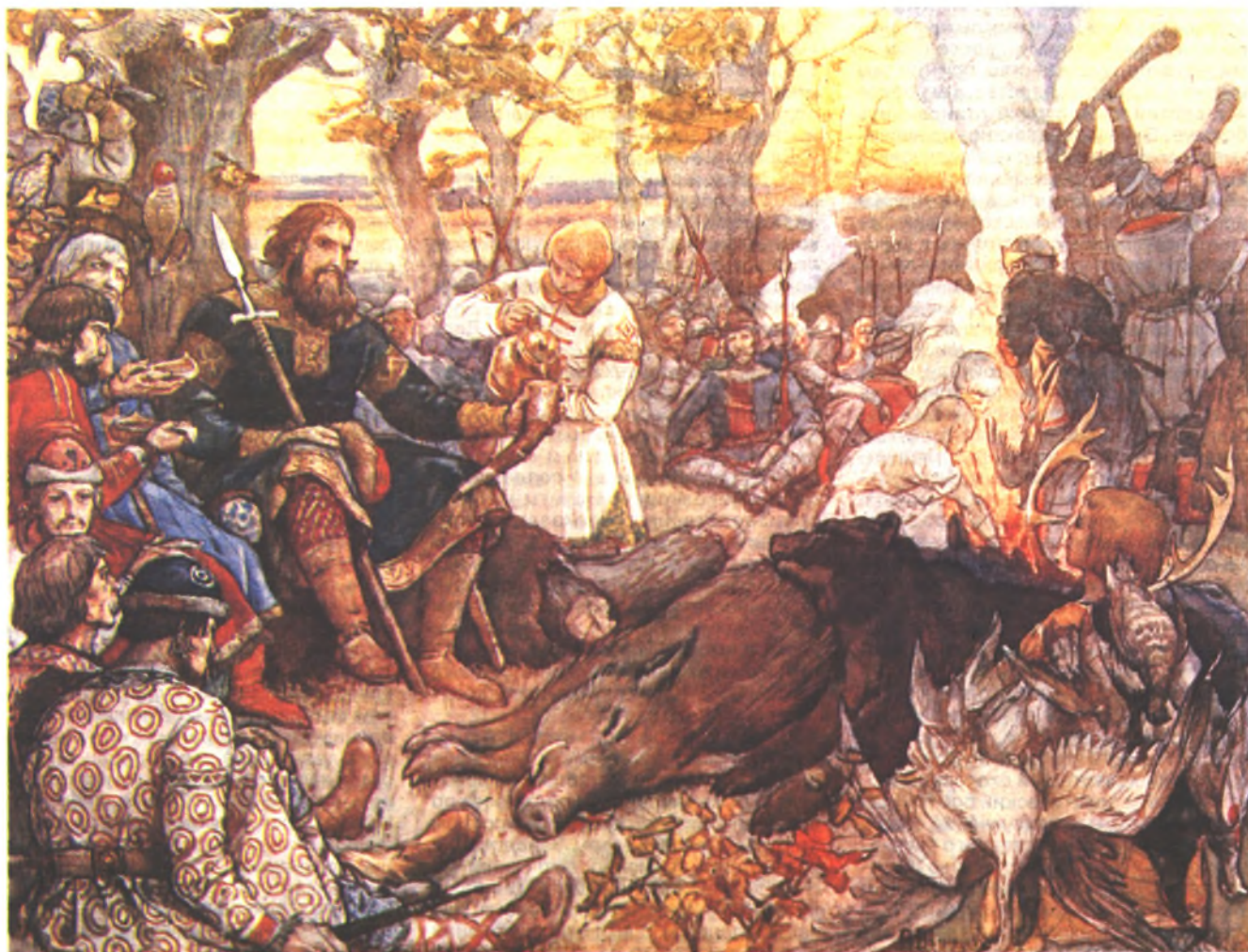
В. Васнецов, 1895 г. Отдых Владимира Мономаха после охоты

В канун революции, особенно с началом мировой войны, члены Императорского дома в охотах участвовали редко. Однако внимание к охотничьей службе в Министерстве Императорского дома и уделов не ослабевало, поскольку из царской забавы она уже переросла в отрасль хозяйства, нуждающуюся в научном и практическом обеспечении. Появились охотничьи хозяйства у многих особо состоятельных людей, да и простонародье никогда не теряло интереса к охоте. Охотничье хозяйство, как подтверждал опыт за-