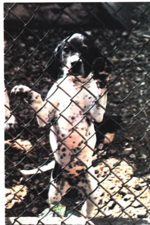
В этом щенке кровь пятнадцати чемпионов