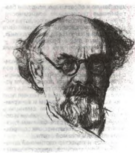
Портрет М. Пришвина работы О. Верейского

неявная, но несомненно существующая корневая связь любви к природе и любви к слову — недаром язык большинства русских писателей, близких природе и знавших ее, отличается особым «ладом» и чувством меры. Ключом к познанию этой глубинной связи, к определению своего места в окружающем мире и своего к нему отношения стала для Пришвина охота. В охотничьих путешествиях утвердился характерный пришвинский творческий принцип — «родственное внимание» к изображаемому: к природе, людям, к явлениям жизни. Он старался изображать действительность, ничего не «выдумывая из себя». «По природе я не литератор, а живописец, — признавался Михаил Михайлович, — я работаю по натуре, и если дерево стоит направо, а я напишу налево, то рисунок мне обыкновенно не удается». Пришвинское «паразитное умение создавать словами лицо его земли, живой образ его страны» отмечал Горький, восторженно приветствовавший появление в России нового самобытного писателя.