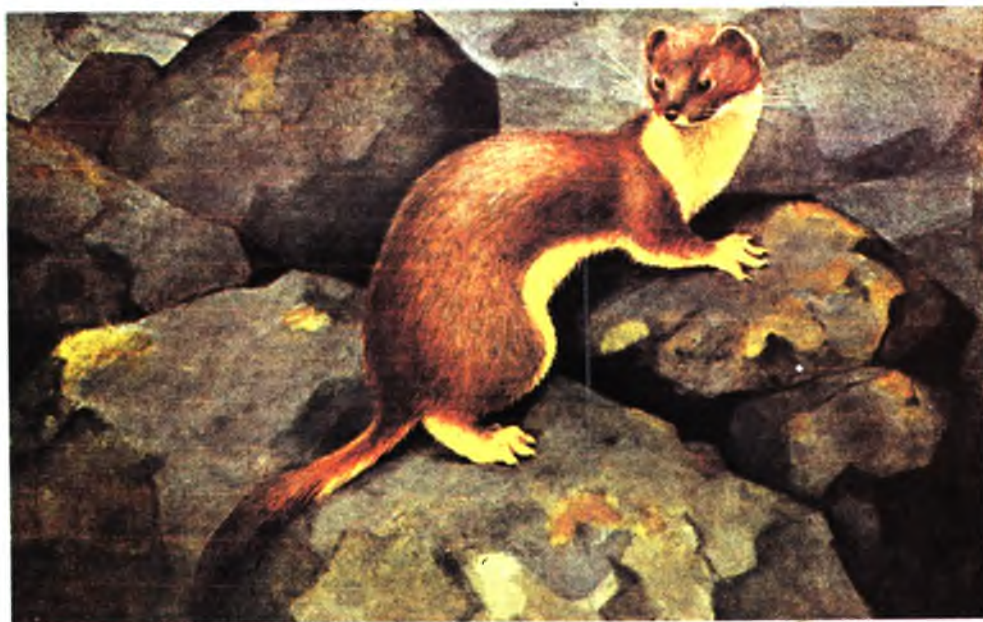
Рыжеголовый (средиземноморский) сокол. Украинская белка. Колымский горноста́й.

Рисунки В. Ватагина к очерку В. Шишкина «Добрые звери мудрого мастера»