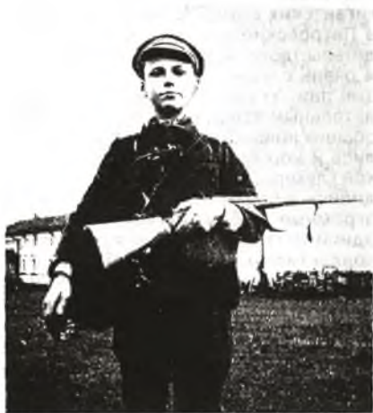
Мой третий осенний глухарь. 1919 г.