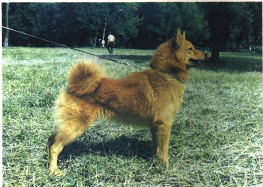
Одна из лучших карело-финских лаек