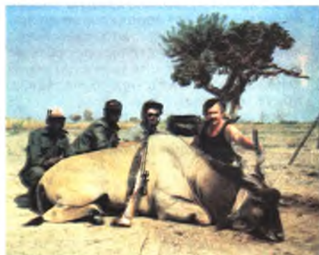
Антилопа Иланд, ЮАР