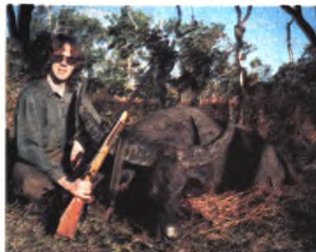
Водяной буйфало, Австралия