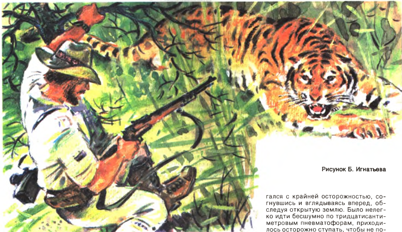
Рисунок Б. Игнатъева

Прокладывая путь через кусты со своей добычей, тигр оставил отпечатки лап на влажной глине, а кроме них след из крохотных лепестков, опавших с цветущего кустарника. Я дви-