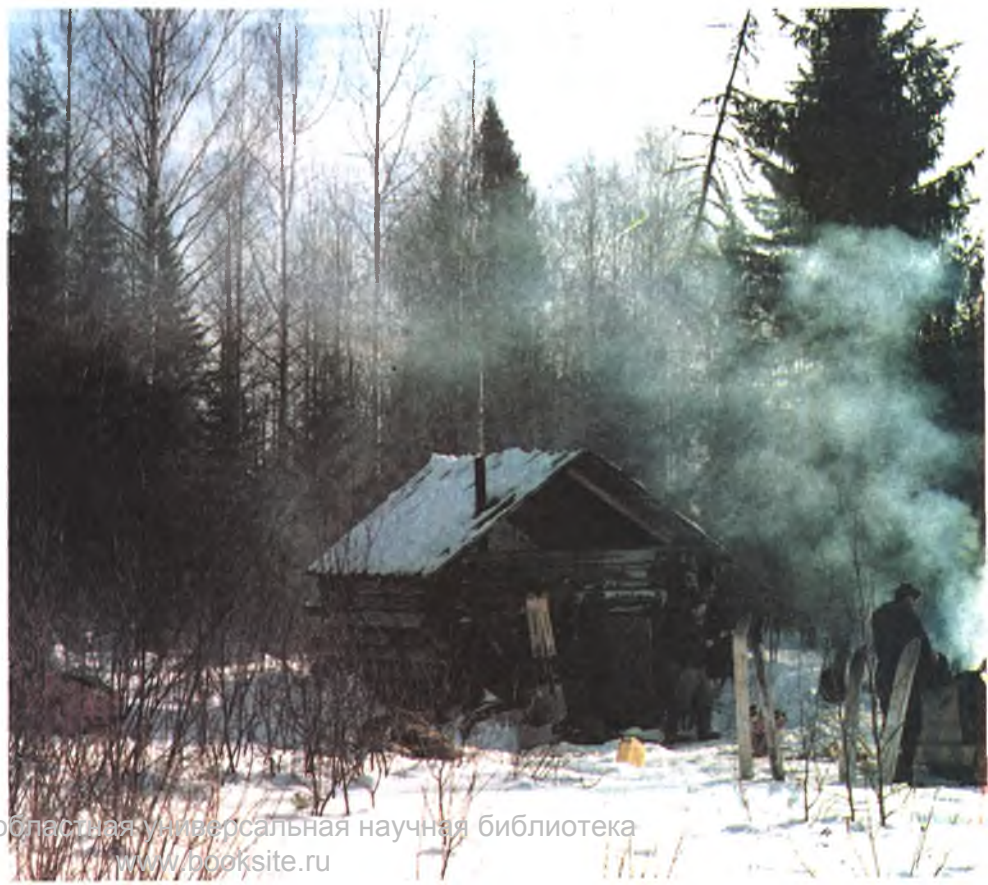
Фотоконкурс «Охота и природа»