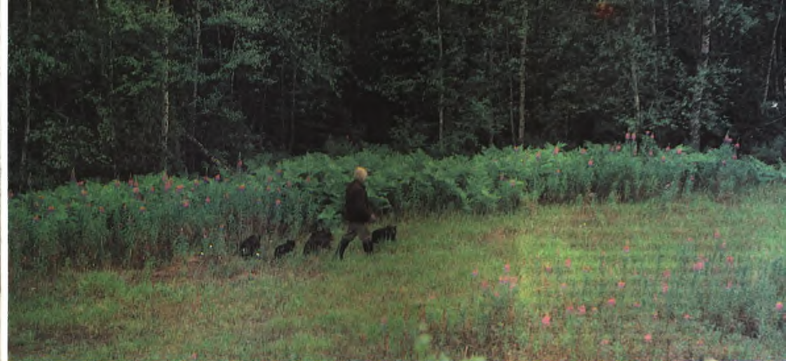
На утреннюю прогулку. В. Пажетнов, заменяя медвежатам мать, ведет их в лес, где они сами находят себе пропитание — зелень трав, корешки, яйца, личинки и куколки муравьев и т. д.