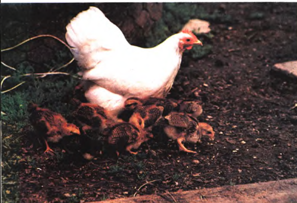
Карликовый кокихин с цыплятами карликового вельзумера