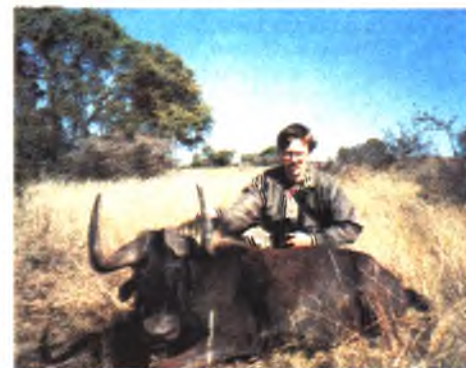
Черный гну, ЮАР

В 1998 году компания «Сафари и экспедиции» предлагает НОВЫЕ ОХОТЫ В ЭКЗОТИЧЕСКИХ СТРАНАХ: