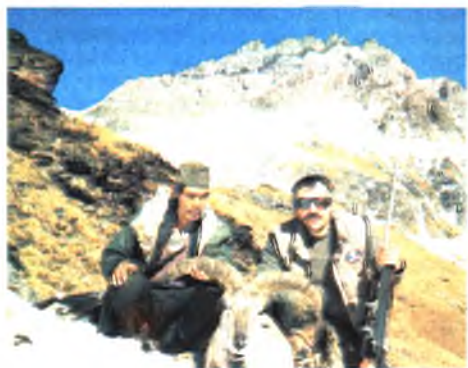
Голубой баран, Непал