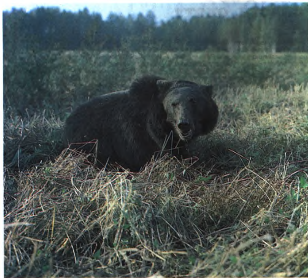
Медведи очень любят зерна овса, поэтому их часто можно увидеть на краю овсяного поля