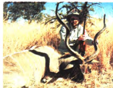
Антилопа Куду, ЮАР