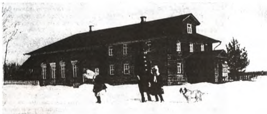
Наш дом — усадьба Пертовка на р. Шексне. 1910 г. Мои сестры и пес — спаниель Ровер

Реже случались радостные сны большой легкости, когда я, бывало, парил после прыжка в длину над какой-нибудь лужей или толпой. Поэтому наяву я тоже старался тренироваться в