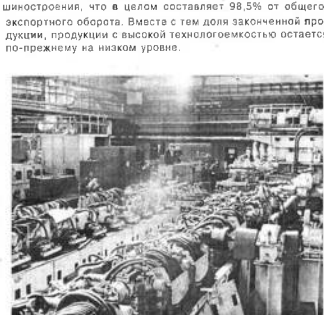
Область все еще остается «вывозящей», т. е. больше экспортирует, чем импортирует. В области все еще остается «вывозящей», т. е. больше экспортирует, чем импортирует. В области все еще остается «вывозящей», т. е. больше экспортирует, чем импортирует.

Важное значение в развитии внешнеэкономической деятельности имеют торговые контакты с регионами Российской Федерации и Украины.