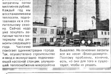
Бывалово. Но основные затраты все же несет «Вологдаэнерго». Поэтому проблема, конечно, не, она для того и существует, чтобы их решать.

- А как решается вопрос о зимних износительных теплостоя? - В этом году на Вологодские работы затрачено около миллиона рублей. Каждый год мы восстанавливаем теплостоя, поэтому, особенно в отопительном сезоне. Сейчас надо уже закупать газопасные емкости и материалы под ремонт следующего года. Частично помогает администрация города. Так, осуществлена срочная замена ввода эксплуатация подстанции на основной станции, улучшающей теплоснабжение микрорайона.