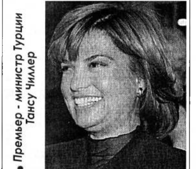
Премьер - министр Турция Тансу Чиллер

97 млн. презервативов для бесплатного распространения среди населения закупил ЮАР в рамках программы борьбы со СПИДом и обеспечения здоровья граждан.