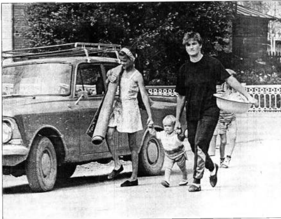
Путешествие по городу совершили журналист Юрий Александров, фотокорреспондент Иван Свирицкий. Авторы сердечно благодарят за радушие и гостеприимство тотемщины, власти города и района. По русскому обычаю желаем городу на Сухоне многие лета!