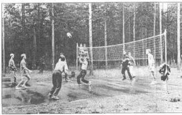
Волейбол - он и в лесу волейбол

12 - открытое первенство области по легкой атлетике среди ветеранов. Великий Устюг. В августе продолжатся игры чемпионата области среди команд коллективов физкультуры первой и второй групп.