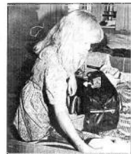
На Вологодском расставания поют.