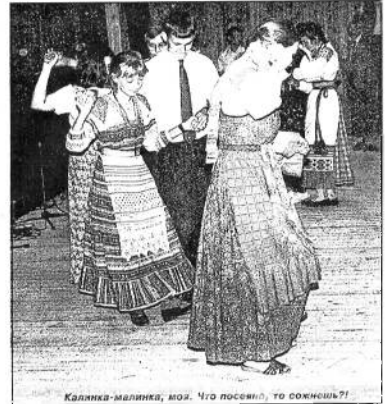
Калинка-малинка, мой. Что посеешь, то пожнешь!