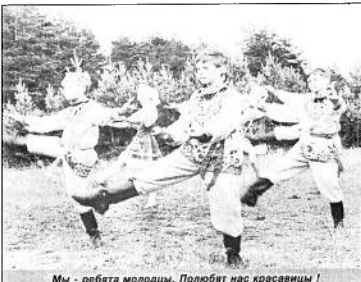
Мы - ребята молодцы. Полюбят нас красавицы!