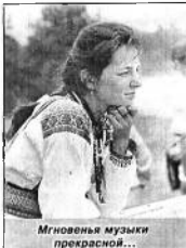
Мгновенья музыки прекрасной...