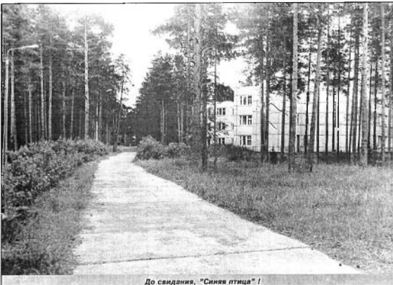
До свидания, "Синяя птица"!