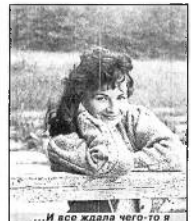
...И все ждала чего-то я хорошего, хорошего.