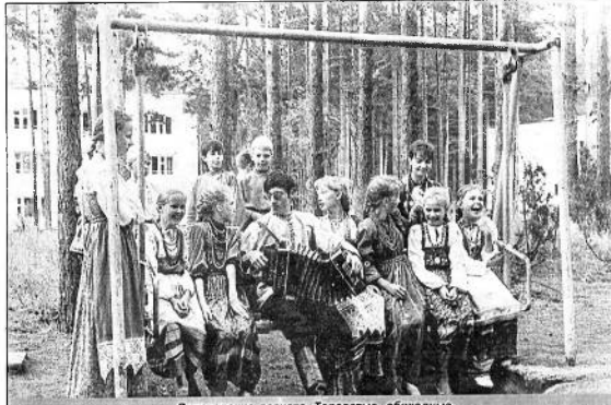
Вологодские девочки. Горюшки, обряды и закони. Своем дыхании народных традиций.