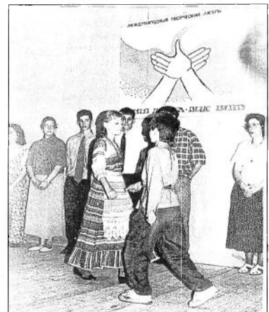
Давай пожмем друг другу руку. На долгий путь, на светлые года.