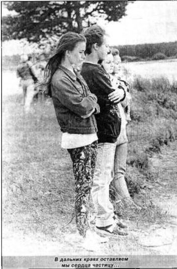
В дальних краях оставляем мы сердца частичку...