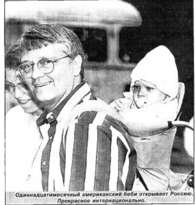
Одиннадцатилетний американский беби открывает Россию. Прекрасное интернационально.