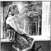
Аленушка. Старый мотив в новой интерпретации. Сам Васнецов позавидовал бы такому портрету.