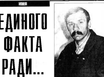
ИМЯ ФАКТА РАДИ...

в футбол: в одну - хоккей, а в другую - теннис.