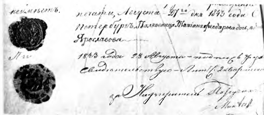
Оттиск сургучной печати, приложенный к подписи Т. Ф. Ярославовой

Попытки выяснить через Интернет, что обозначает изображение на этой печати, вывели меня на так называемые «горжеты» – часть мундира русской армии XVIII века. Иначе они называются – шейные (или нагрудные) офицерские знаки. Именно изображения на некоторых из них (не считая короны) больше всего напоминают оттиск печати, которой Т. Ф. Ярославова заверяла свою собственноручную подпись. Полностью идентичного изображения мне найти не удалось. Думается, что на печати изображен знак какого-то артиллерийского подразделения. В то же время вполне возможно, что печать просто отражает принадлежность ее