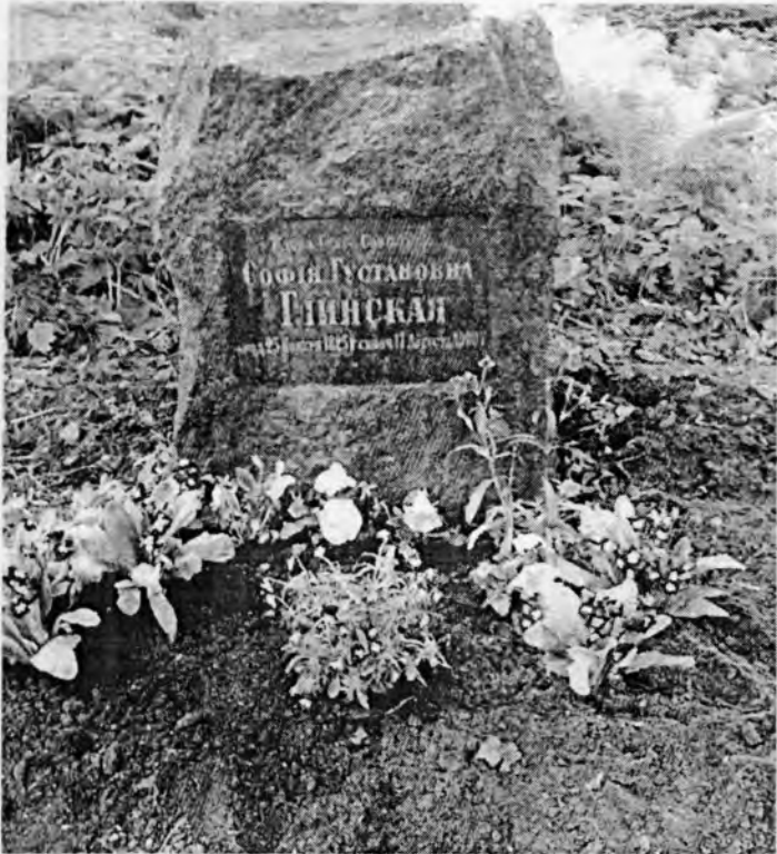
Могила Софии Густавовны Глинской на Смоленском лютеранском кладбище в Санкт-Петербурге

В отчаянии она с ребенком даже намеревалась покинуть Россию и взяла билет на пароход, но судьба распорядилась иначе – Дворянская опека воспретивала их отъезду. Софии Густавовне Глинской предстояло переменить с десяток адресов в Петербурге, прежде чем она поселилась в шведском квартале города – на Малой Конюшенной улице в доме баварца К. Вельша (сейчас это дом № 12), неподалеку от шведской церкви Св. Екатерины. Малую Конюшенную улицу в те годы украшал бульвар из привезённых из Риги лесных лип, традиционное место празднования Вербной недели. А сейчас тут проходят ежегодные празднования дней Швеции в Петербурге.