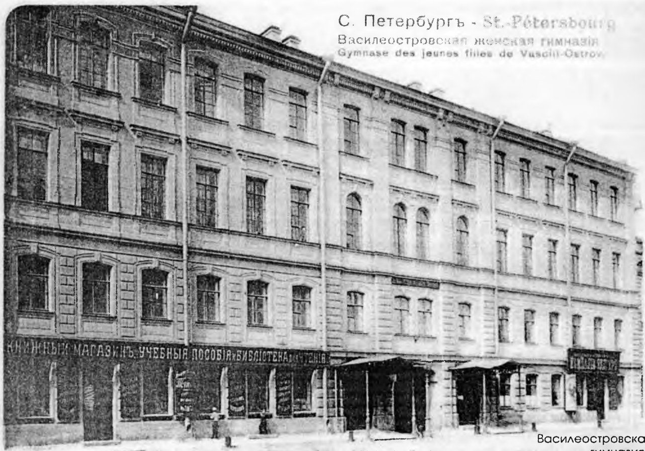
С. Петербургъ - St.-Petersbourg Василеостровская женская гимназія Gymnase des Jeunes filles de Vasili-Ostrov