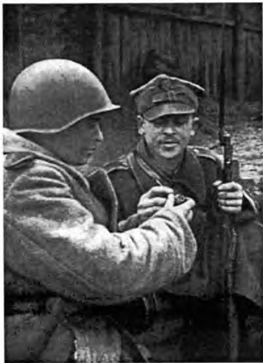
Красноармеец и боец 1-й Польской армии генерала З. Берлинга. 1-й Белорусский фронт. Октябрь 1944 г.

Подведем итоги. Грязовцу выпала роль хранителя польской военной и интеллектуальной элиты, уцелевшей после катынской бойни. Офицеры и полицейские, церковные и гражданские лица, пробыв около двух лет в суровых условиях военного плена, не были сломлены ни психологически, ни нравственно. Они не отказались ни от своей родины, ни от религии, ни от политических и моральных ценностей и, даже пойдя на контакт с советской властью, думали, прежде всего, о возрождении польской государственности. Надежды советского руководства на «перевоспитание» польского офицерства и интеллигенции потерпели крах.