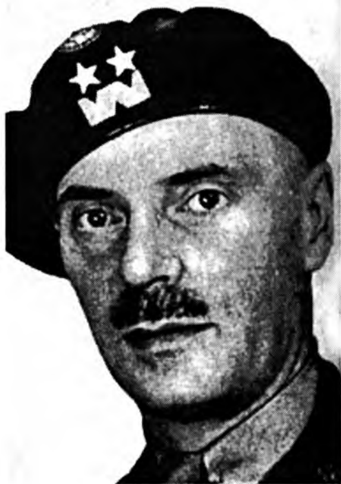
Владислав Андерс. Командующий польской армией на территории СССР (1941–1942 гг.)