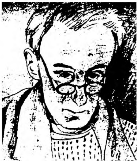
Юзеф Чапский. Автопортрет. 1940 г. Юхновский лагерь.

Начавшаяся война самым непосредственным образом отразилась на судьбах грязовецких узников. С конца июня 1941 г. в жизни лагеря начинается новый этап. Нападение