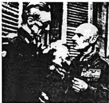
Генерал В. Андерс (справа) и ротмистр Ю. Чапский

и СССР после разгрома фашистской Германии 87 . Многие офицеры относились с открытым недоверием к штабу армии и лично генералу Андерсу и выражали беспокойство, «как бы Андерс не продался большевикам». Подобные настроения были отмечены и в школе подхорунжих, среди которых имелись «антикоммунистические элементы», призывавшие избегать активных действий и «дождаться, пока Германия и СССР взаимно измотают друг друга» 88 . Выходец из аристократической семьи, ротмистр Ю. Чапский вынашивал идею создания после окончания войны «федерации междуморья» в составе Польши, Венгрии, Румынии, Чехии, Словакии, Литвы, Латвии и Эстонии 89 .