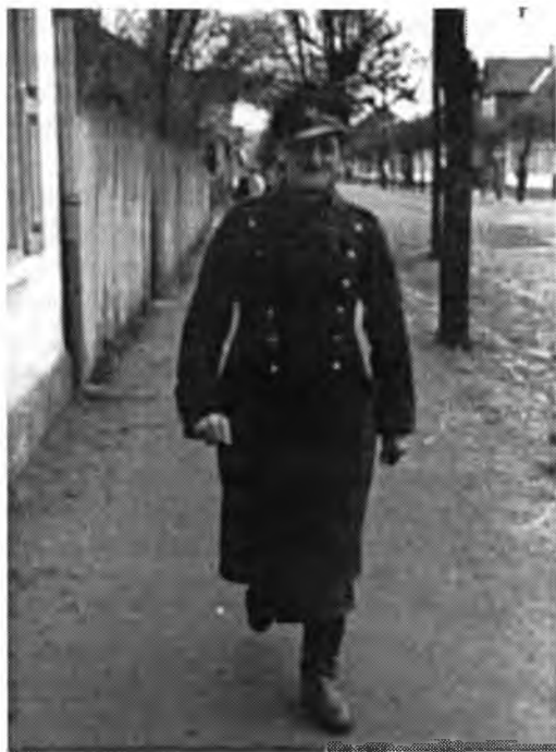
Фотографии из личных дел польских военнопленных

тырских стенах на лугу у реки, так что мы имели возможность часто бывать на свежем воздухе. Размещение и питание можно назвать хорошими. Питание – даже слишком хорошим...» 20 .