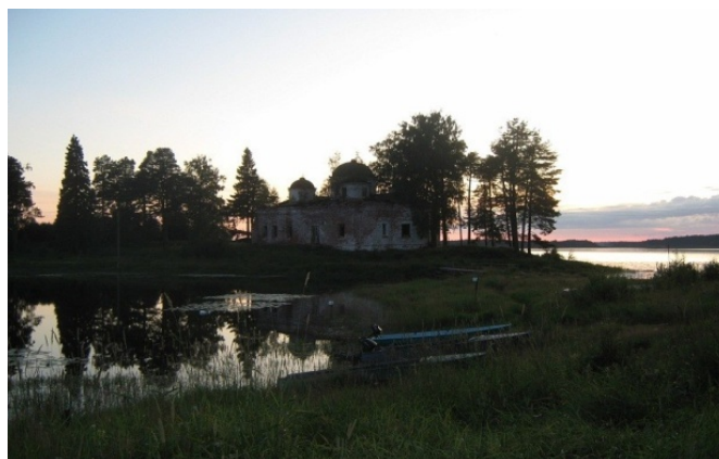
Ундозеро, церковь Богоявления Господня