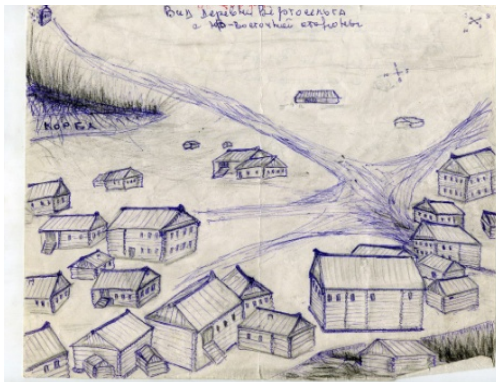
С восточной стороны «Кривой сёлги» на обрыве располагалась деревня Вертосельга (первое упоминание в писцовых книгах 15-16 вв. а последний житель покинул её в 1948 году)