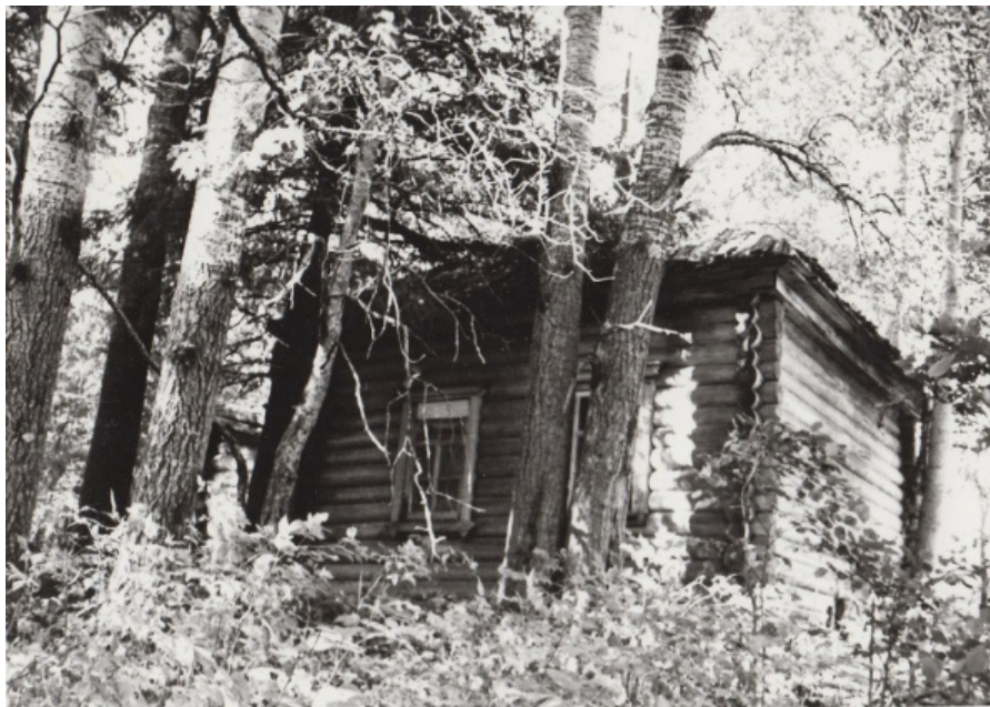
Остатки часовни, которая стояла на берегу корбы над Могильным болотом. Фото 1960-70 гг.