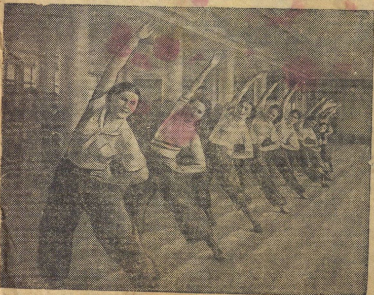
Группа девушек-комсомолок автозавода имени Сталина (Москва) выполняет гимнастические упражнения из комплекса ГТО.