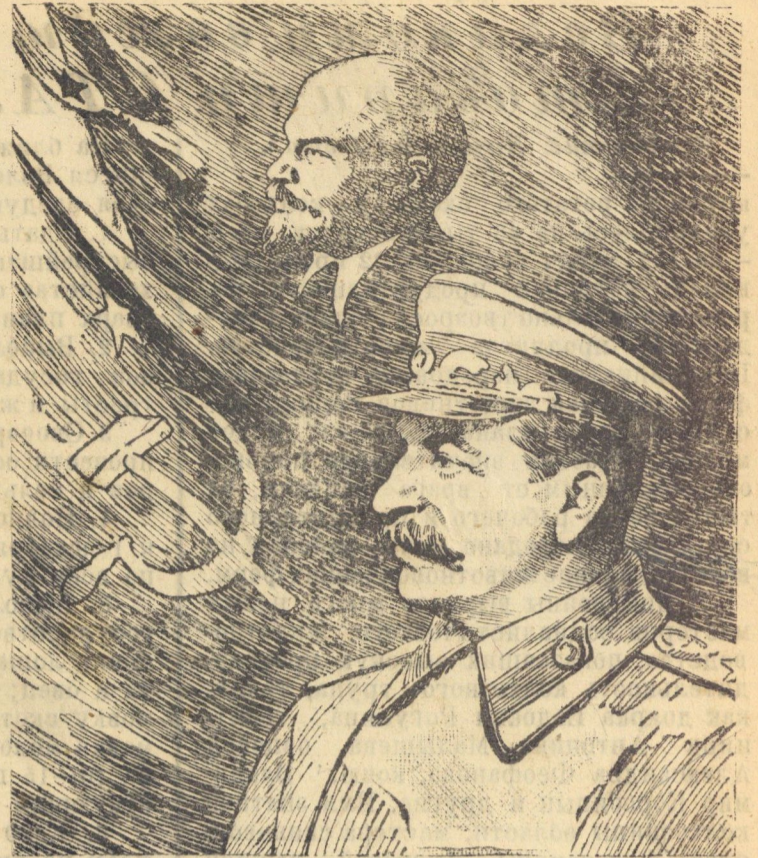
Рисунок Н. Аввакумова.

Под знаменем Ленина, под водительством Сталина — вперед, к новым успехам социа- листического строительства! Пусть здравст- вует и процветает наша великая Родина!