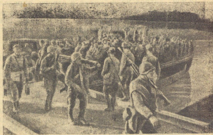
В Югославии Бойцы Красной Армии сходят на берег с баржи, доставившей их на территорию Югославии.