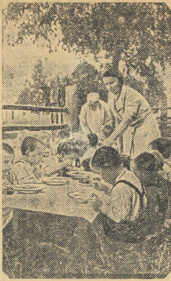
На время уборки в колхозе имени 2-й пятилетки (Ивановский район, Ивановской области) организованы детские ясли.

По имеющимся в распоряжении ТАСС данным эти сообщения основаны на недоразумении. Советское правительство не получало приглашений на это совещание, так как по характеру конференции участие какого-либо представителя Советского правительства на совещании в Квебеке не предполагалось и не предполагается.