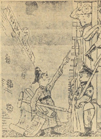
Гитлеровский „новый порядок“.

Партизанский отряд, действующий в одном из райо-