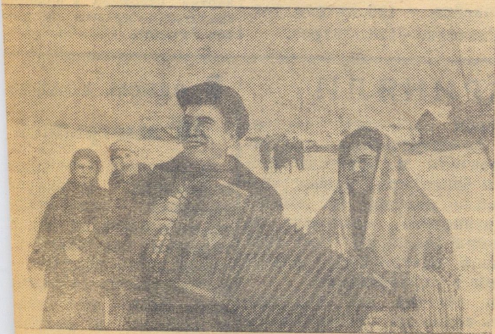
Точно и культурно живут колхозники сельхозартели „Урожай“ (Чистопольский район, Татарская АССР). Колхозное село гласилось благоустроенным клубом, избой-читальней, средней школой.

Особое внимание будет обращено на учет урожая осенью. Теперь сами колхозники не позволят смешивать урожай, пока он не учтен. Значит, осенью правление колхоза должно будет принять в натуре урожай, собранный каждым звеном и бригадой. Все это должно будет найти соответствующее отражение и в колхозном счетоводстве. Это мы сделаем. Колхозный учет призван содействовать борьбе за высокий урожай, а поэтому он должен быть четким во всех отношениях.