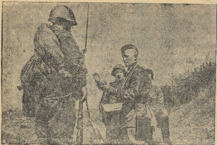
Раздача подарков от трудящихся бойцам на передовых позициях. (Западное направление).