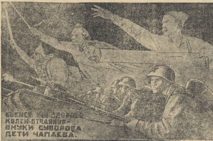
Рисунок художников Кукрыниксы. Текст С. Маршака. (Репродукция с плаката, выпускаемого изд. „Искусство“).

Лето на исходе, а работы в колхозах много. Теперь каждый час, использованный умело, оценивается очень высоко. Мы обязаны убрать урожай как можно скорее, не потеряв ни одного зерна. А это достигается упорным трудом, умелой постановкой дела. Уборка всегда была напряженным периодом хозяйственного года. В условиях военного времени эта напряженность возросла, а требования к нам повысились. Уборку урожая в этом году мы обязаны провести лучше, чем когда-либо. Значит, нужна организованность, организованность и еще раз организованность. Каждый колхозник, колхозница, престарелый, подросток должны понимать, что на поле, на гумне, всюду—они на боевом посту. И пока не выполнено задание, пока бригадир не разрешил идти домой—нельзя прекращать работу. С утра и до вечера, в ведро и в ненастье в каждом колхозе должен кипеть упорный творческий труд. Мы работаем на оборону, мы снабжаем фронт продуктами сельского хозяйства, и чтобы родина была довольна нашей работой—мы должны трудиться еще дружнее, напористее, организованнее.