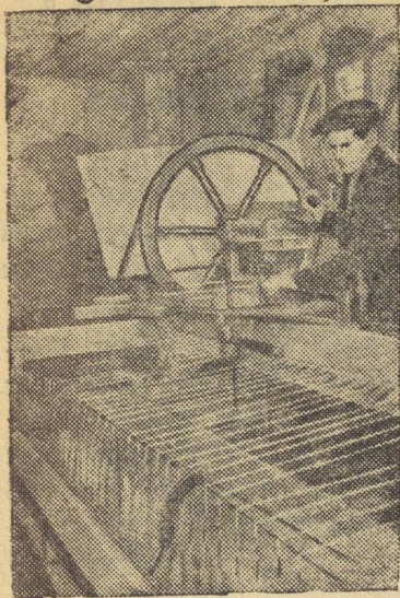
Киевская артель „Объединенный металлист“ освятила производство чесально-прядельных машин упрощенного типа, предназначенных для переработки шерсти, хлопка и льна. Первая серия этих машин будет выпущена в первом квартале текущего года. На снимке: проверка работы ручной прядельной машины.