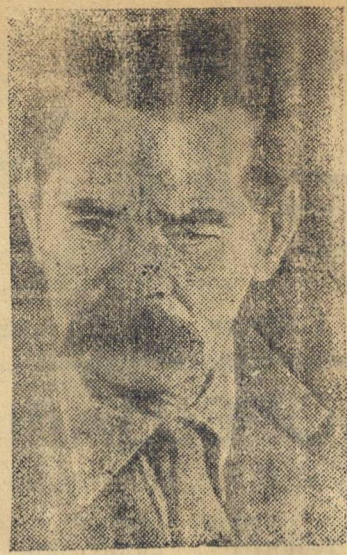
А. М. ГОРЬКИЙ