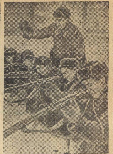
Город Ленина в дни обороны