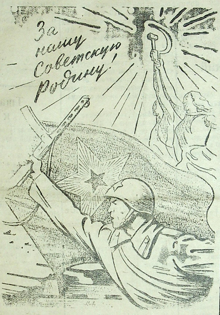
Слава советским войскам, водрузившим знамя победы над Берлином!

Дни гитлеровской Германии сочтены. Более половины ее территории заняты Красной Армией и войсками наших союзников. Германия лишилась важнейших жизненных районов. Оставшаяся в руках гитлеровцев промышленность не может снабжать немецкую армию достаточным количеством вооружения, боеприпасов и горючего. Любые резервы немецкой армии исчерпаны. Германия полностью изолирована и оказалась в