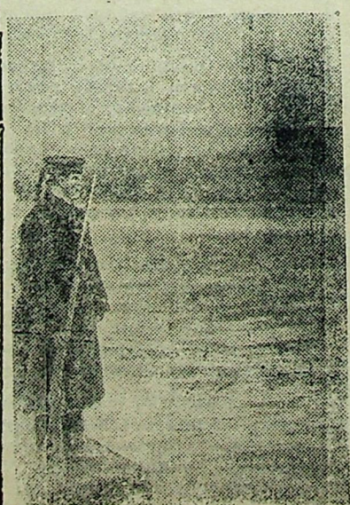
В героическом Севастополе