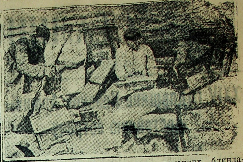
Вещи, найденные в одном из немецких блиндажей. Немецкие бандиты, как видно из снимка, не гнушаются даже мелкой домашней утварью.