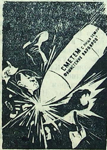
Рис. худож. Н. Долгорукова. (Репродукция с плаката, выпущенного издательством „Искусство“).

Зам. директора по политчасти Ляменгской МТС.