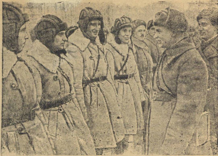
Героически сражаются с фашистскими бандами танкисты 1 Гвардейской мотострелковой Московской дивизии.