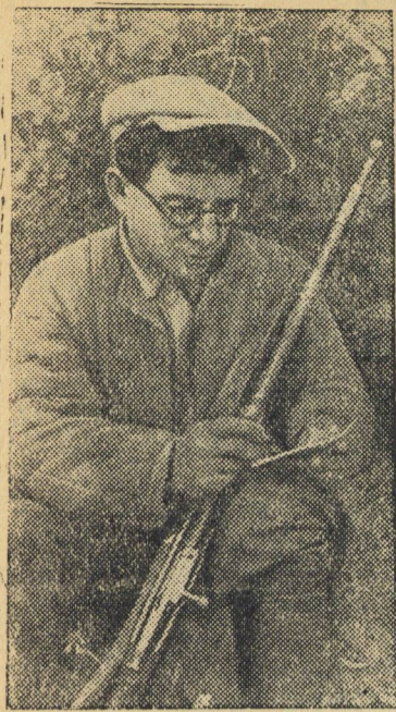
Действующая Армия. Боец партизанского отряда подписывает присягу Красных партизан. (Западное направление).