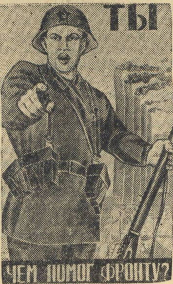
Рисунок художника Моор. (Репродукция с плаката, выпущенного издательством „Искусство“).