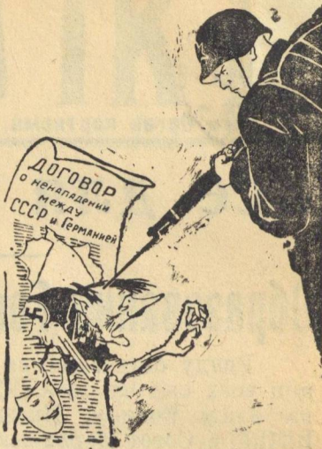
Рис. худ. Кукрыниксы (Репродукция с плаката, выпущенного издательством „Искусство“).