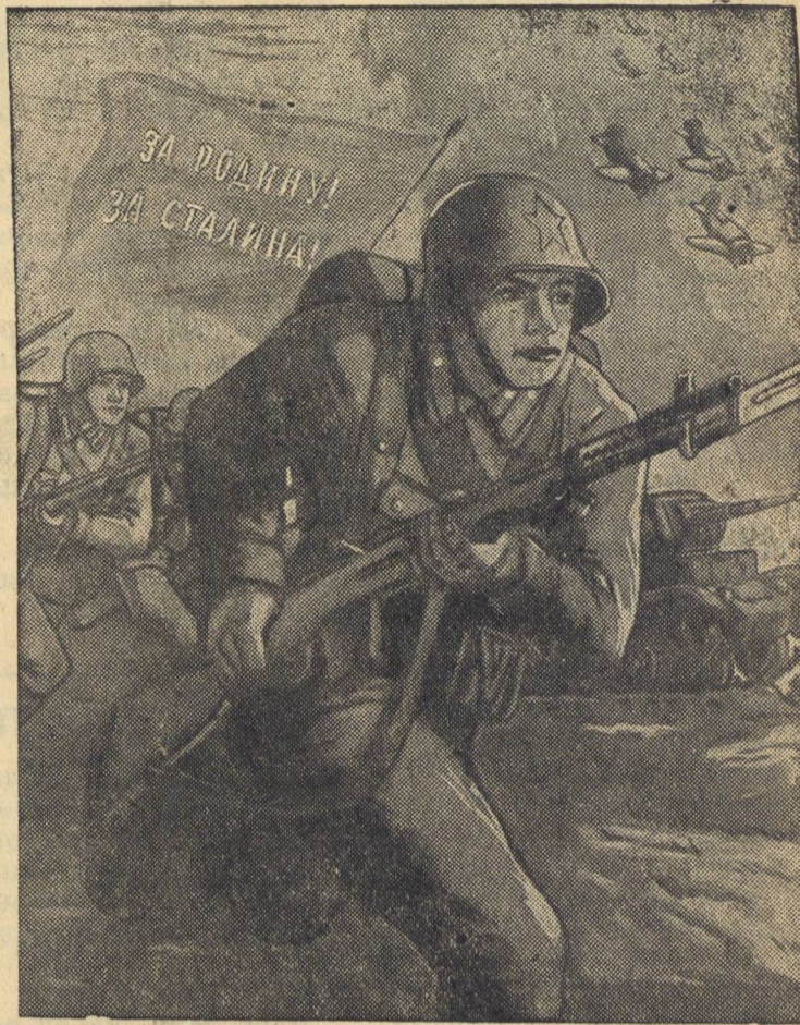
Рис. В. Иванова.

Стахановская работа паровозников—удар по коварному врагу. А. Шуйн.