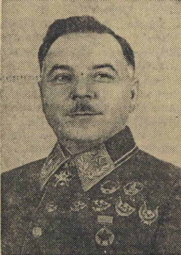
Заместитель Председателя СНК СССР Маршал Советского Союза К. Е. Ворошилов.