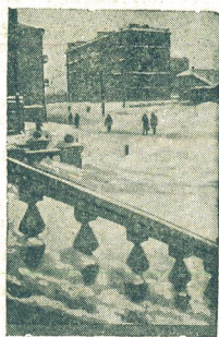
По городам Советского Союза. Зима в г. Магадане (Хабаровский край).