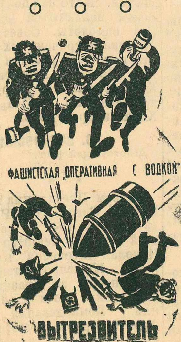
Рисунок В. Н. Горяева. (Окно ТАСС № 12). Фотохроника ТАСС

Всем корреспондентам были розданы подробные материалы о партизанском движении в тылу германской армии, а также обращение представителей советской армянской интеллигенции „К армянам всего мира“.