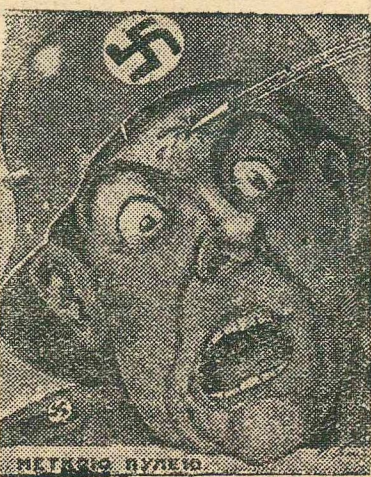
Рис. М. Авилова.