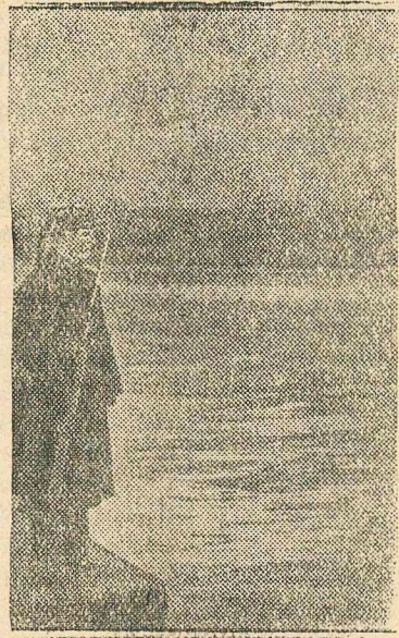
В героическом Севастополе.