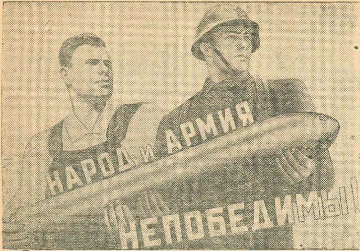
Рисунок художника В. Корецкого (Репродукция с плаката, выпущенного издательством "Искусство").